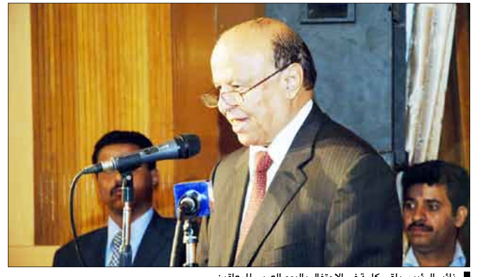
نائب الرئيس يلقي كلمة في الاحتفال باليوم العربي للمعاقين

أكد الأخ عبدربه منصور هادي نائب رئيس الجمهورية أن اهتمام القيادة السياسية والحكومة بالمعاقين وذوي الاحتياجات الخاصة سيتواصل ويتسع ويتطور أفضياً ورأسياً ليشمل إدماجهم في المجتمع. وأعرب نائب رئيس الجمهورية في الحفل الذي أقيم أمس بصنعاء، بمناسبة الاحتفال باليوم العربي للمعاقين عن سعادته بحضوره ومشاركة المعاقين احتفالهم. وقال : « إن الإعاقة الحقيقية فعلا التي يعاني منها الوطن هي تلك التي أصابت النفوس والعقول لدى أولئك الذين يحاولون إعاقة وعرقلة مسيرة بناء اليمن الجديد الموحد والديمقراطي وإيقاف عجلة التنمية بالنفخ في كبر نار الفتنة وتأجيج نيران النزعات المنطقية والمذهبية عبر إشاعة الحقد ونشر ثقافة الكراهية بين أبناء الوطن الواحد بهدف إعادتنا إلى عهد التخلف الإلزامي الكهنوتي وعهود الفرقة والتمزق في أزمنة الاستعمار والنظام السلاطيني وفترة الحكم الشمولي التشطيري.» وأردف : « وهاهم يواصلون أضغاث أحلامهم في حين يتوجب عليهم العودة إلى الواقع وإدراك أن الحوار هو الطريق الصحيح والسليم لإدارة اختلافاتنا وتبايناتنا من أجل اليمن ووحدته الوطنية وتقدمه ورفقه وازدهاره.» وأكد نائب رئيس الجمهورية أن الاهتمام بالمعاقين سيتواصل بإنشاء المزيد من دور الرعاية ورفع مستوى التأهيل الجسدي والفكري من خلال تطوير وسائل التعليم الخاصة بهذه الشريحة بما يجعلها تكتسب بعداً اجتماعياً ووطنياً وإنسانياً.