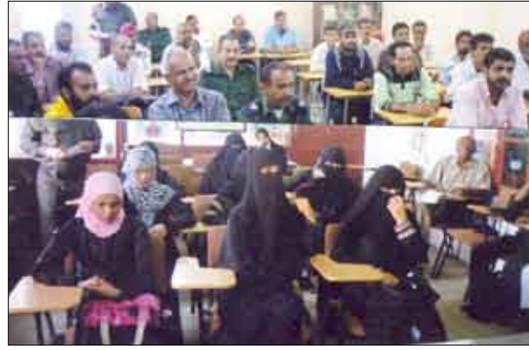
جانب من المشاركين في الدورتين