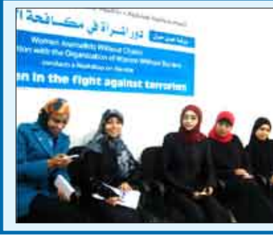
رئيس الجمهورية لدى تفقده أحد الأطفال المصابين أمس

«نساء بلا حدود» تناقش دور المرأة اليمنية في مواجهة الإرهاب والتطرف