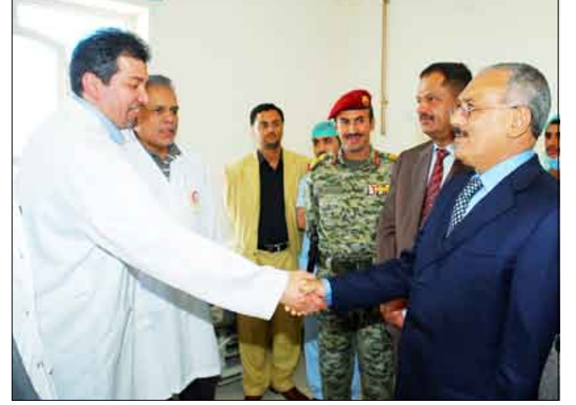
رئيس الجمهورية يلتقي المسؤولين والأطباء والعاملين في مستشفى 48