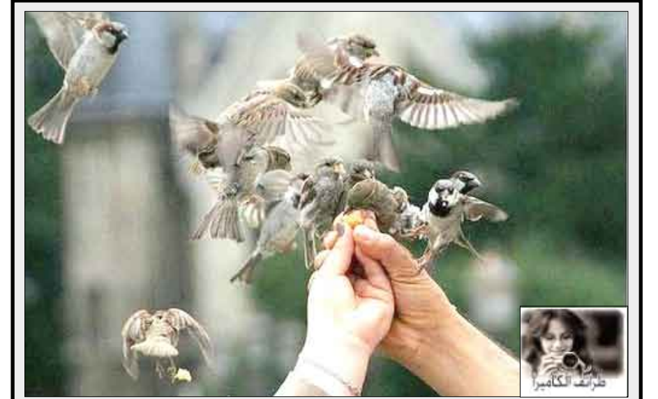
صورة رائعة لتجمع من الطيور تتهافت على الطعام

كشفت دراسة جديدة أن يناير هو شهر الخلافات الزوجية في بريطانيا، إذ يصل انفصال المتزوجين إلى درجة الغليان في الخامس والعشرين منه، الذي يطلقون عليه اسم يوم الشؤم بسبب المشاكل المالية والطقس وقلة النوم. ويتعين على الأزواج مواجهة الواقع بعد أعياد الميلاد ورأس السنة خاصة يوم الاثنين الأخير من شهر يناير وقبل تسليم الروايب، وأضافت الدراسة أن معظم المتزوجين في بريطانيا يتشاجرون حوالي ثماني مرات شهريا على مدار العام، لكن الرقم يتضاعف وصولا إلى نحو 15 مرة خلال شهر يناير.