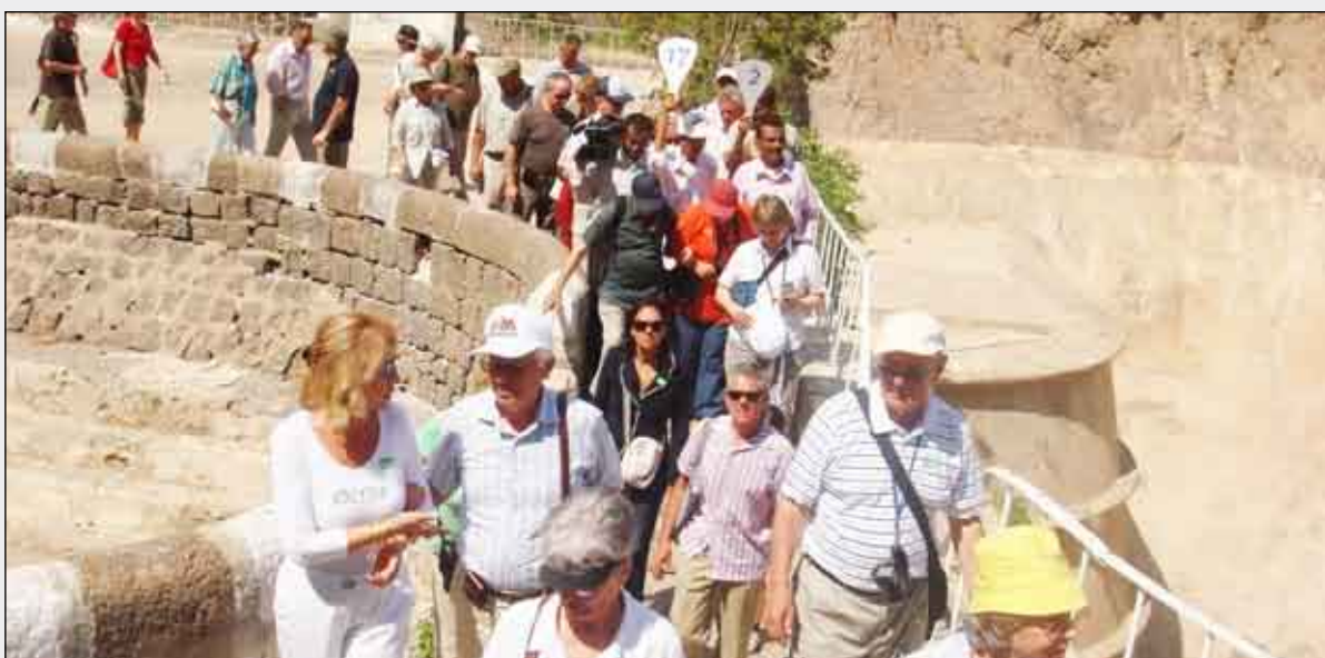
جانب من السياح الغربيين الذين زاروا عدن

2008م حيث بلغت 42 ألفاً و202 سائح مقارنة بـ 35 ألفاً و489 سائحاً عام 2008م. لكن رغم الزيادة التي سجلتها الإحصاءات أشارت الوافدين من قارة أوروبا فإن الإحصاءات أشارت إلى أن هناك انخفاضاً في عدد الوافدين من بعض دول القارة بنسبة 22 بالمائة و7 بالمائة للوافدين من ألمانيا وإيطاليا حسب الترتيب. كما بينت الإحصاءات أن هناك نسبة انخفاض في عدد الوافدين من كل من إقليم الشرق الأوسط والأمريكيتين بنسبة 1 و10 بالمائة على التوالي.