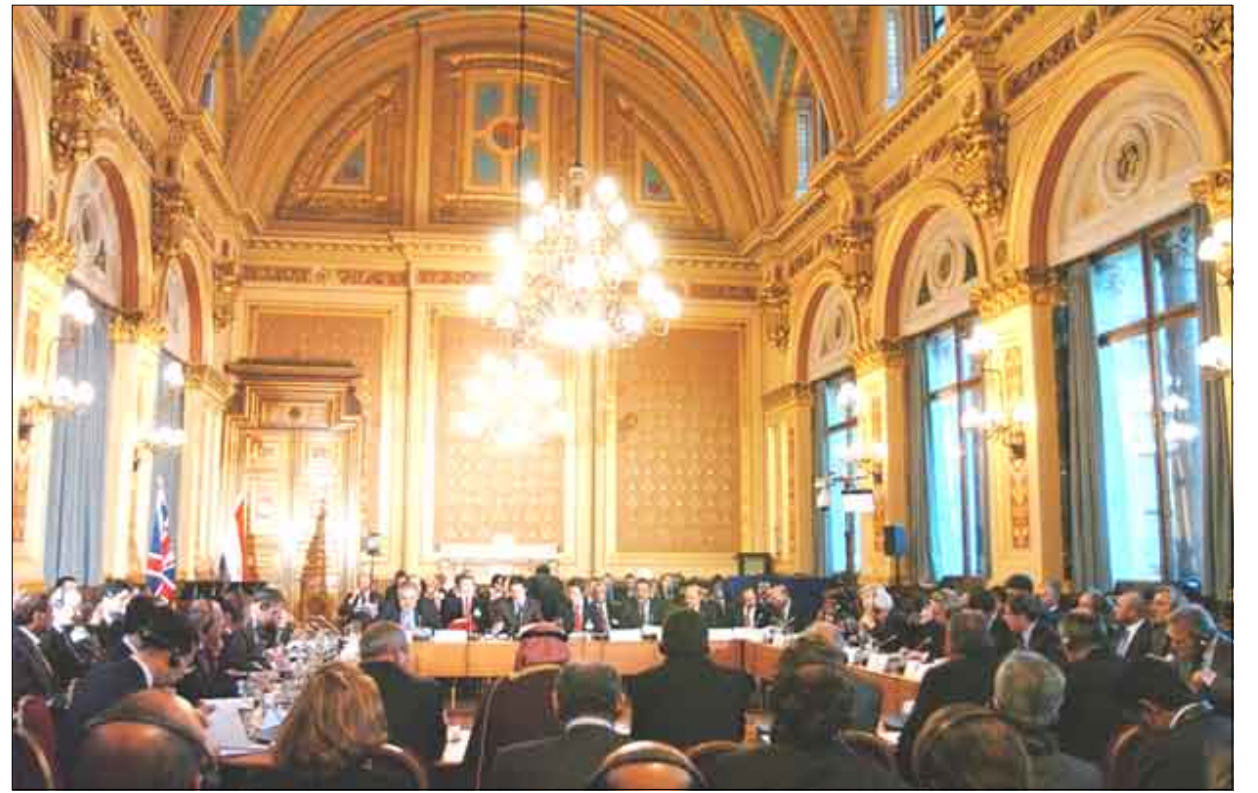
صورة عامة للمشاركين في مؤتمر لندن

أو إضاعة مزيد من الوقت دون تحرك إيجابي وحاد في الاتجاه الصحيح سيكلف بلادنا غاليا". وتطرق إلى مخاطر الإرهاب على الوطن بشكل عام وأهمية تضافر الجهود لمواجهة .. معبرة عن اعتقادها أن النجاح في تحجيم التطرف والإرهاب لن يأتي إلا في ظل نظام دولة باسطة نفوذ ومطبق للقانون على كل أجزاء الوطن. ورأت في هذا الشأن أن اتباع نظام الدولة المركبة في اليمن هو القادر على بسط نفوذ الدولة وتفعيل القانون على كامل تراب الوطن، والقادر على إرساء شراكة حقيقية تمنع أي شعور بالعجز أو بالظلم.. وكذا مانعة لاحتمال التطرف والإرهاب الذي لا تقتصر آثاره المدمرة على حدود اليمن فحسب بل تطل الإقليم والأمن والاستقرار الدوليين. وأشار البيان إلى أن اللجنة التنفيذية لحزب الرابطة ناقشت خلال دورتها الاعتيادية عددا من القضايا الحزبية، إضافة إلى مستجدات القضايا على الساحة الوطنية، والمخاطر المحدقة بالوطن وما يتطلبه ذلك من تعامل الجميع معها بجدية باعتبار ذلك مسؤولية وطنية وتاريخية ينبغي على كافة أبناء اليمن وقواه السياسية تحملها.