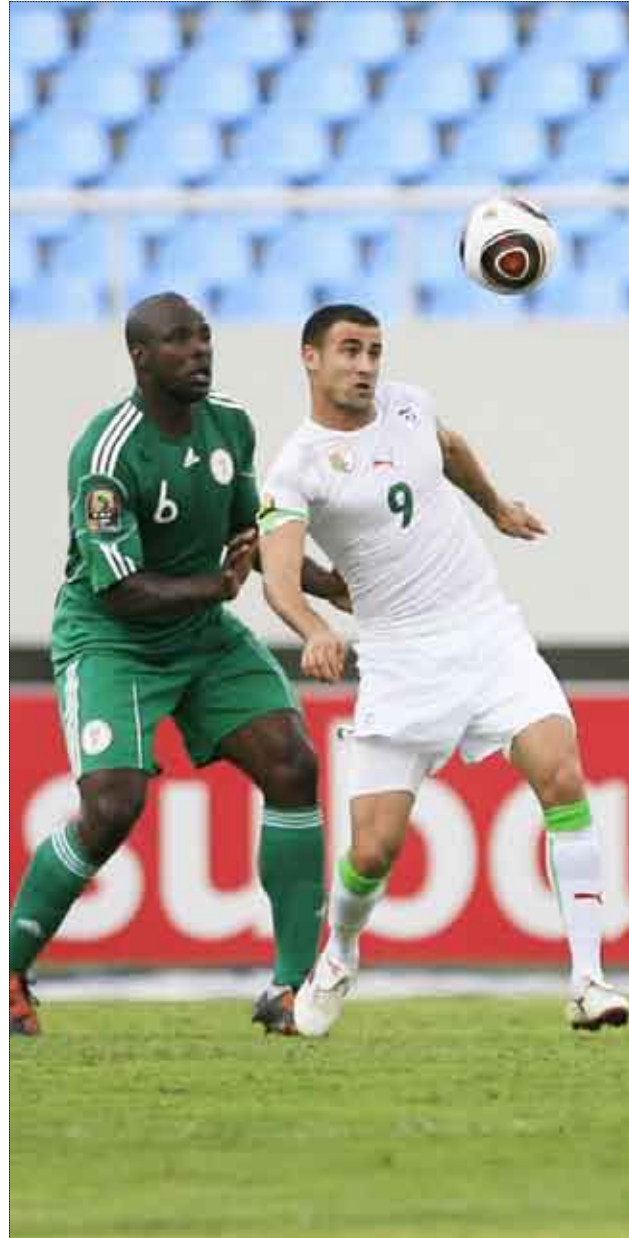
لقطة من المباراة

ورد حسن پیدا بتسديدة ضعيفة بين يدي الحارس فينستين اينياما (36)، وكاد مراد مغني يمنح التقدم للجزائر من تسديدة على الطائر فوق المرمى (44).