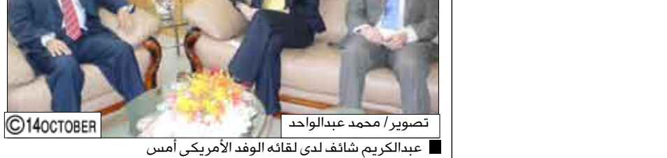
عبدالكريم بشائف لدى لقائه الوفد الأمريكي أمس