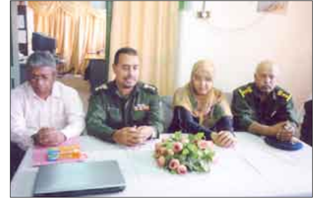
في حفل افتتاح الدورتين الخاصة بالدفاع المدني

نساء اليمن الذي يضم أكبر قاعدة نسائية هي القاعدة المستهدفة في عملية الإسعافات الأولية والسلامة سواء في منازلهن أو مواقع عملهن.