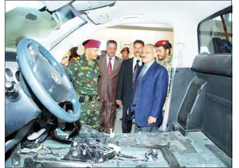
.. ويزور مديرية التأمين الفني التابعة لقوات الحرس الجمهوري