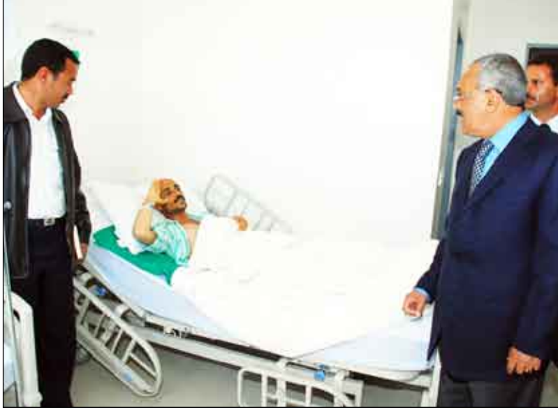
ويتفقد أحوال الجرحى من أبطال القوات المسلحة

الوحدة ستظل راسخة ولن تنال منها الأنشطة التخريبية الانفصالية