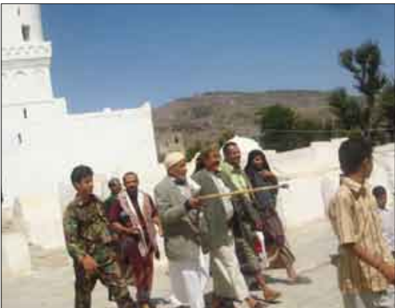
وكيل محافظة تعز يتفقد طريق النوازل بني عامر في مديرية جبل حبشي