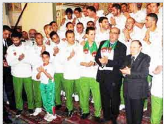
لقطة تجمع رئيس الوزراء احمد اويحيى بالمنتخب الجزائري

□ أنغولا / 14 أكتوبر / متابعة : سيكون رئيس الوزراء الجزائري احمد اويحيى في مقدمة مستقبلي بعثة المنتخب الجزائري لكرة القدم عندما صباح اليوم الأحد إلى الجزائر بعد مشاركتها في نهائيات كأس أمم أفريقيا المقامة بانجولا.