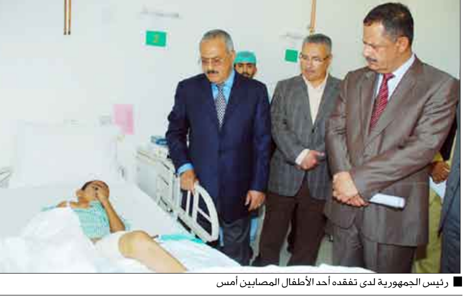
رئيس الجمهورية لدى تفقده أحد الأطفال المصابين أمس

صنعاء / سيا : قام فخامة الأخ الرئيس علي عبدالله صالح رئيس الجمهورية القائد الأعلى للقوات المسلحة أمس بزيارة إلى مستشفى 48. وقد زار فخامة رئيس الجمهورية الطفل عبدالرحيم فيصل قائد الدكيم الذي أصيب ضمن مجموعة الأطفال من طلاب مدرسة زيد بالضالع من قبل العناصر التخريبية التي قامت بالاعتداء على طلاب المدرسة وهم يؤدون امتحاناتهم وقد عبر عن إدانته واستهجانته لهذا العمل الإجرامي المشين الذي ارتكبهت العناصر المرتدة عن الوحدة والخارجة على النظام والقانون مؤكداً بأن هذه العناصر الإجرامية التي قامت بالاعتداء على الطلاب وغيرهم من المواطنين لن يفلتوا من العقاب وستأخذهم يد العدالة. كما تفقد فخامة الأخ الرئيس أحوال عدد من الجرحى من الذين أبلوا بلاءً حسناً في أدائهم لواجباتهم في معارك الدفاع عن الثورة والجمهورية في المنطقة الشمالية الغربية. وأشاد فخامة رئيس الجمهورية بالروح المعنوية والتفاني في أداء الواجب من قبل هؤلاء الأبطال الذين لم يدخلوا على الوطن بأرواحهم ودمائهم وقدموا البطولات النادرة في ميادين المواجهة ضد العناصر الإرهابية المتمردة. وقد التقى فخامة الرئيس بالفريق الطبي من المملكة العربية السعودية الشقيقة وعبر لهم عن شكره لأدائهم الجيد والمتميز وما يقدمونه من خدمات طبية وإنسانية لأشقائهم في اليمن. كما زار فخامته مديرية التأمين الفني التابعة لقوات الحرس الجمهوري وأطلع على سير العمل في المديرية وما أنجزته في مجال التصنيع الحربي ومنها ما ينصل بتطوير العرابت إلى نقلات جنود مدرعة والتي يتم رفد قواتنا المسلحة والأمن بها.