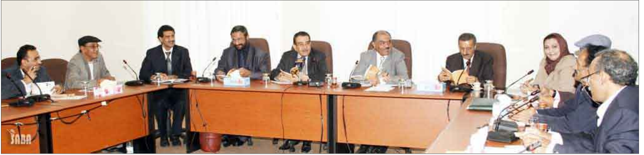
اجتماع اللجنة التحضيرية برئاسة وزير الإعلام والثقافة