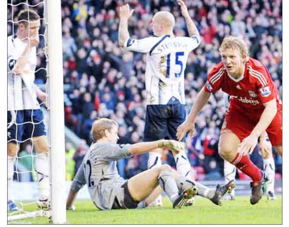
من مباريات الدوري الإنجليزي

وفي الشوط الثاني، كانت لاينساوا اليد الطولى ايضا في الهدف الثاني بعد ان اطلق كرة قوية ييسراه من خارج المنطقة فارتطمت بكيفين ديفيس وتحولت خطأ داخل مرماه (70) ليحسم الفريق الاحمر النتيجة في صقلته نهائياً. وكان توتنهام في طريقه لتحقيق الفوز على مضيفه برمنغهام مفاجأة الموسم عندما تقدم عليه بهدف لمهاجمه الدولي جرماين ديفو (69) مسجلاً اول اهدافه منذ مطلع العام الحالي، لكن الأخير ادرك التعادل في الوقت بدل الضائع بواسطة ليام بريدجويل لينتزع نقطة ثمينة. وتابع استون فيلا ضغطه على فرق الصدارة بفوزه خارج ارضه على فولهام بثلاثية لمهاجمه الدولي غابريل اغبونلاهور سجلهما في الدقائق الخمس الاخيرة من الشوط الأول (40 و45).