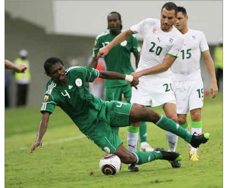
من مباراة نيجيريا والجزائر