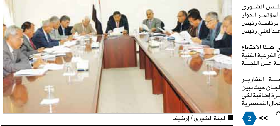
لجنة الشورى / إرشيف