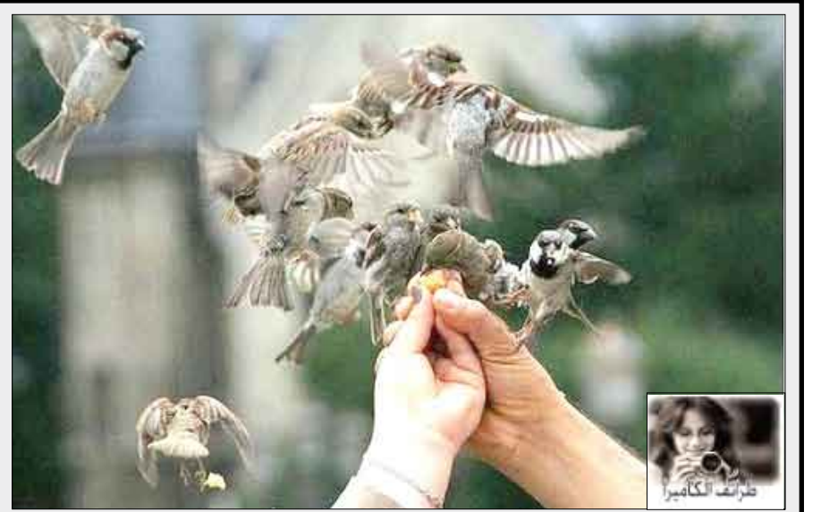
صورة رائعة لتجمع من الطيور تتهافت على الطعام

كشفت دراسة جديدة أن يناير هو شهر الخلافات الزوجية في بريطانيا، إذ يصل انفصال المتزوجين إلى درجة الغليان في الخامس والعشرين منه، الذي يطلقون عليه اسم يوم الشؤم بسبب المشاكل المالية والطقس وقلة النوم. ويتعين على الأزواج مواجهة الواقع بعد أعياد الميلاد ورأس السنة خاصة يوم الاثنين الأخير من شهر يناير وقبل تسليم الروايب، وأضافت الدراسة أن معظم المتزوجين في بريطانيا يتشاجرون حوالي ثماني مرات شهريا على مدار العام، لكن الرقم يتضاعف وصولا إلى 150 مرة خلال شهر يناير.