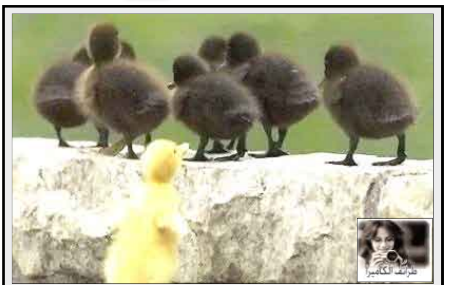
نهاركم أسود غيرتوا ملابسكم وتركتوني؟ ماما قالت خذوني معكم