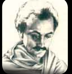
جبران خليل جبران

إن الأرض عرفت أناساً فرغت بطونهم من لذائذ العيش وامتلات قلوبهم بخيرات الحب والجمال والمعرفة والحرية.. إنهم الفقراء.