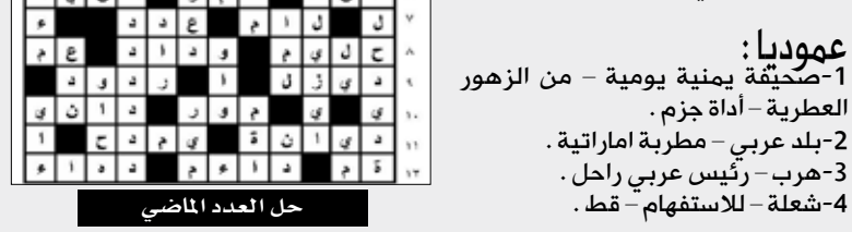
حل العدد الماضي