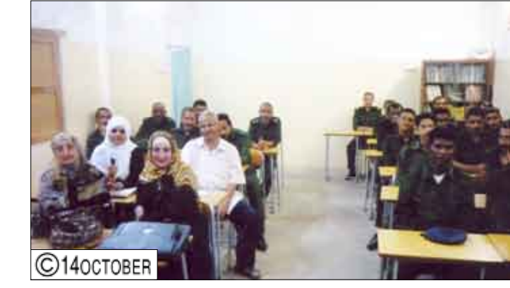
جانب من المشاركين في الدورة

ألقى الأخ العقيد دكتور / راشد سعيد مصلح مساعد مدير الأمن لشؤون الشرطة كلمة توجيهية لنيابة عن الأخ العميد ركن/ عبدالله عبيد قيران مدير عام أمن محافظة عدن أشاد فيها بعلاقات التعاون والتنسيق بين الأجهزة الحكومية والإنسانية القائمة بين