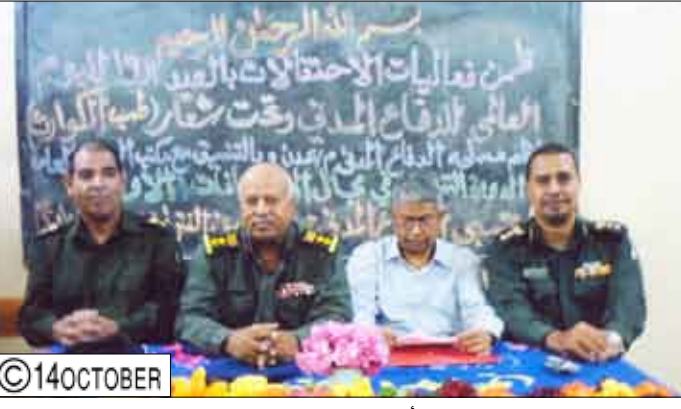
خلال افتتاح دورة الإسعافات الأولية