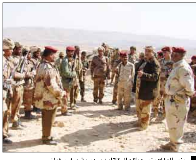
وزير الدفاع يزور مواقع المقاتلين بمديرية حرف سفيان

تنفيذ المهام والأعمال القتالية البطولية ضد بقايا الفلول المتهاوية من العناصر التخريبية والإرهابية. ونقلًا للمقاتلين تحيات فخامة الرئيس علي عبدالله صالح رئيس الجمهورية القائد الأعلى للقوات المسلحة، وتقديره واعتزازه بما يؤديون من أعمال جليلة في تنفيذ واجبه المقدس، وما ينفذونه من مهام في إطار واجباتهم الوطنية والدستورية بكفاءة واقتدار عال في مواجهة ومطاردة فلول الإرهاب والتخريب، من أجل تثبيت وترسيخ