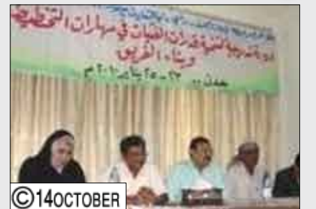
من فعاليات الدورة التدريبية الخاصة بتنمية قدرات الفتيات

وتهدف الدورة التي تستمر على مدى ثلاثة أيام وتشارك فيها 20 فتاة من أعضاء الحزب ومناصرات من منظمات المجتمع المدني إلى إكساب الفتيات الخبرات والمهارات اللازمة في القيادة والتخطيط والمشاركة وبناء الفريق. وفي افتتاح الدورة القى الدكتور جواد مكاوي رئيس منظمة المجتمع