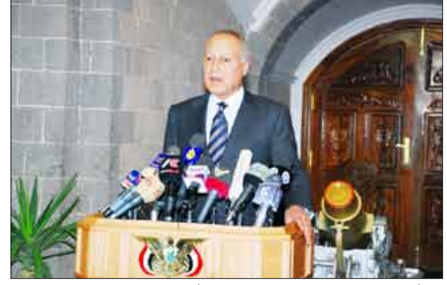
أبو الغيط في المؤتمر الصحفي بصنعاء أمس

جسد وزير الخارجية المصري الدكتور / أحمد أبو الغيط التأكيد على موقف جمهورية مصر العربية قيادة وحكومة وشعباً الداعم لليمن وأمنه واستقراره ووحدته. وقال وزير الخارجية المصري وفي تصريح لوسائل الإعلام عقب لقائه فخامة الأخ رئيس الجمهورية أمس: حملت رسالة دعم إلى فخامة الرئيس علي عبدالله صالح من أخيه من فخامة الرئيس محمد حسني مبارك والحكومة والشعب المصري. تؤكد وقوف مصر إلى جانب اليمن ودعمها له بكافة أوجه الدعم السياسي