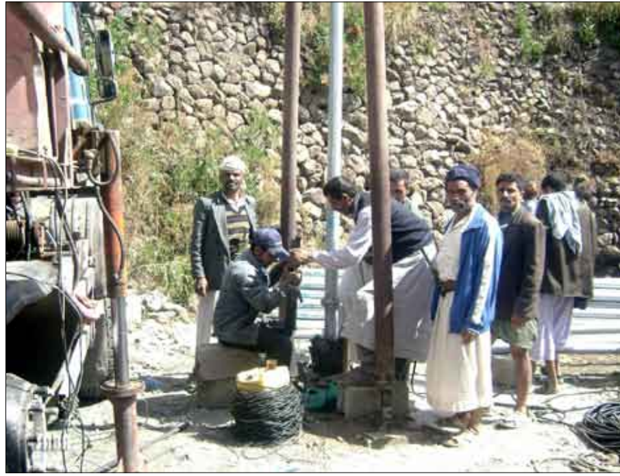
صورة لأحد مشاريع مياه الريف بصنعاء.