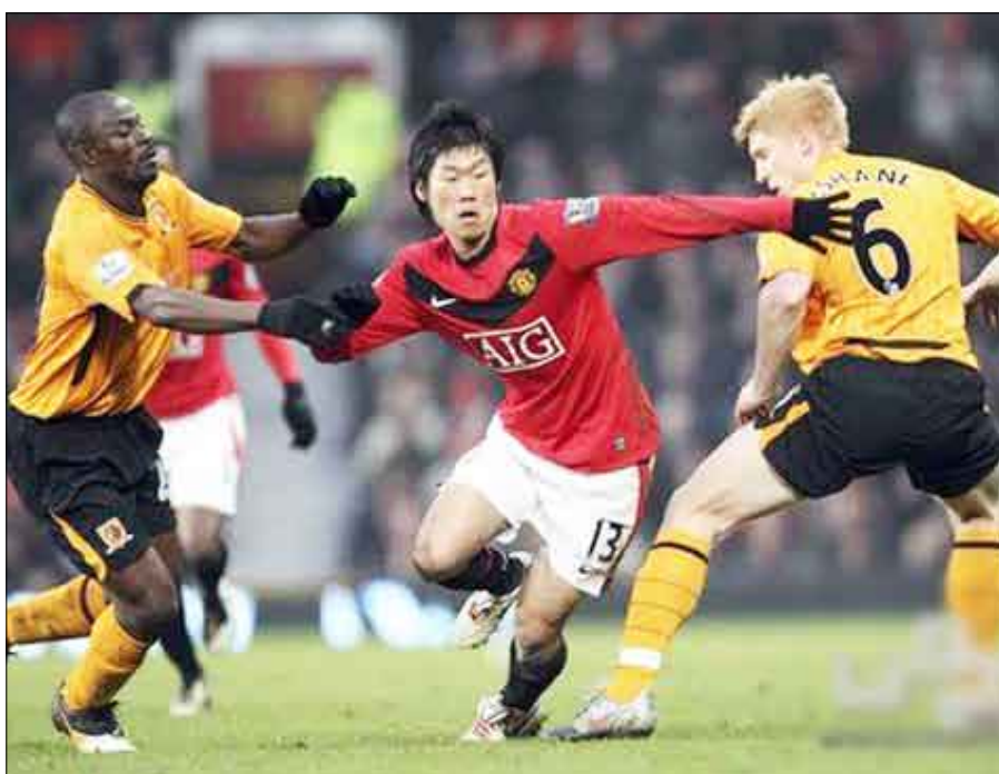
لقطة من المباراة