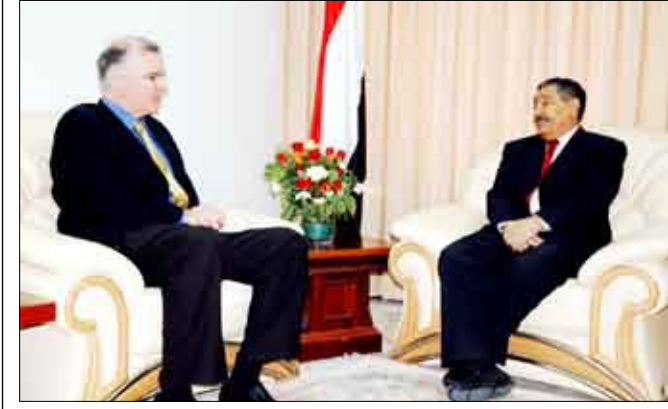
رئيس مجلس الشورى يستقبل مدير المعهد الديمقراطي الأمريكي

استقبل رئيس مجلس الشورى عبد العزيز عبدالغني أمس مدير المعهد الديمقراطي الأمريكي لشؤون أفريقيا والشرق الأوسط ليسي كامبل الذي يزور اليمن حالياً. واستحوذت مسألة التحضيرات الجارية لانعقاد مؤتمر الحوار الوطني في 30 يناير الجاري، على اللقاء الذي عرض خلاله رئيس مجلس الشورى مجمل التطورات المتصلة بهذه المسألة، وما تم إنجازه على صعيد إنفاذ الدعوة الرئاسية إلى