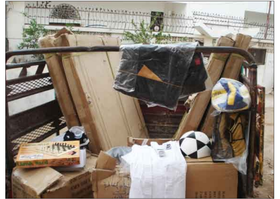
ادوات رياضية لنادي سلام طور الباحة والمقاطرة

عن الأفكار والممارسات الهادمة. وقالت مستولة النشاط الرياضي في كمران: من هذا المنطلق استشرع الشيخ توفيق صالح مدير الشركة المسئولة وليي نداء الواجب من خلال مد يد المساعدة للأندية حتى أصبحت شركة كمران الداعم الأول للشباب والرياضيين عبر رفق صندوق النشء والشباب بأكثر من مليار ريال يعني شهرياً، بالإضافة إلى الدعم المباشر الذي تتلقاه الأندية من قبل الشركة».