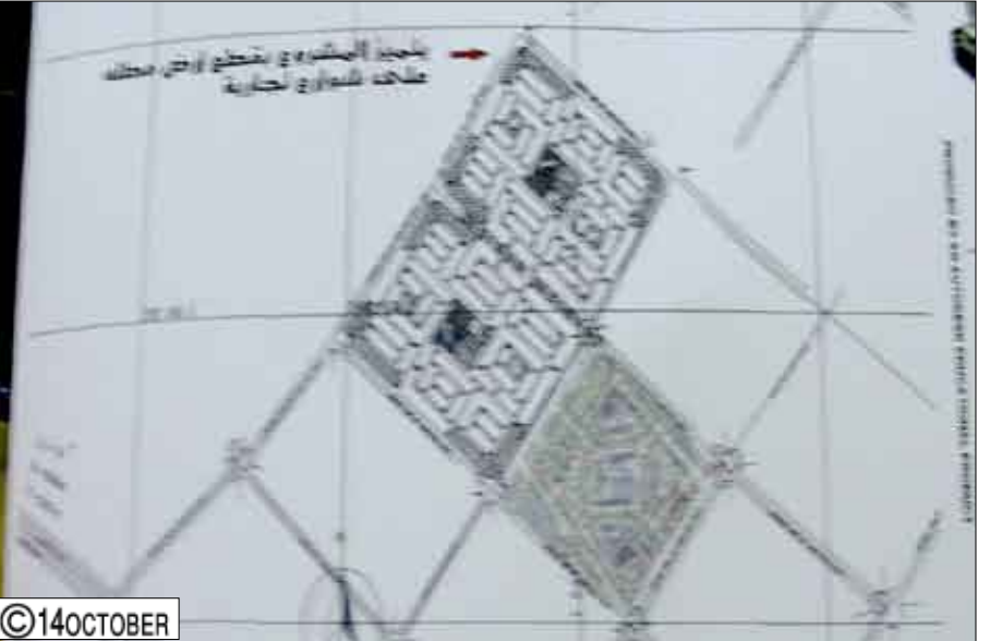
مخطط مشروع مدينة السلام السكني بحجة.

مشروع السلام السكني قد تم وضع الترتيبات اللازمة لعملية الإسقاط لكافة الخدمات العامة فيه وكذا المخطط الحضري للوحدات السكنية فيه بطريقة حضرية راقية. وخلال الزيارة أشاد وكيل حجة المساعد بالمشروع والشركة المنفذة له مشيراً إلى أن قيادة المحافظة دعمت وستدعم مثل هذه المشاريع الجيدة التي من شأنها توفير مناخات متميزة للموظفين وصولاً إلى مستقبل جيد، موضحاً أن مشروع مدينة السلام السكني يأتي ضمن توجهات برنامج فخامة الأخ رئيس الجمهورية الانتخابي الذي أكد فيه على أهمية دعم التوجهات الاستثمارية المحلية، داعياً كافة المستفيدين من أبناء محافظة حجة للمساعدة في الالتحاق بمثل هذه المشاريع