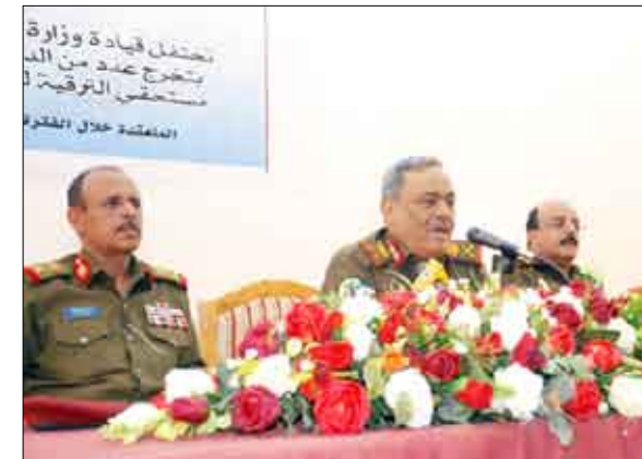
اللواء الأشول يلقي كلمته في احتفال التخرج