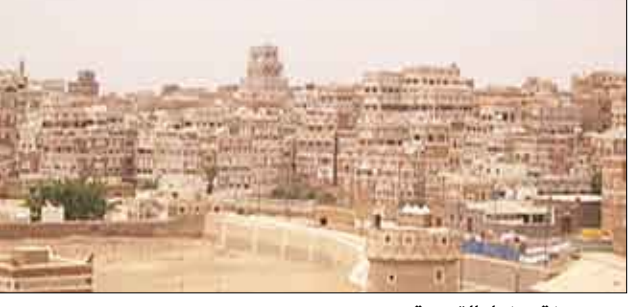
مدينة صنعاء القديمة