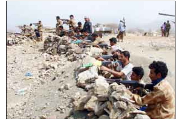
جانب من المقاتلين

الأبطال للعديد من الأوكار والمعاقل التي تتمرس فيها العناصر الإرهابية الخارجة على النظام والقانون. وأكد وزير الدفاع ونائب رئيس الأركان للمقاتلين اعتراز الوطن والشعب بصلابتهم وبطولاتهم وتضحياتهم الجسيمة وحثا المقاتلين على مضاعفة جهودهم في مواصلة وتطوير الأعمال القتالية العسكرية والأمنية في تعقب ومطاردة وتمشيط الجيوب الإرهابية والتخريبية لتلك الفئة الباغية والضالة التي تعيش انهيارات متتالية من جراء الضربات الشديدة والدقيقة من الأبطال الأشداء من منتسبي المؤسسة الدفاعية والأمنية، والمجاميع الشعبية. وأكد وزير الدفاع أن هذه الفئة باتت تعاني من عزلة نفسية خانقة بعد أن لفظها أبناء صعدة وسفيان الذين أكدوا مساندتهم لإخوانهم أبناء القوات المسلحة والأمن من أجل اجتثاث تلك الفلول الإرهابية والتخريبية واستعادة الأمن والاستقرار وعودة المواطنين النازحين إلى قراهم وأعمالهم ومزارعهم. من جانبهم أكد المقاتلون الأبطال البواسل أنهم في أعلى مستويات الاستعداد والإصرار