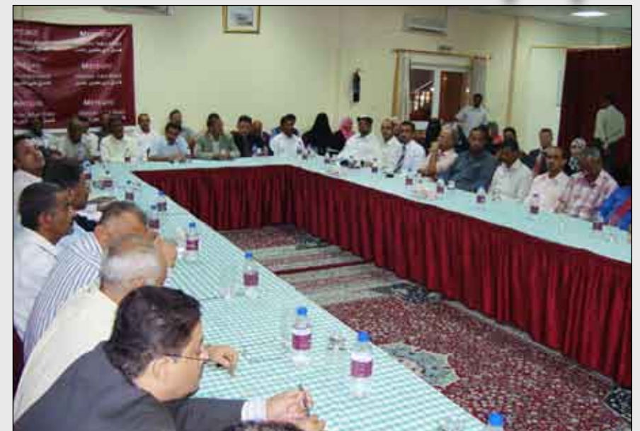
جانب من الحضور في الورشة

الموارد المهمة في اليمن وجدد جابو تعهد الاتحاد بدعم القطاع السمكي مستقبلاً ضمن المشروع السمكي الجديد الذي سيبدا في عام 2010م ، بالإضافة إلى دعم بعض القطاعات التي تعتبر مهمة للقطاع السمكي وتحديد فيما يخص المخزون السمكي والإستراتيجية الجديدة للقطاع السمكي ، مؤكداً استعداد الاتحاد للعمل من أجل تطوير هذا القطاع .