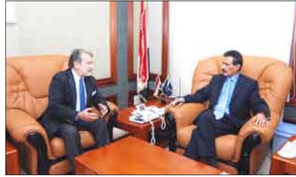
... ويلتقي مدير شركة (اي اس اي-جروب) الإيطالية

مؤكداً استعداد وزارة الداخلية في إنشاء إدارة عامة مختصة بشؤون اللاجئين بالإضافة إلى ما تقدمه الأجهزة الأمنية من مساعدات إنسانية للاجئين الأفارقة خاصة في مخيم إيواء اللاجئين بخرز وكذلك التسهيلات التي تقدمها وزارة الداخلية وتعاونها المستمر مع مختلف الأنشطة التي تقوم بها المفوضية بمختلف برامجها. وأشارت إلى إن المنظمة ستضاعف جهودها في دعم اللاجئين وستقوم بإنشاء مراكز لاستقبال جديدة إلى جانب المراكز الثلاثة الخاصة بتسجيل اللاجئين حتى تتمكن الحكومة اليمنية والمفوضية الجانب الأمني وكذا ما تحمله الحكومة من تكاليف مالية جراء إعادة المتسولين الأثيوبيين وغيرهم إلى بلدانهم.