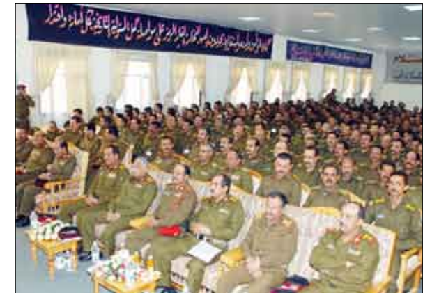
جانب من الضباط في حفل التخرج

وأمنه واستقراره. وكان نائب مدير دائرة التدريب العسكري قد أشار في كلمته الترحيبية إلى أن الدفاع عن الوطن والذود عن حياضه يستلزم إدراكا لأهمية العلم والمواكبة المعرفية الجادة لفهم حقائق الواقع ومتطلبات الواجب الدفاعي لمواجهة أي طارئ وتنفيذ أية مهام مسندة لمنتسبي مؤسسة الوطن الكبرى القوات المسلحة وأبطالها من جانب تكبيتهم من فهم عدوهم وتطوير الوسائل والأسلحة لتحقيق النصر. وفي كلمة التعهد جدد الخريجون مضامين الولاء والانتماء للوطن والمؤسسة العسكرية وتمسكهم بعهد الوفاء في التضحية والفداء في سبيل المبادئ والقيم الثورية والنهج الديمقراطي الذي يمثل خيار الشعب، مختلف أطيافه وفئاته والسير على درب الوفاء لضمان أمن الوطن واستقراره وحماية الثورة والوحدة ومكاسبها العظيمة. وكانت قد القيت في الحفل قصيدة شعرية نالت استحسان الحاضرين. واختتم الحفل بقراءة التناجح وتكريم أوائل الخريجين في الدورات الخمسة للضباط. حضر الحفل نائب رئيس هيئة الأركان العامة لشؤون التدريب والمنشآت التعليمية اللواء الركن علي سعيد عبيد وعدد من مدراء الدوائر والقادة العسكريين.