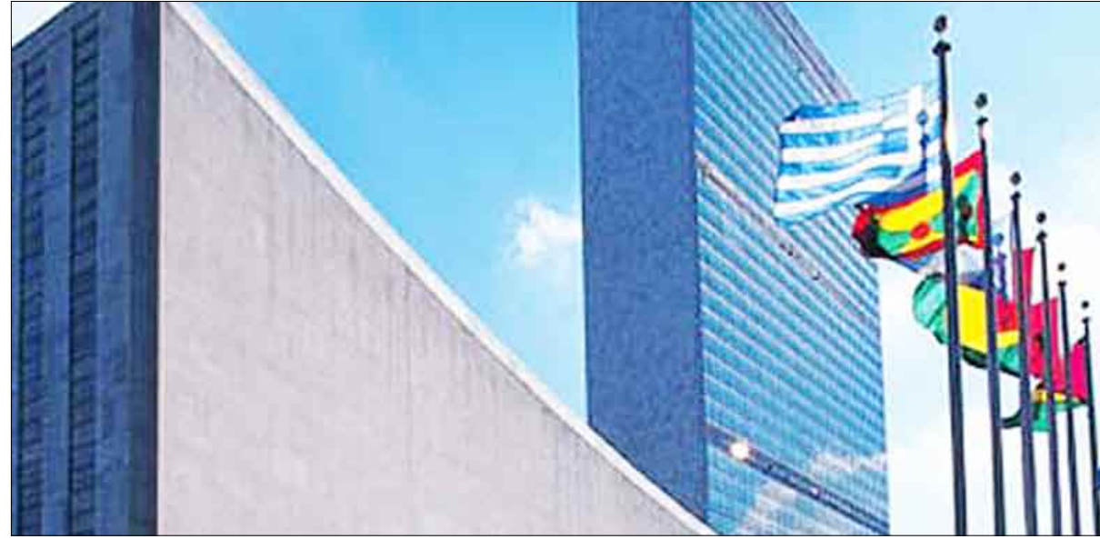
مقر الأمم المتحدة في نيويورك