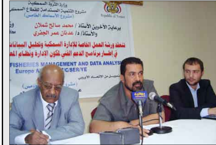
محافظ عدن في افتتاح ورشة الإدارة السمكية