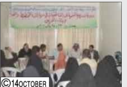
من فعاليات الدورة التدريبية الخاصة بتنمية قدرات الفتيات