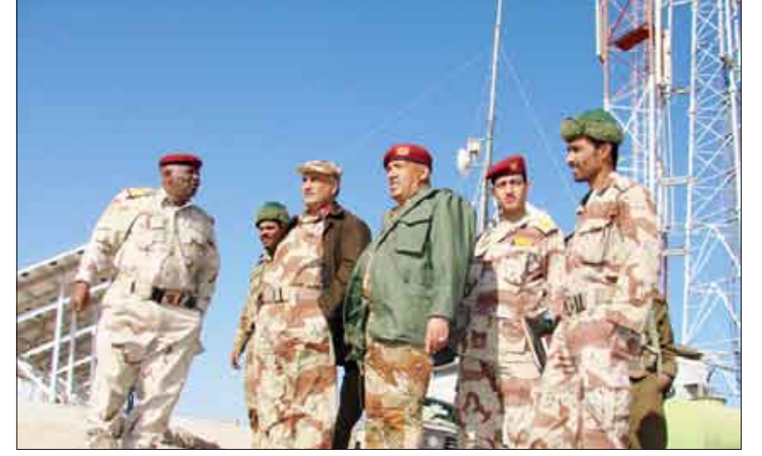
وزير الدفاع ونائب رئيس الأركان للعمليات لدى زيارتهما مواقع المقاتلين بمديرية حرف سفيان