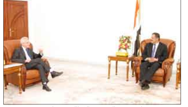
د. مجور يلتقي سفير الجمهورية الإيطالية بصنعاء

وصف رئيس مجلس الوزراء الدكتور علي محمد مجور العلاقات اليمنية الإيطالية بالتاريخية، مشيراً إلى التطور المستمر الذي تعيشه علاقات الصداقة بين الشعبين اليمني والإيطالي في مختلف الميادين السياسية والاقتصادية والثقافية.