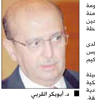
د. أبوبكر القري

السياسية والانمائية والانسانية. وتطرقت اللقاءات الى جهود الحكومة اليمنية الخاصة بتأمين ممرات أمنة وايصال المساعدات الانسانية للنازحين جراء أعمال الارهاب والتخريب بمحافظة صعده. حضر اللقاءات مندوب اليمن الدائم لدى الامم المتحدة عبدالله الصايدى ورئيس دائرة مكتب وزير الخارجية عبدالحكيم الارياني. الى ذلك التقى الدكتور القري هيئة تحرير صحيفة نيويورك تايمز الأمريكية وتطرق للقاء إلى التحديات الاقتصادية وتحديات الارهاب في اليمن والمنطقة.