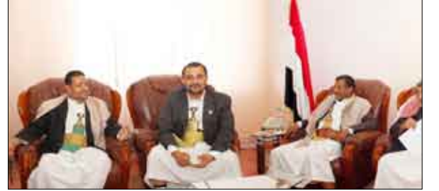
اللجنة البرلمانية المكلفة بتقصي الحقائق

عقدت اللجنة البرلمانية الخاصة بتقصي الحقائق حول بعض الأحداث وأوضاع النزاحين جراء الحرب التي أشعلتها العناصر الراهبية في صعدة وحرف سفبان أمس اجتماعاً لها برئاسة نائب رئيس مجلس النواب حمير بن عبدالله بن حسين الأحمر.