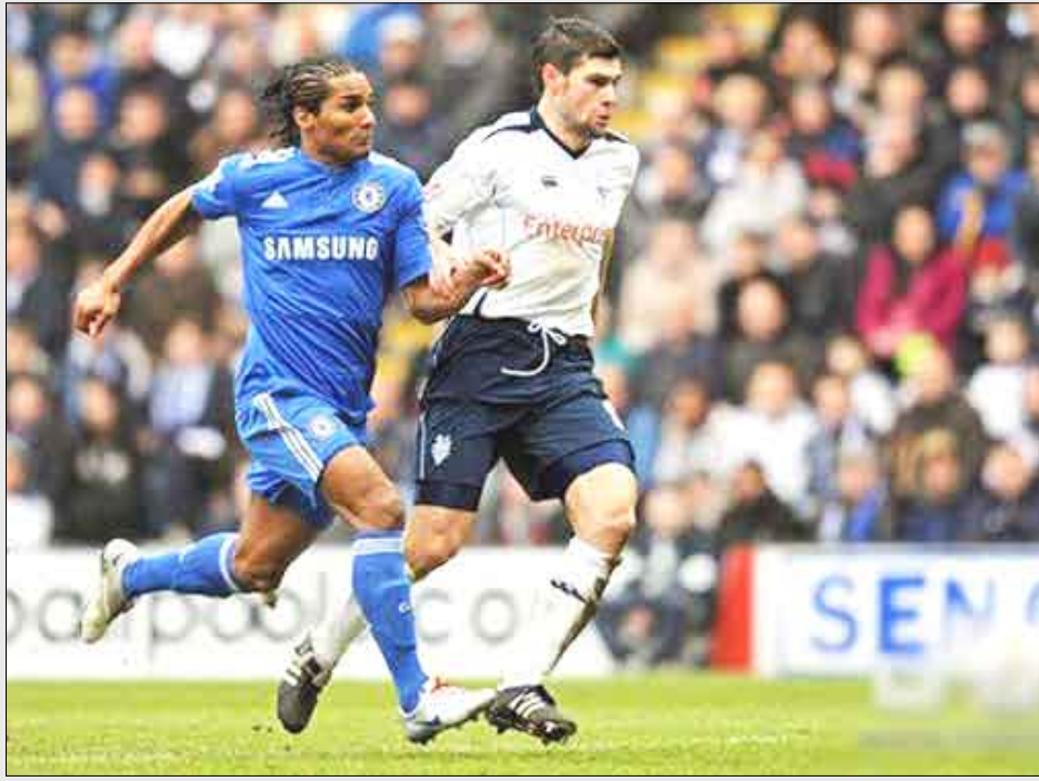
من مباراة برستون نورث اند