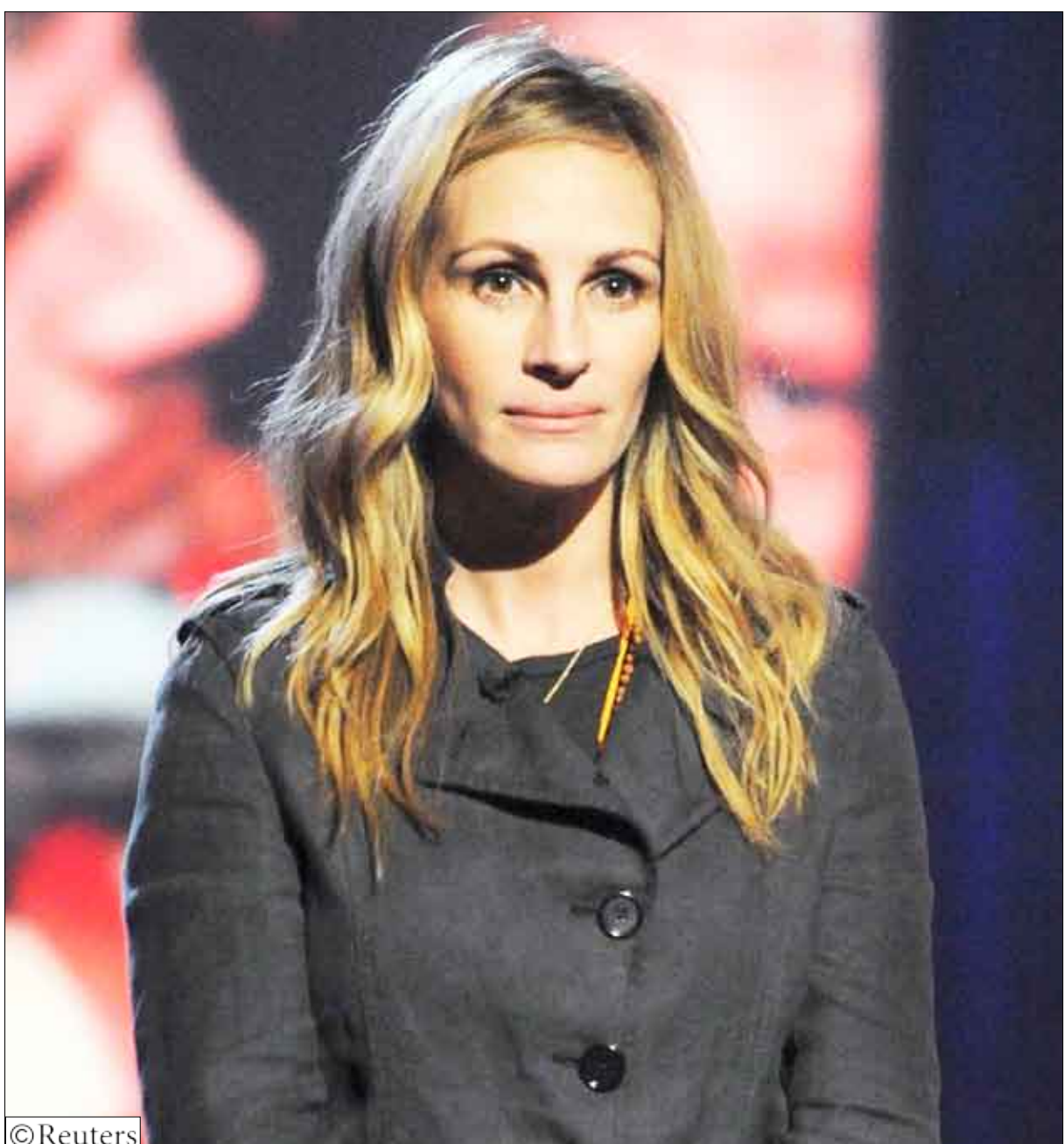
الممثلة الأمريكية الشهيرة جوليا روبرتس تشارك في حملة إغاثة بعنوان (الأمل لهايتي الآن) لإنقاذ هائيتي من آثار الزلزال في لوس أنجلوس يوم 22 يناير 2010م

منعاً/ سبأ: توجه أمس إلى جمهورية مصر العربية وزير الإعلام حسن اللوزي للمشاركة في الاجتماع الاستثنائي لمجلس وزراء الإعلام العرب الذي سيعقد في القاهرة غداً. وأكد وزير الإعلام أن الاجتماع يكتسب أهمية كبيرة لارتباطه بإنشاء مفوضية الإعلام العربي التي سبق لمجلس وزراء الإعلام العرب الموافقة عليها وأوكل للأمين العام لجامعة الدول العربية عمرو موسى مهمة إعداد النظام الخاص بها وتم إنجازه. وقال اللوزي « سيناقش الاجتماع سبل الوصول إلى النظام الأمثل خاصة وأن هذه المفوضية سوف تختص في جانب من عملها بالإشراف والمتابعة للإعلام العربي الفضائي الإذاعي والتلفزيوني والإعلام الإلكتروني والعمل على التكامل الإعلامي بين الهيئات والمؤسسات والشركات الإعلامية لدى الدول الأعضاء في المواقف القومية والقضايا الداعمة للأمة العربية والإسلامية والتعبير عن قناعاتها في السعي نحو التوسع المستمر في نشر الرسالة الإعلامية المرئية والمسموعة والإلكترونية عبر الوسائل الإعلامية العالمية». وأضاف اللوزي « المفروض أيضاً أن تعمل