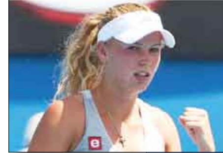
■ كارولين فوزنياكي

جيداً وعندها سيبداً الناس بالتحدث عني". وتلتقي الدنماركية في الدور الثالث الإسرائيكية شاهر بير التاسعة والعشرين التي تغلبت على البلغارية تسفيتانا برونكوفا 6 - 1 و 6 - 4. وفازت سيرينا وليامس المصنفة الأولى على التشيكية بترافيتوفا 6 - 2 و 6 - 1. وتلتقي وليامس في مباراتها المقبلة الإسبانية كارلا سواريز الثانية والثلاثين التي تغلبت على الألمانية أندريا بتيكوفيتش 6 - 1 و 6 - 4. ومصفت شقيقته فينوس المصنفة السادسة إلى الدور الثالث أيضاً بفوزها على النمساوية سبيليل بامر 6 - 2 و 5 - 7 في 97 دقيقة. وفي الدور الثاني أيضاً، فازت الروسية فيرا زفوناريغا التاسعة على التشيكية ايفيتا بينيسوفا 6 - 0 و 6 - 1، والبولندية انيسكارادفانسكا العاشرة على الروسية الأ كودريافتسيفا 6 - 0 و 6 - 2، والبيلاروسية فيكتوريا زارنكا السابعة على السويسرية ستيفاني فوغل 6 - 4 و 6 - 0، والصينية لي نا السادسة عشرة على المجرية انيس شافاي 3 - 7 و 6 - 5 و 6 - 2، والاسترالية سامانتا ستوسور الثالثة عشرة على الألمانية كريستينا بارويش 7 - 5 و 6 - 3، والسلفوفاكية دانييلا هانتوتشوفكا الثانية والعشرون على السويدية صوفيا ارفيدسون 6 - 4 و 6 - 1. وخرجت الصربية انا ايفانوفيتش العشرين أمام الأرجنتينية جيزيلا دولكو 7 - 6 و 6 - 4 و 6 - 8.