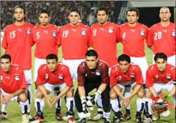
■ منتخب مصر

مشكلة حول إقامة هذه المباراة". وتعود المواجهة الأخيرة بين الطرفين إلى أربعة أعوام وكانت ودية أيضاً وخرج منها المنتخب الإسباني فائزاً 2 - صفر. ووقع بطل أوروبا في نهائيات جنوب أفريقيا 2010 ضمن المجموعة الثامنة إلى جانب كل من سويسرا وهندوراس وتشيلي. وذكر زاهر أنه لم يحدد المكان الذي ستقام فيه المباراة وستتفق الطرفان على هذه المسألة لاحقاً. وأشار زاهر إلى أن مدرب المنتخب المصري حسن شحاتة وافق على لقاء إسبانيا، قائلا "جلست مع حسن شحاتة وليس لدي أي