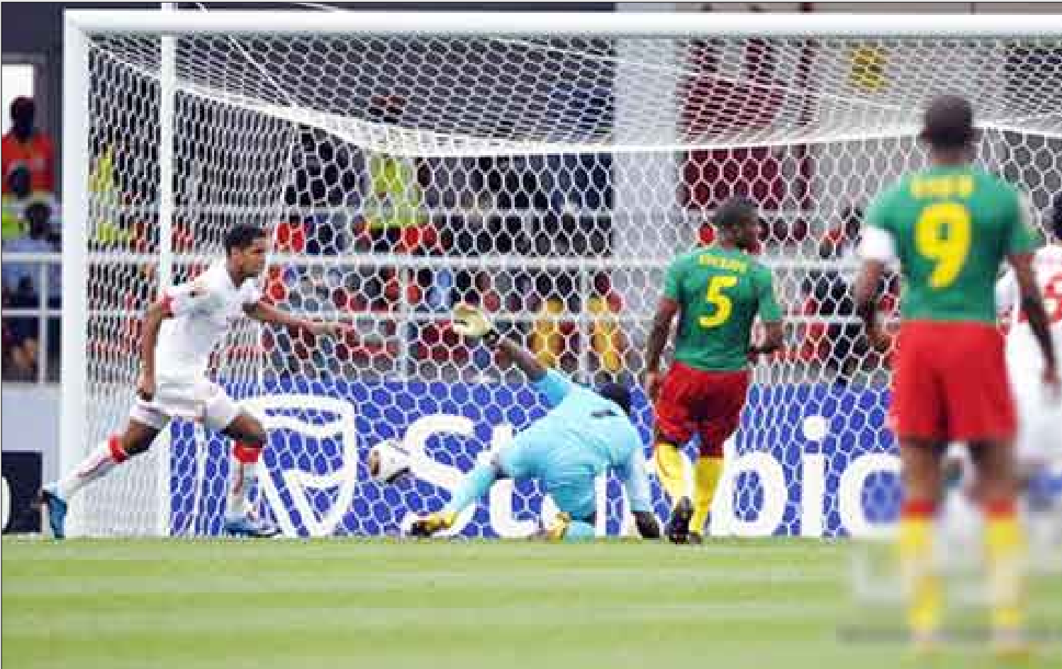
■ يتولى تسجيل هدف في المرمى التونسي

المنتخب الكامبيروني منافسه المصري العنيد الذي تغلب عليه 1/صفر في نهائي البطولة الماضية لتكون المباراة بينهما يوم الاثنين المقبل في مدينة بينجيبلا مواجهة ثرية لأسود الكامبيرون.