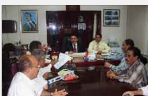
هيئة مديرية التواهي تطلق اسم "عامر" على سوق المدينة المركزي

قررت الهيئة الإدارية لمديرية التواهي الحفاظ على التسمية القديمة لسوق مدينة التواهي، وهي "سوق عامر المركزي" وذلك للمعاني والقيمة التاريخية التي ينطوي عليها هذا الاسم القديم.