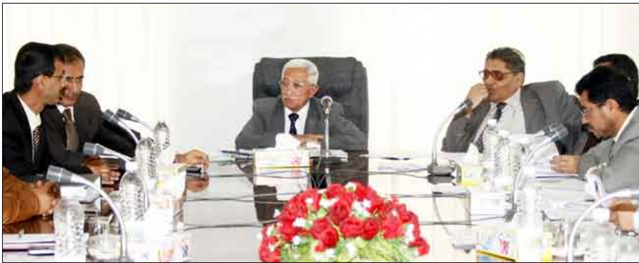
لجنة المناقصات توافق على وثائق التأهيل المسبق للشركات المنفذة لمحطات توليد الطاقة

مشروع العين - فوفلة - سامع بمحافظة تعز بطول 20 كيلو مترا، بكلفة مليار و138 مليون ريال، ومشروع طريق الخط الدائري الرابع المرحلة الأولى بطول 6ر8 كيلو متر بمحافظة تعز بكلفة مليار و404 ملايين ريال، بالإضافة إلى الأعمال الإضافية لمشروع الصالح السكني 500 وحدة سكنية بمحافظة الحديدة بكلفة 83 مليون ريال.