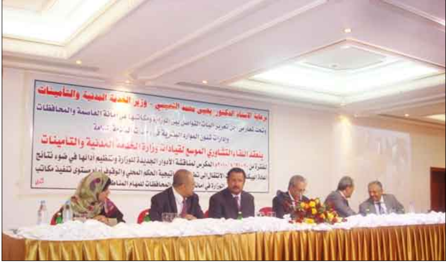
خلال فعاليات اللقاء التشاوري الموسع لقيادة وزارة الخدمة المدنية بتعز أمس