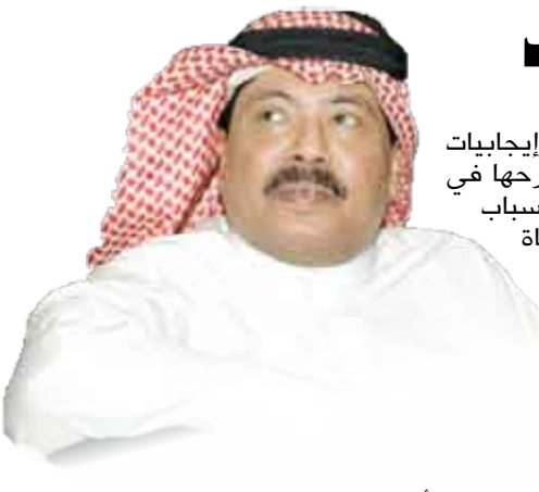
الفنان /أبو بكر سالم بلفقيه