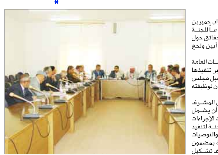
نائب رئيس مجلس النواب يترأس اجتماعاً للجنة الأمنية الخاصة بتقص الحقائق

رأس نائب رئيس مجلس النواب جبير بن عبدالله الأحمر أمس اجتماعاً للجنة البرلمانية الخاصة بتقصي الحقائق حول الأحداث الأمنية بمحافظة أبين ولحج وتدارستها. واستعرضت اللجنة الاتجاهات العامة لمشروع تقريرها حول سير تنفيذها للمهام التي أوكلت إليها من قبل مجلس النواب في إطار ممارسة البرلمان لوظيفته الرقابية. وأكد نائب رئيس المجلس المنشرف على أعمال اللجنة، أهمية أن يشمل مشروع تقرير اللجنة حيثيات الإجراءات والخطوات التي اتخذتها اللجنة لتنفيذ مهمتها وطرح الاستنتاجات والتوصيات الموضوعية اللازمة المرتبطة بمضمون هذا التقرير وبما يحقق أهداف تشكيل اللجنة ومهامها وبما يصب في خدمة المصلحة الوطنية العليا.