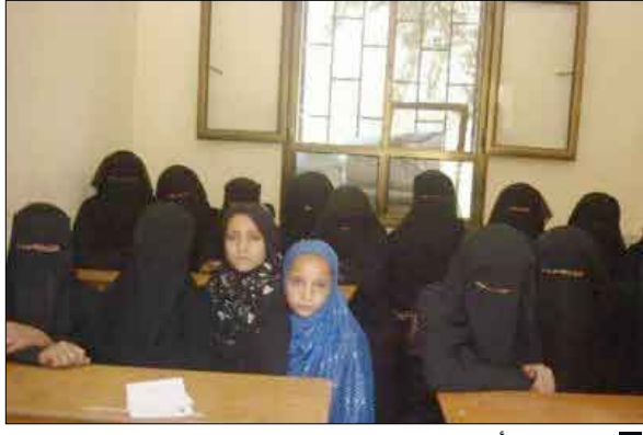
أميات في أحد الفصول الدراسية

جهاز محو الأمية وتعليم الكبار فيما يخص المتطلبات الضرورية من المخصصات المالية. واختتمت تصريحا قائلاً: محو الأمية وتعليم الكبار مسئولية المجتمع فهي تتطلب كل الجهود والإمكانات فالأمية آفة خطيرة يجب القضاء عليها والتخلص منها.