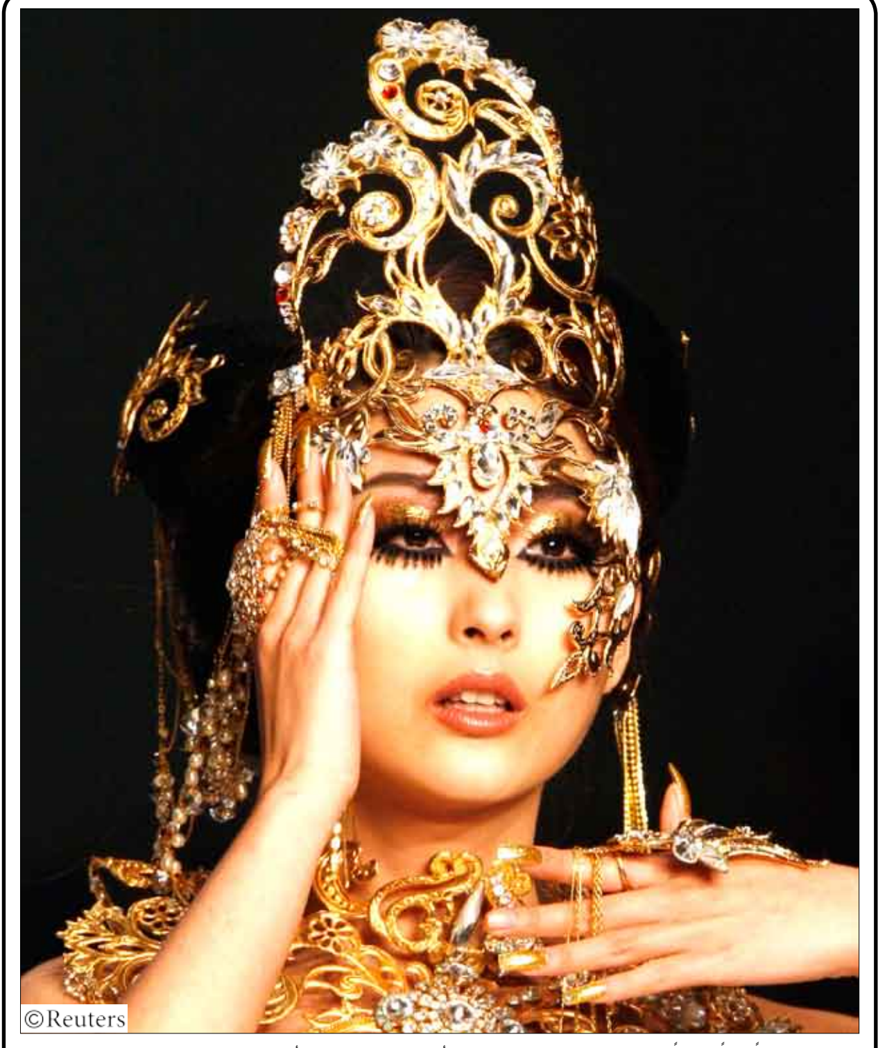
فتاة تعرض زياً صينياً فلكلورياً من تصميم "جو بياي" في حفل الأزياء الذي أقيم في مدينة هونغ كونغ أمس.

ليس القصد الإساءة لعلماء اليمن أو التشهير بهم، لكن السؤال هو ما الفرق بين ما يقولونه اليوم، وما قالته طالبان الملا عمر، عندما دافعت عن أسامة بن لادن، وعرضت أفغانستان وأهلها لمزيد من الدمار والحروب؛ أوليس الأجدى هو