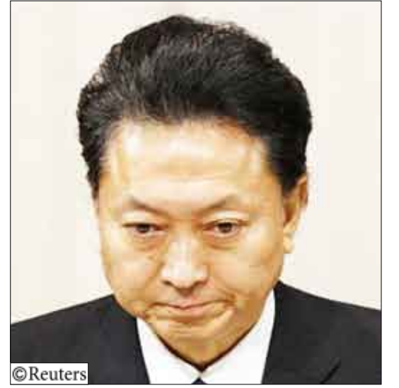
رئيس الوزراء الياباني يوكيو هاتوياما في طوكيو يوم السبت الماضي.