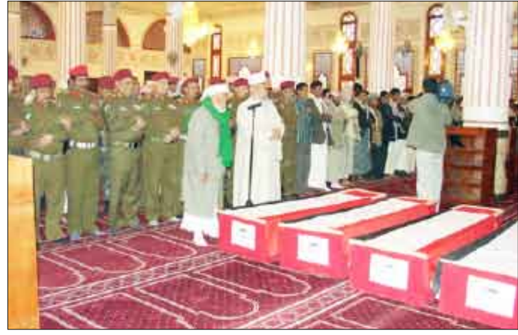
أثناء الصلاة على الشهداء