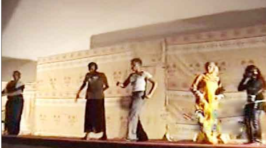
لقطة من المسرحية

الفرقة حققت نجاحاً في مسرحية (عيال مجانيين) كأول عمل مسرحي لها