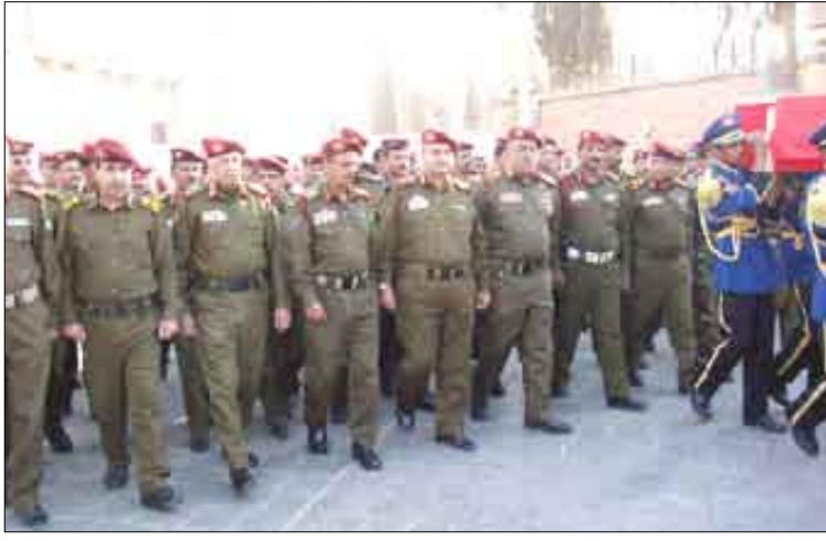
كبار قادة وزارة الدفاع يشيعون الشهداء

شارك في التشييع عدد من القيادات العسكرية والأمنية ووحدات رمية من ضباط وأفراد القوات المسلحة والأمن وعدد من أعضاء مجلسي النواب والشورى وأهالي وأقارب الشهداء وعدد من الشخصيات الاجتماعية ومناضلي الثورة اليمنية وجمع غير من المواطنين.