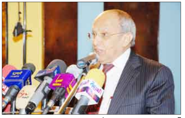
الإيراني يلقى كلمة في الندوة أمس

العربية استراتيجياً واقتصادياً وإنسانياً. جاء ذلك في افتتاح مؤتمر العلاقات اليمنية الخليجية أمس تحت عنوان «العلاقات اليمنية الخليجية.. الحاضر.. آفاق المستقبل» الذي وينظمه المركز اليمني للدراسات الإستراتيجية ويستمر لمدة يومين. وأضاف الإيراني إن علاقات اليمن ودول مجلس التعاون لدول الخليج العربية تستند إلى عمق تاريخي وزخم إنساني ومصالح مشروعة وفي ضوء ذلك يتوجب على الجميع السير في طريق التعاون والأخلاق والتكامل لمواجهة التحديات والأخطار على أرضية موحدة وبعقول نيرة وتصميم قوي لخدمة شعوب هذه البلدان وضمان مستقبل أمن لها.