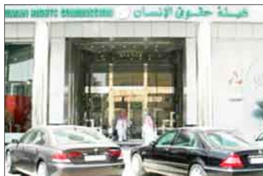
مقر هيئة حقوق الإنسان بالسعودية