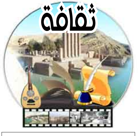
إشراف /فاطمة رشاد

طاقم مسرحية (عيال مجانيين) يتحدثون لـ (الأكبر) :