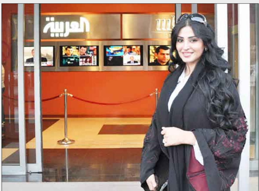
الفنانة السعودية ريم