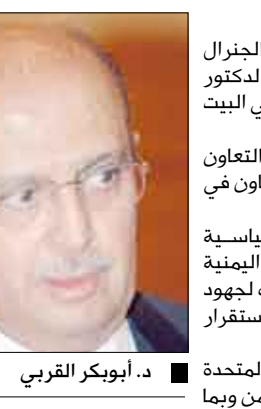
د. أبو بكر القريبي

استقبل مستشار الأمن القومي الأمريكي جيمس جونز أمس الثلاثاء وزير الخارجية الدكتور أبو بكر عبد الله القريبي والوفد المرافق له في البيت الأبيض بالعاصمة الأمريكية واشنطن. وبحث الجانبان العلاقات الثنائية ومجالات التعاون المشترك بين البلدين الصديقين، ومنها التعاون في المجال الأمني ومكافحة الإرهاب والقرصنة. وعبر الجنرال جونز عن تقدير القيادة السياسية الأمريكية للعمليات التي نفذتها قوات الأمن اليمنية ضد عناصر الإرهاب، مؤكداً دعم حكومة بلاده لجهود اليمن في مكافحة الإرهاب بغية دعم الأمن والاستقرار في المنطقة عموماً واليمن خصوصاً. وأشار المسؤول الأمريكي إلى أن الولايات المتحدة الأمريكية حريصة على تعزيز علاقاتها مع اليمن وبما يخدم المصالح المشتركة للبلدين والشعبين الصديقين. وزير الخارجية الدكتور القريبي أوضح أن اليمن عانت