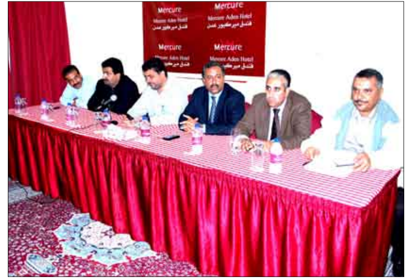
من اجتماع مجلس التنسيق لأندية لحج وأبين وعدن