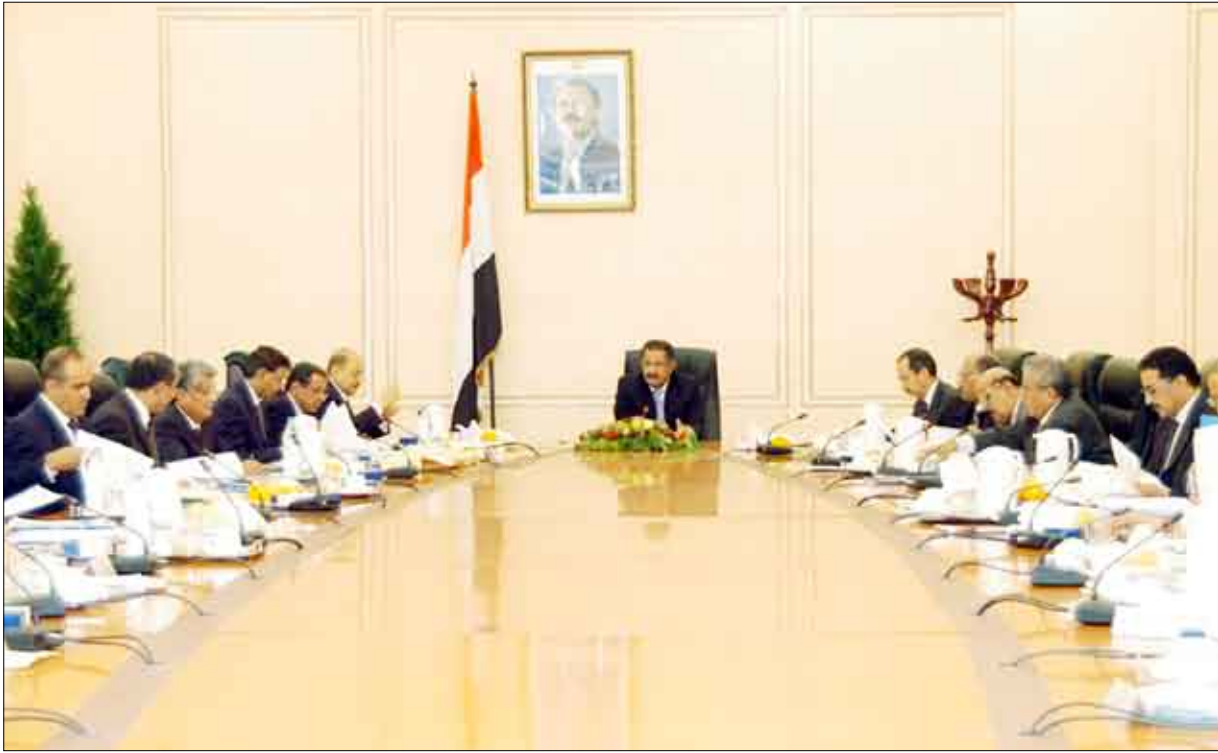
مجلس الوزراء في اجتماعه الأسبوعي أمس برئاسة رئيس المجلس الدكتور علي محمد مجور

ويهدف القانون الى تنمية وتطوير وتنظيم وحماية النشاط الصناعي وتنويع تقنياته وقاعدته الإنتاجية ورفع قدراته التنافسية وإمكانياته والاعتماد على الخدمات المحلية.