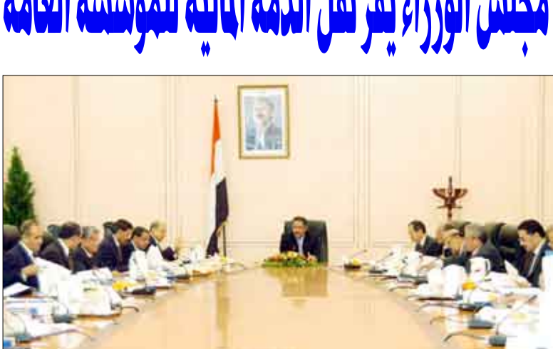
مجلس الوزراء في اجتماعه أمس

وافق على مشروع قانون حظر إنتاج وتخزين واستعمال الأسلحة الكيميائية أقر مجلس الوزراء في اجتماعه الأسبوعي أمس برئاسة رئيس المجلس الدكتور علي محمد مجور مشروع قانون بشأن تنظيم الصناعة بعدة مرارته في اللجنة الوزارية برئاسة نائب رئيس الوزراء للشؤون الاقتصادية وزير التخطيط والتعاون الدولي. ووافق المجلس كذلك على مشروع قانون حظر استحداث وإنتاج وتخزين واستعمال الأسلحة الكيميائية المقدم من وزارة الخارجية لتجنيب اليمن أي مخاطر جراء استعمال المواد الكيميائية في الأغراض غير المحظورة وأقر مجلس الوزراء نقل الذمة المالية للمؤسسة العامة للأثاث إلى المؤسسة الاقتصادية اليمنية وتحول إلى وحدة إنتاجية مستقلة ماليا وإداريا تعمل في إطار المؤسسة الاقتصادية وأكد المجلس بأن على المؤسسة الاقتصادية ضرورة استيعاب العمالة لدى المؤسسة العامة للأثاث وإعادة تأهيل وتدريب ما يمكن تأهيله منهم بما يتناسب مع طبيعة نشاط المؤسسة على أن لا يترتب على انتقالهم إليها أي مساس بحقوقهم القانونية المكتسبة.