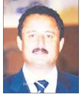
حمود خالد الصوفي

كشف محافظ تعز حمود خالد الصوفي عن تحضيرات تجري حالياً لعقد لقاء تشاوري موسع يضم قيادات السلطات المحلية والمؤسسين والمختصين في الجهات المعنية بمحافظات تعز والحديدة ولحج، للخروج بخطة عمل مشتركة لتعزيز التنسيق والتكامل لمكافحة التهريب والمتهربين عبر مناطق الشريط الساحلي للمحافظات الثلاث. ولقت المحافظ الصوفي في تصريحه إلى أن تنظيم هذا اللقاء بالتنسيق مع نائب رئيس الوزراء لشؤون الدفاع والأمن وزير الإدارة المحلية يأتي في إطار الجهود الحكومية المبذولة للحد من عمليات التهريب وتعقب وضبط المهربين .. معتبراً التهريب آفة خطيرة تتعدى مخاطر الحالة الاقتصادية والاجتماعية إلى الحالة الأمنية الأمر الذي يجعله يشكل أحد أهم التحديات التي تواجه منظومة العمل الحكومي بشكل عام وبالذات في محافظة تعز. وقال: «على الرغم من النجاحات النسبية التي حققتها أجهزة الأمن والوحدات العسكرية بمحافظة تعز في محاصرة التهريب والمهربين أو المتسللين عبر الشريط الساحلي البحري لليمن بالذات تهريب المبيدات والمخدرات، إلا أن الشريط الساحلي لمحافظة لا يزال يمثل المخرصة الأضعف ويسعى المهربون دوماً لإستغلال أية ثغرات للنفوذ منها» .. مبيناً أن بقاء أية ثغرات للمهربين يشكل قلقاً دائماً ومستمرًا للسلطة المحلية والأجهزة الأمنية تتواصل الجهود باستمرار لسد تلك الثغرات. وأردف قائلاً: «كل ما يهمننا في هذه الظروف الاستثنائية التي تعيشها اليمن هو حشد كل الطاقات والجهود قضائياً وأمنياً وعسكرياً للحد من أية عمليات تهريب ومنع أية محاولة لتهريب السلاح نظراً لما يشكله ذلك من خطورة على أمن واستقرار الوطن».