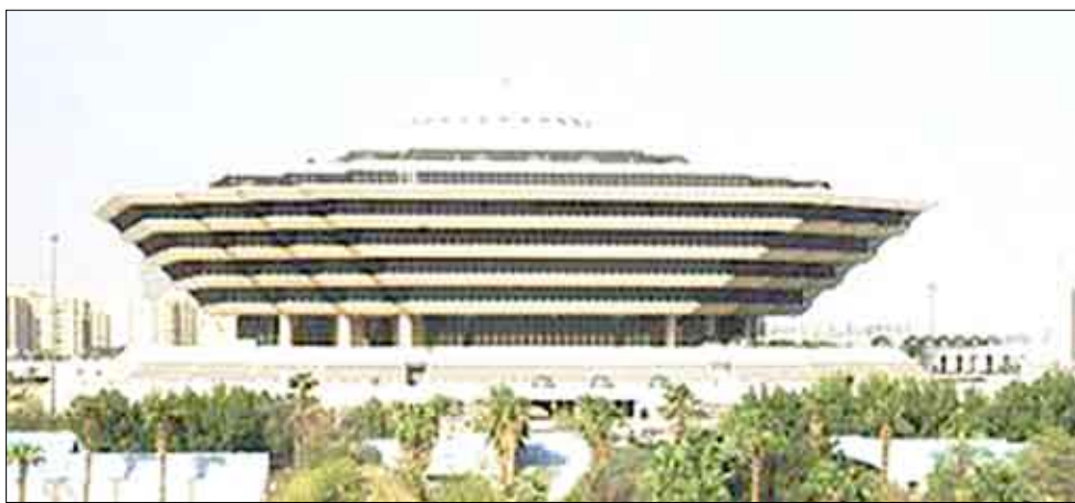
وزارة الداخلية السعودية