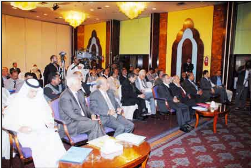
جانب من الحضور في المؤتمر