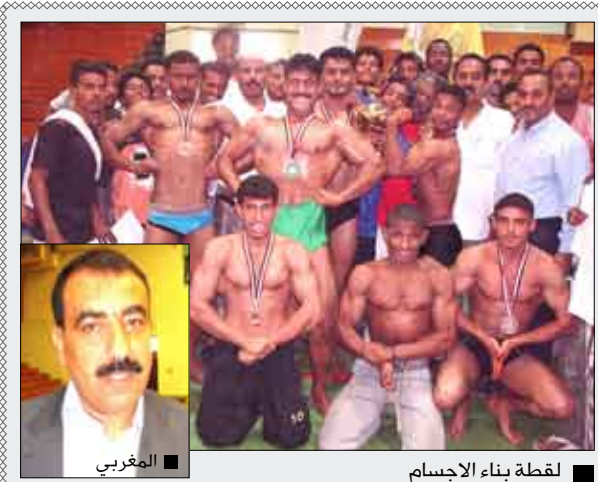
لقطة بناء الأجسام

استكملت اللجنة المنظمة لحفل تكريم نجوم اليمن في لعبة كرة القدم للعام 2009 استعداداتها الخاصة بإقامة الحفل التكريمي للفائزين في الاستفتاء الجماهيري الذي يقيمه ميديا ليدرز للإعلام والإعلان سنوياً برعاية رئيسية من كاك بنك