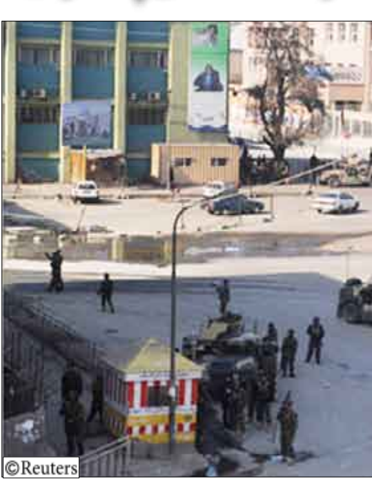
قوات الأمن الأفغانية بإحدى الساحات الرئيسية بكابل