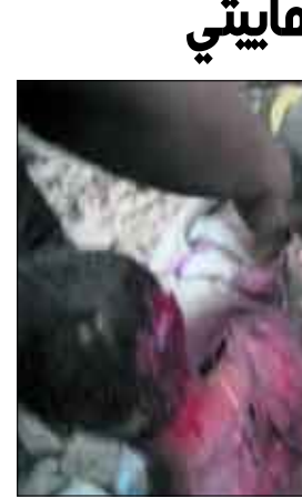
من ضحايا زلزال هايتي

لإغاثة من الكارثة. وصرحت المديرية التنفيذية للصندوق ثريا أحمد عبيد في مؤتمر صحفي «إن صندوق الأمم المتحدة للسكان يعرب عن تضامنه، وتعاطفه، ومواساته لشعب هايتي الذي يعاني النتائج الممطرة للزلزال». يعمل الصندوق بالتنسيق مع استجابة الأمم المتحدة لتقديم مساعدات إنسانية عاجلة للمتضررين من الزلزال.