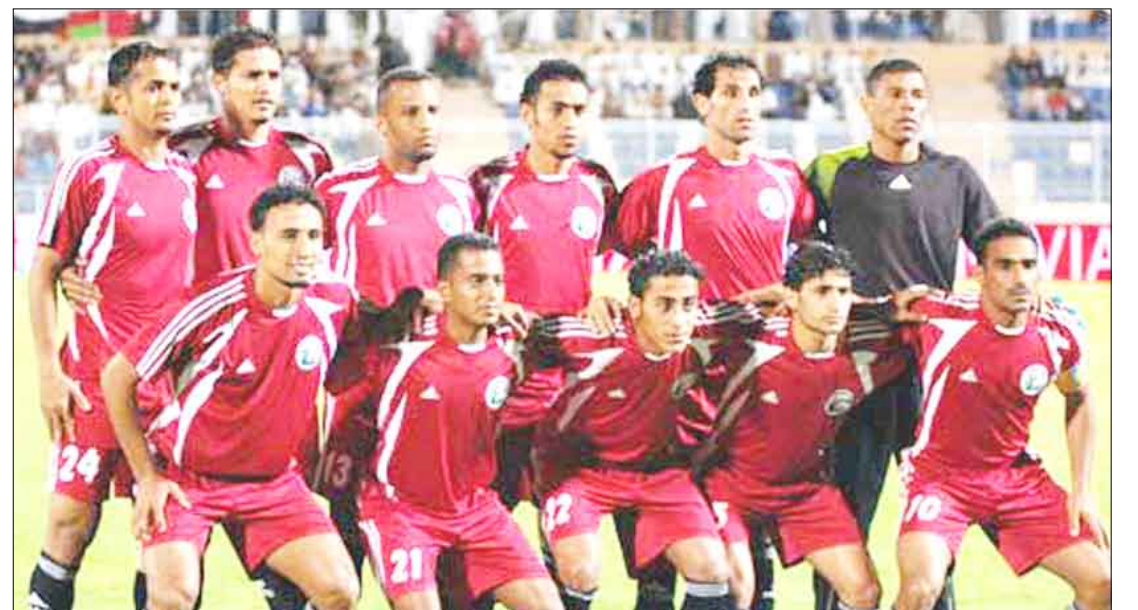
المنتخب الأول لكرة القدم

وشهد العام الماضي تغييراً جذرياً بإقامته على مرحلتين خصصت الأولى لترشيحات الإعلاميين الرياضيين والفنيين والإداريين والحكام وصعد منها 26 نجماً كروياً تمكنوا من الفوز بحصد أكثر الأصوات ودشنت المرحلة الثانية للترشيحات عبر رسائل SMS للجمهور الرياضي ونجح فيها 13 نجماً لحازوا على أغلبية الأصوات وفازوا بلقب النجومية في عام 2009م. وقال وكيل وزارة الشباب والرياضة رئيس اللجنة المنظمة حسين بن ناصر الشريف أن اللجنة أعدت احتفالاً حفل متميز مناسب لأهمية الحدث كونه يشكل إنفراده غير مسبوقه في الجانب الجماهيري والرياضي من حيث ظهور أول استفتاء جماهيري يقوى رابطة الأولى وبين الجماهير المحبة والعاشقة وبمخيم إمكانية اختيار نجومهم المفضلين، وكذلك لما يشكله من حافز مهم ودافع كبير في أوساط اللاعبين والمدربين والحكام للتنافس على تطوير مستوياتهم وتقديم الأفضل ليدخلوا المنافسة على إحراز لقب النجومية والأفضلية وهو الأمر الذي سيكون له أثر إيجابي في تطوير رياضة كرة القدم. وأشار إلى أن تواصل الاستفتاء الجماهيري لثلاثة مواسم يؤكد نجاحه وثباته وتوسعه بحيث أصبح من أهم الأحداث التي ينتظرها اللاعبون والجمهور الرياضي والمتابعون بمختلف هوياتهم