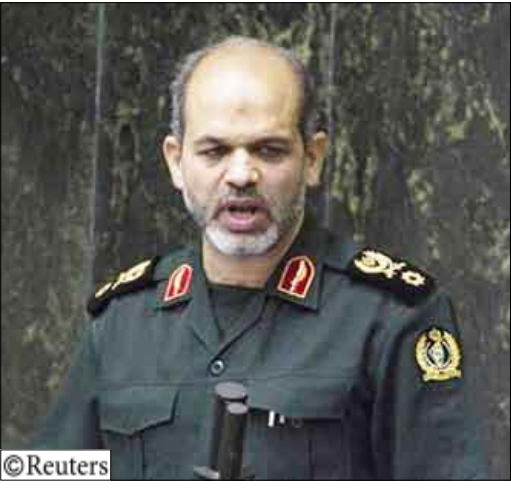
وزير الدفاع الإيراني أحمد وحيدى في البرلمان الإيراني يوم 1 سبتمبر 2009