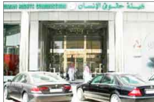
مقر هيئة حقوق الإنسان بالسعودية

كافة من تسجيل العقد وتوثيقه واحضار شهادة الفحص الطبي لها قبل الزواج، وجرت مراسم توقيع العقد من دون معارضة من والد الطفلة، فيما تعمل الأم على فسح العقد من خلال أروقة القضاء. ولم تكن طفلة بريدة هي الحالة الأولى التي تشهدها منطقة القصيم، فسبق أن شهدت محافظة عنيزة حالة مشابهة لها إذ زوجها والدها لرجل خمسيني قبل أكثر من عامين من دون علمها أو أحد من أقاربها بما فيهم، والدتها، لتكتشف الأم لاحقا زواج ابنتها، وهو ما جعلها تطالب بإبطال عقد النكاح، في حين برر الأب تزويج ابنته في هذه السن بالمحافظة عليها وحماية مستقبلها، أما الزوج فأبدى تمسكه بالطفلة ورغبته في إبقائها زوجة له على رغم صغر سنها، قبل أن يتدخل أمير منطقة القصيم الأمير فيصل بن بندر فاستقبل الزوج في مقر الإمارة، ونجح في التوسط لإنهاء هذا الزواج.