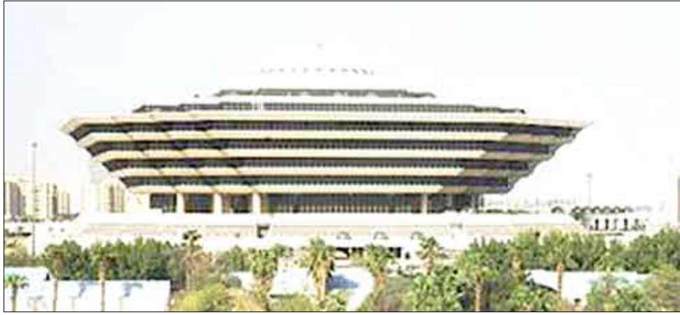
وزارة الداخلية السعودية