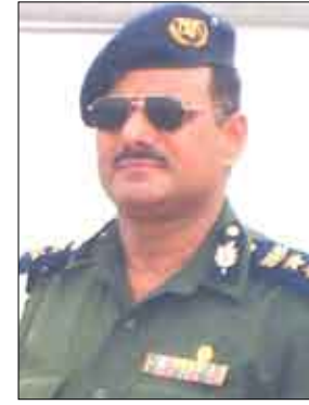
العقيد خالد الزبيدي

وأضاف أنه سيتم خلال المؤتمر تقييم العمل الأمني في مختلف الوحدات والإدارات وأقسام الشرطة في المحافظة خلال عام بقيادة العميد الركن عبدالله قيران.