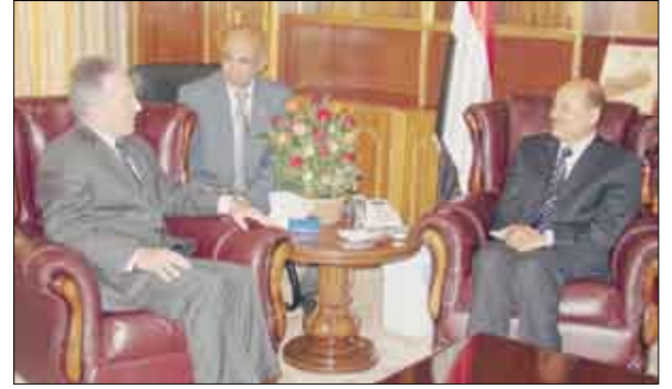
العلمي يلتقي السفير الأمريكي