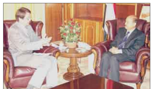
...ويلتقي السفير البريطاني