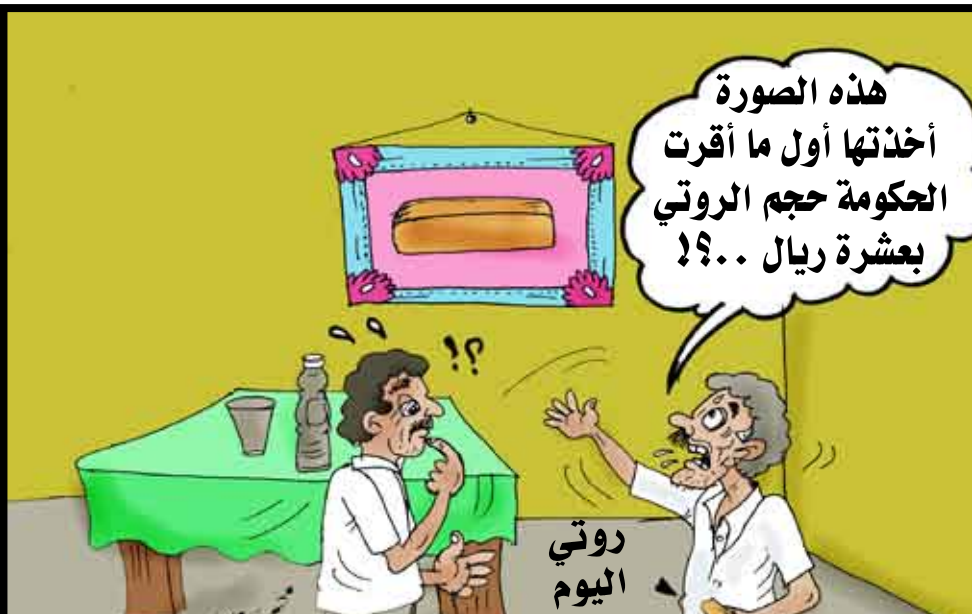
✪ باختصار صنعاء المسعودي نخشي أن يأتي يوم ويختفي فيه حجم قرص الروتي، ويصبح التعرف عليه بحاجة إلى منظار أو مكبر، أو ميكروسكوب. هل من المعقول أن طفلاً لم يتجاوز (6) سنوات لا تكفيه (3) أقراص روتي !!! باجماعة الخير قيمة القرص (10) ريالاً، وحجمه ووزنه محدد من قبل الجهات الرسمية، لكن أصحاب الأفران لم يلتزموا بالإسعره أما وزنه فهم خبراء بالميزان، والجهات الرسمية أذن من طين والأخرى من عجيين.. وهكذا أصبحت حياة محدودي الدخل معجونة بين عجيب أصحاب الأفران وصمت الجهات الرسمية.. متى سنتخلص من الفساد !!