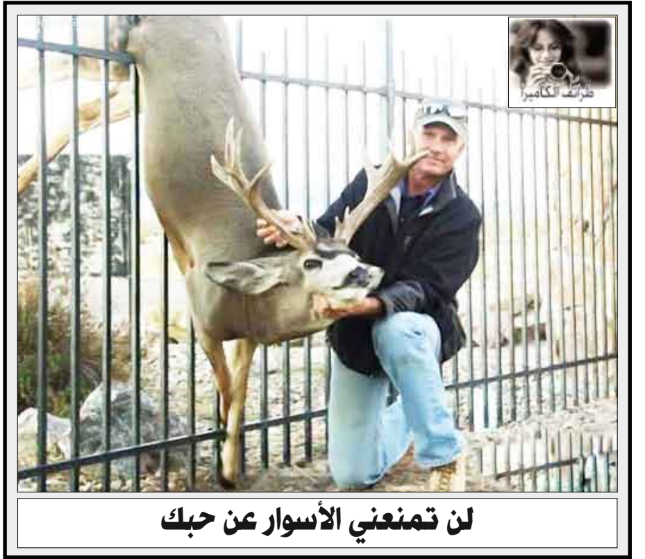
لن تمنعني الأسوار عن حبك

للسرقة خلال الرحلة وضاع أربعة آلاف يورو منهم، ولكن لم يكن من الممكن بالطبع التعرف على اللصوص وسط الركاب، وأكدت شركة الطيران الفرنسية «إير فرانس» الحوادث نادرة الطائرات، ولكنها أشارت في الوقت نفسه إلى أن الحفاظ على الأمتعة الشخصية مسؤولية كل راكب.