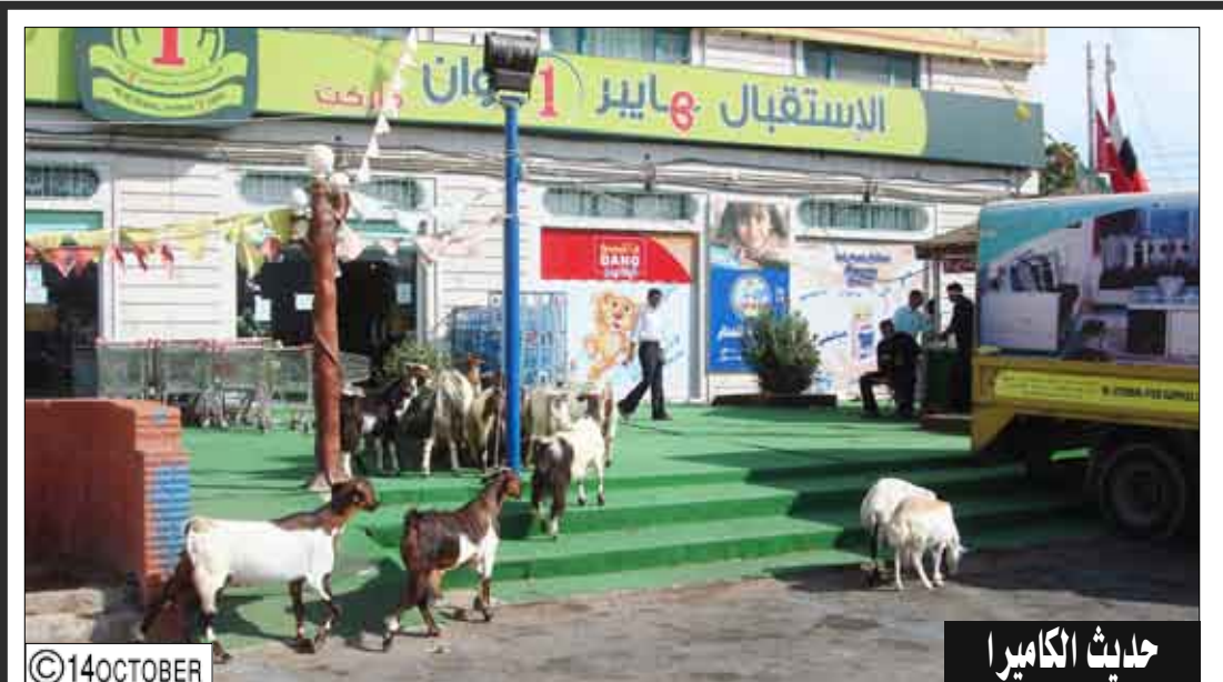
✪ حديث الكابيرا تصوير وتعليق / علي الدرب: إذا كان انتشار قطع الأغنام بهذا الشكل في طرقات مدينة خورمكسر وخصوصاً الشارع الرئيسي المؤدي من وإلى المطار فما هو حال بقية الشوارع الداخلية في هذه المدينة المهمة التي ترتعي فيها الأغنام بحرية ومثل هذا المناظر منتشرة وملحوظة في شوارع عدن محافظة عدن رغم ماتسببه من تشوه واضرار بالمنظر العام فأين الجهات المختصة من ذلك !!

إعداد / أشواق ناجي أفقياً: 1- اله الزهور عند الرومان إليها ينسب أعياد (الفلوراليا) في الربيع - بلد عربي. 2- صوت الجرس - كف - برهان. 3- برشد - من أبطال اليونان الأسطوريين في حرب طروادة ملك إيتاق وزوج بينيلوب وأبو تيليماك - وقت. 4- كفء (معكوسة) - مطلوب - حرف إنجليزي. 5- مادة قاتلة - للتمني (معكوسة) - عقل. 6- حمام بري - عاصمة الاكوادور. 7- كثير بالوجه الخليجية - مطلوب. 8- حرف موسيقي - جزيرة في غرب فرنسا في الأطلسي - قط. 9- عدد إنجليزي - اتجاه جانبي - يابسة. 10- عاتب - شهر ميلادي - من الألوان. 11- خائن - حرف إنجليزي - صمام (مبعثرة). 12- مؤنث أرتب - أحد أولاد سام ابن نوح عليه السلام. عمودياً: 1- نادرة - أطول أنهار أوروبا وأغزرها. 2- عاصمة أوروبية - حرف إنجليزي - فريد. 3- واد في جهنم - يستخدم لتخصيب التربة الزراعية - رجل بالإنجليزية.