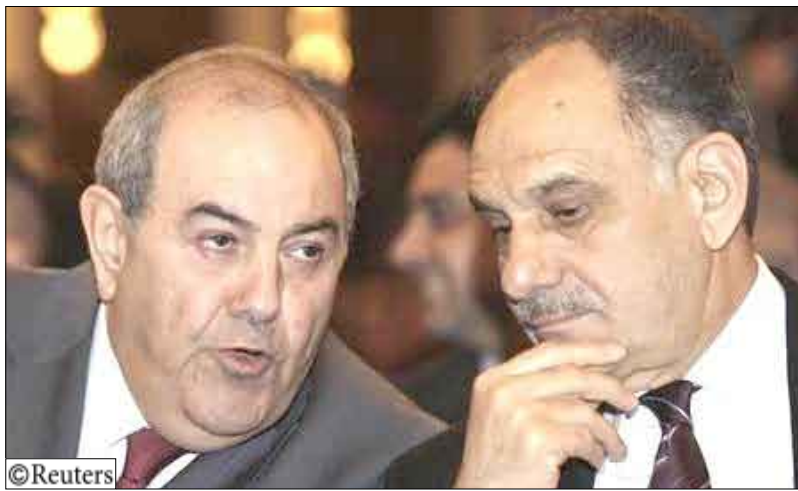
رئيس الوزراء العراقي السابق اياد علاوي (يسارا) في حديث مع النائب السني صالح المملاك خلال الاعلان الرسمي عن القائمة العراقية الانتخابية في بغداد يوم أمس.