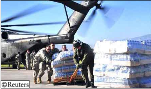
أفراد من الجيش الأمريكي يساعدون طاقم طائرة هليكوبتر تابعة ل سلاح البحرية في تفريغ إمدادات غذائية بمطار بورت أو برنس في هايتي يوم أول أمس الجمعة.

الغذاء والماء والإمدادات الطبية عبر المطار المزدهم والميناء المحطم في البلاد والطرق التي أغلقت الانقاض بعضها. واقتتل مواطنون جوعي في بورت أو برنس على أكياس غذاء وزعتها شاحنات تابعة للامم المتحدة في وسط مدينة بورت أو برنس. وحذر مسؤول كبير في الامم المتحدة من ان الجوع قد يؤجج توترا اذا لم تصل المساعدات بسرعة لكنه