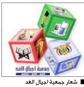
شعار جمعية أجيال الغد