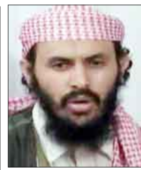
قاسم الريمي القائد العسكري للتنظيم

صنعاء / سبأ: قال مصدر أمني مسؤول إنه في إطار الملاحقة الأمنية المستمرة للعناصر الإرهابية من تنظيم القاعدة تم في تمام الساعة الثانية والنصف من ظهر أمس توجيه ضربة جوية ناجحة من قبل قواتنا الجوية لعدد من عناصر تنظيم القاعدة كانوا يستقلون سيارتين في منطقة الاجشرا ما بين طيبة الاسم والبقع الواقعة بين محافظتي صعدة والجوف. وأضاف المصدر أنه كان ضمن تلك المجموعة الإرهابية، الإرهابيون قاسم الريمي القائد العسكري للتنظيم، وعمار عبادة الوائلي وصالح التيس وعياض جابر الشبواني وهم من العناصر القيادية في التنظيم، بالإضافة إلى عبدالله هادي التيس، وأبو أيمن المصري (مصري الجنسية) ويعرف باسم صالح الجوفي ويعتبر من أخطر العناصر الإرهابية القيادية في تنظيم القاعدة في اليمن والمنظر الإيديولوجي للعناصر الإرهابية في التنظيم. وأسفرت تلك الضربة عن مقتل ستة من العناصر الإرهابية وتدمير السيارتين اللتين كانوا يستقلونهما فيما تمكن إرهابيان من الفرار حيث يجري حالياً ملاحقتهما. وأكد المصدر مجدداً أن الحرب مع العناصر الإرهابية سواء من تنظيم القاعدة أو غيرهم من الإرهابيين ستظل مفتوحة ومستمرة ولا هواده فيها حيث ستتواصل