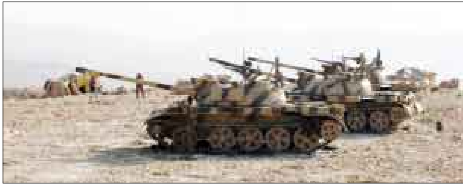
القوات المسلحة والأمن يدمران مخازن أسلحة للعناصر الإرهابية

صنعاء / متابعات: دمر أبطال القوات المسلحة مخزناً للأسلحة وسيارتين للعناصر الإرهابية في قرية الخيام حيث اشتعلت النيران في مخزن الأسلحة ودوت انفجارات كبيرة بداخله استمرت لعدة ساعات. ووجه أبطال القوات المسلحة والأمن في محور سفيان ضربات دقيقة دمرت أوكاراً للعناصر الإرهابية قرب بيت الجثام والحقت بصفوف تلك العناصر خسائر فادحة في الأرواح والمعدات، كما دمرنا سيارة على طريق الجوف كانت تحمل أسلحة وعناصر إرهابية. وتصدى أبطال قواتنا لمحاولات تسلل للعناصر الإرهابية قرب تبة 26 سبتمبر والعتاد.