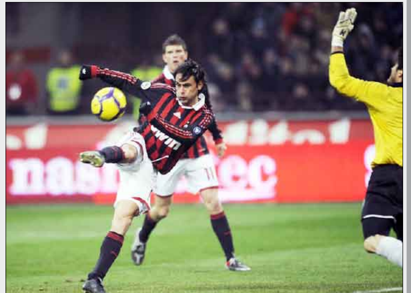
لقطة من المباراة

تأمله إلى ربع النهائي بفضل الفرنسي ماتيو فلأميني الذي أهداه هدف الفوز بكرة أطلقها من خارج من المنطقة (81). وكان روما تأهل أمس الأول الثلاثاء إلى ربع النهائي بفوزه على ترييستينا من الدرجة الثانية 3 - 1، ليحلح بانتير ميلان الذي كان أول المتأهلين بعد تغلبه على ضيفه ليفورنو 1 - صفر منتصف الشهر الماضي.