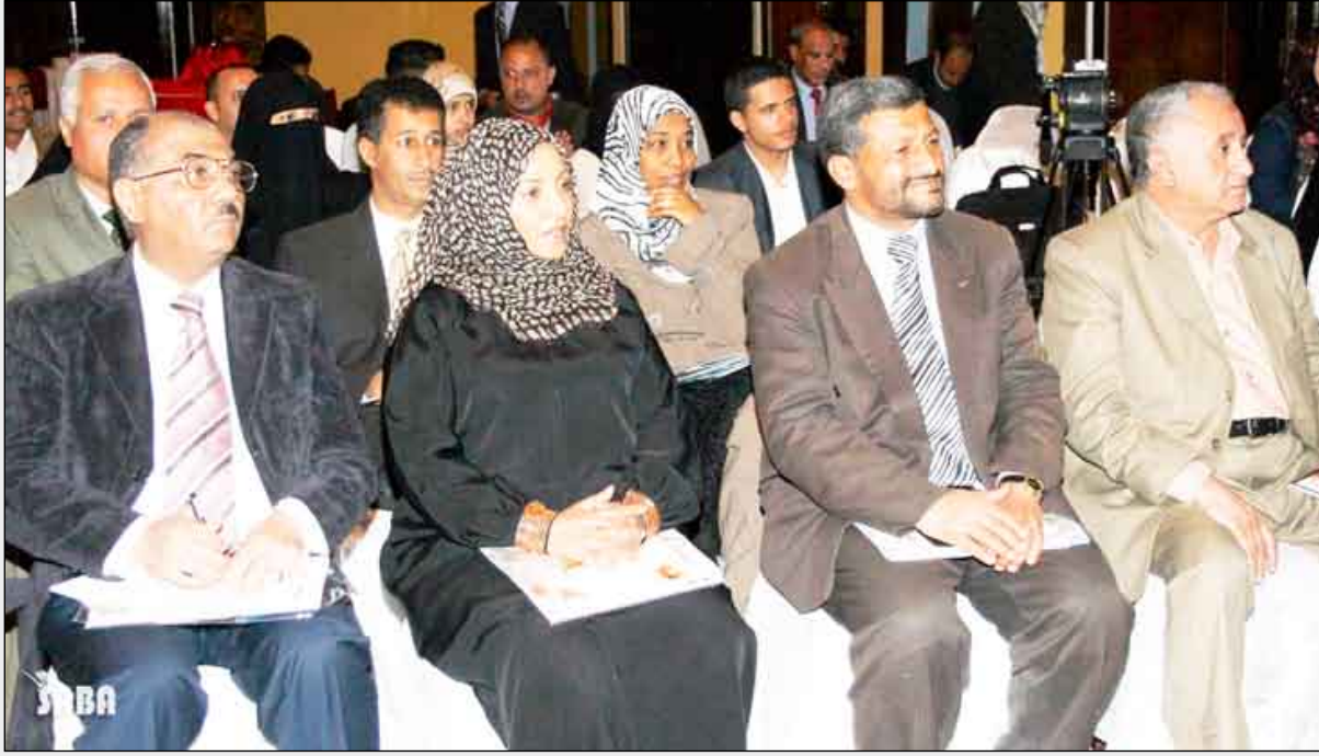
تدشين مجلة عروس

الرائدات في العمل السياسي اليوم هن من اللواتي انخرطن مبكراً في العمل الإعلامي