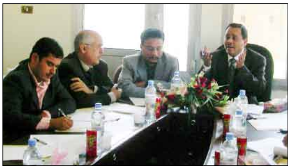
اجتماع عمدا كليات المجتمع الخاصة

عمداء كليات المجتمع الخاصة يوحدون شهادات التخرج والسجل الأكاديمي