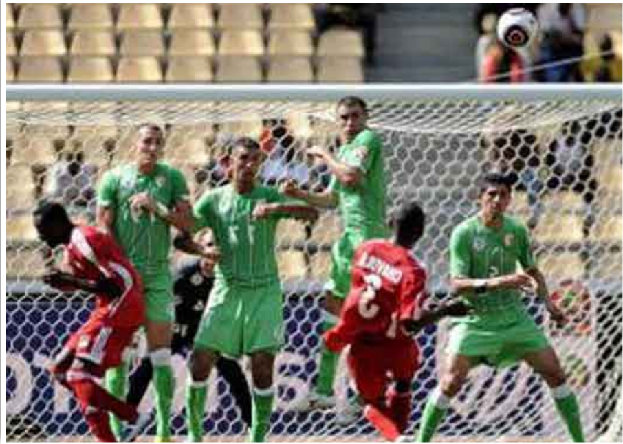
لقطة من المباراة

الجميع واليوم أخرجوا سكاكينهم لينبجونا بمجرد خسارة مباراة واحدة.