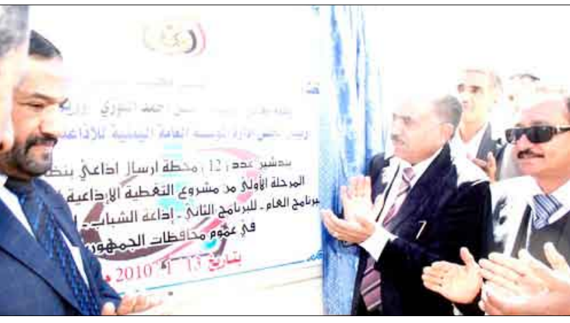
وزير الإعلام يدشن خلال تدهين محطات إرسال إذاعي

دشن وزير الإعلام حسن اللوزي أمس بصنعاء العمل في 10 محطة إرسال إذاعي بنظام ال (إف أم) المرحلة الثانية من مشروع تقوية وتوسيع مساحة التغطية الإذاعية العمومية للبرامج العامة والثانية وإذاعة الشباب والإذاعات المحلية. ويتكون المشروع البالغة كلفته الإجمالية مليونين و200 ألف يورو من عشر محطات بث إذاعي في نطاق ال (إف أم) كل محطة بقدرة خمسة كيلو وات مجهزة بهوائيات البث وملحقاتها في محافظات ذمار، مأرب، تعز، الضالع، عمران. وقد قام الوزير اللوزي بإذاعة الستار عن اللوحة التذكارية للمشروع واستمع من القائمين على المشروع إلى شرح تفصيلي حول مكوناته والمساحة المعول عليها في تغطية البث الإذاعي بنظام ال (إف أم) على مستوى الجمهورية. وأدى وزير الإعلام بتصريح لوسائل الإعلام قال فيه: أنا سعيد جداً بتدشين المرحلة الثانية من مشروع تقوية وتوسيع مساحة التغطية الإذاعية الوطنية بالبرامج العامة (إذاعة صنعاء) والبرنامج الثاني (إذاعة عدن) وإذاعة الشباب بنظام (إف أم - إم) الذي يتميز بجودة ونفاذ الاستقبال ليلاً ونهاراً. وأضاف: إن هذا التدشين لعمل عشر محطات إرسال في عدد من محافظات الجمهورية بقدرة (5) كيلو وات يعتبر من أهم إنجازات مشاريع الخطة الخمسية الثالثة للتغطية الوطنية الشاملة وتقديم الخدمات الإعلامية عبر إذاعة صنعاء وعدن لضمانة مزيد من رفح مستوى وعي المواطن بنينا وثقافتيا واجتماعيا وسياسيا وضمان وصول الرسالة الإعلامية لكل أرجاء الوطن بفضل تقوية وتوسيع نطاق البث الإذاعي داخليا وخارجيا.