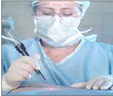
حل العدد الماضي

إيرفين / متابعات : يبدو أن آمالاً تلوح في أفق المصابين بالجلطات بعدما أثبت علاج جديد فعالته على عدد من الجرذان المريضة. وقال باحثون أميركيون أن نوعاً من البروتين قد يساعد في استرجاع الحركة في أطراف تضررت بسبب جلطة قبل فترة طويلة. وقام باحث في جامعة كاليفورنيا باختيار على عامل النمو البروتيني "الفا" في دراستين طبقاً على الجرذان. في الدراسة الأولى، التي نشرت في مجلة "علم الأعصاب"، استرجعت جرذان، أصيبت بجلطة قبل شهر "أي ما يعادل سنة كاملة عند البشر" وإنما حقنت بجرعة صغيرة من بروتين "الفا" في الدماغ مباشرة، 99% من