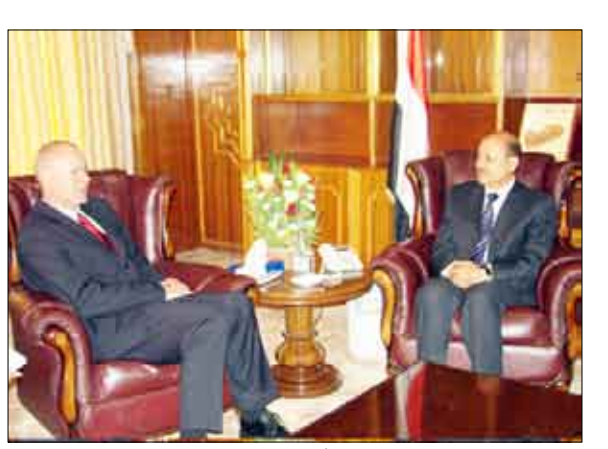
العلمي يلتقي السفير الألماني

ببحث نائب رئيس الوزراء لشؤون العلاقات والأمم وزير الخارجية الدكتور رشاد محمد العلمي خلال لقائه أمس السفير الألماني بصنعاء ميكيل كلوك بيير شتولتو عددا من المواضيع المتعلقة بالجوانب التنموية والاقتصادية والأمنية التي من شأنها تعزيز العلاقات الثنائية بين البلدين الصديقين. وقد أشاد نائب رئيس الوزراء بجهد السفير الألماني في تعزيز العلاقات بين البلدين الصديقين... وأشار إلى أن زيارة وزير الخارجية الألماني كانت ناجحة ومثمرة وسوف يتم تكرارها مستقبلا.