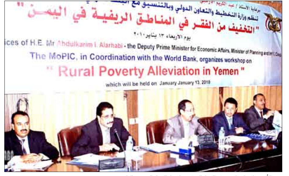
الأرجبي لدى افتتاحه ورشة العمل التثقيمية لإعداد الخطة الخمسية الرابعة