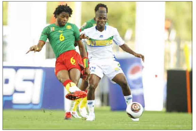
لقطة من المباراة