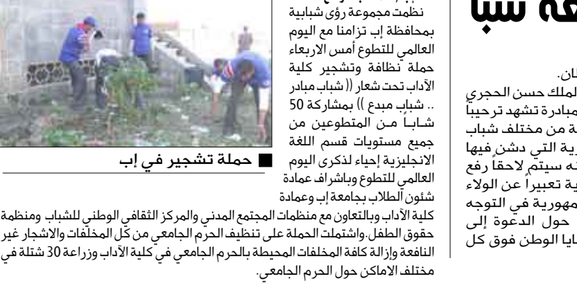
حملة تشجير في إب

أب / محمد عبد الواسع : نظمت مجموعة رؤى شبابية بمحافظة إب تزامناً مع اليوم العالمي للتطوع أمس الأربعاء حملة نظافة وتشجير كلية الآداب تحت شعار (شباب مبادر... شباب مبدع) بمشاركة 50 شاباً من المتطوعين من جميع مستويات قسم اللغة الإنجليزية إحياء لذكرى اليوم العالمي للتطوع وبإشراف عمادة شؤون الطلاب بجامعة إب وعمادة كلية الآداب وبالتعاون مع منظمات المجتمع المدني والمركز الثقافي الوطني للشباب ومنظمة حقوق الطفل، واشتملت الحملة على تنظيف الحرم الجامعي من كل المخلفات والأشجار غير النافعة وإزالة كافة المخلفات المحيطة بالحرم الجامعي في كلية الآداب وزراعة 30 شتلة في مختلف الأماكن حول الحرم الجامعي.