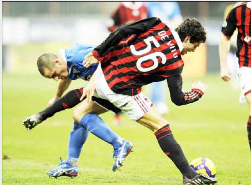
لقطة من المباراة