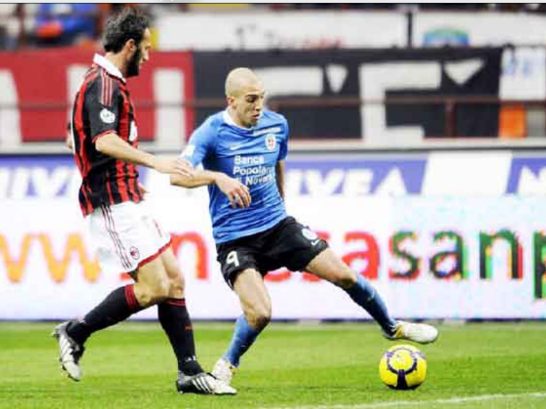
لقطة من المباراة