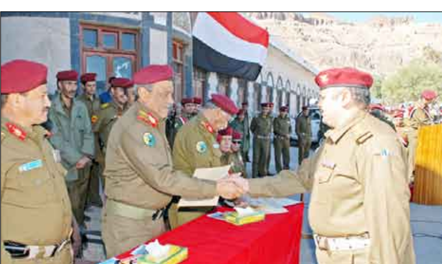
من فعاليات تدشين العام التدريبي الجديد لدائرة الإمداد والتموين العسكري