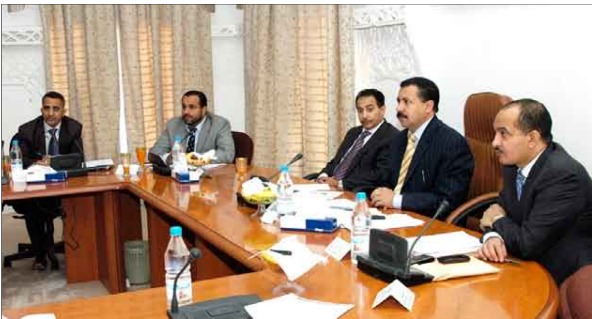
الاجتماع الدوري للجنة الفنية للأولويات