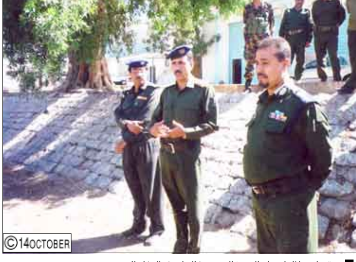
قيران خلال اختتام الدورة التدريبية الخاصة بالدفاع المدني

وجنود الدفاع المدني بعدن واستغرقت أسبوعاً كاملاً. وتلقى المشاركون في الدورة مختلف المعارف والعلوم الأمنية في مجال الدفاع المدني والإطفاء والإنقاذ والإسعافات الأولية وتسلق المباني الإنقاذ المصائبين والجرحى من الحرائق والحوادث. وقد اختتمت هذه الدورة بحضور الأخ العميد ركن/ عبدالله عبده قيران مدير عام أمن محافظة عدن والأخ العقيد مهندس/ محمد عبده حيدر المقرمي مدير فرع مصلحة الدفاع المدني بمحافظة عدن. وفي حفل اختتام هذه الدورة شهد الأخ مدير أمن المحافظة تنفيذ المشروع التطبيقي الذي اختتمت به هذه الدورة وأشاد بالجهود التي بذلها المشاركون، مشيداً على أهمية عقد مثل هذه الدورات التدريبية، ووعده بتحديث وضع الدفاع المدني بالمحافظة ورفده بما يحتاج من قوة بشرية ومعدات وخصوصاً إننا مقبلون على استقبال (20) وفي ختام الحفل قام الأخ العميد ركن/ عبدالله عبده قيران مدير أمن عدن بتوزيع الشهادات والحوافز التقديرية على المشاركين في الدورة.