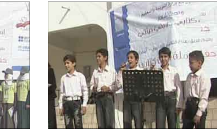
تدشين حملة ( أحب كتابي .. لأبني حياتي )

والتنوير والقدرة على التحليل وإبداء الرأي السليم واكتساب الحكمة والتفوق العلمي والعملي . وأكد استعداد المجلس الثقافي البريطاني بالتعاون مع الجهات ذات العلاقة لتوسيع حملة أحب كتابي إلى خارج المحافظة وذلك خلال الفترة القادمة لما له من أهمية وانعكاسات ايجابية على تعليم وثقافة وتنوير