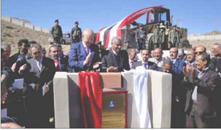
وضع الحجر الأساس لمشروع مباني الجامعة اللبنانية بصنعاء

عن / ساء: الرفاهية الإنسانية لكل عربي لأن خيار الاستثمار في البشر كان ولا يزال وسيبقى هو الأهم. وقال إن تأسيس الجامعة اللبنانية الدولية في الجمهورية اليمنية كما في الجمهورية اللبنانية يستند إلى رؤيتنا لحل التعليم في الوطن العربي وللأزمة العميقة التي تلغف في ضوء التطورات الجذرية من حولنا كما تعكسها ثورة العلوم والتكنولوجيا ووسائل الاتصال. وأوضح أن التخطيط لإنشاء الجامعة اللبنانية قد وضع في اعتباره هذا الواقع وأغناه بدراسة عميقة للمحيط الذي تضيق علومه التطبيقية بضغوط كتم هائل من الطلاب ما يزيد من شروط الالتحاق بالتعليم العالي وتشديد قيوده وبالتالى يحرم الكثيرون من تحقيق طموحاتهم في التعليم العالي الذي يندشونه، مشيراً إلى أن التعليم حق إنساني أساسي وغاية في حد ذاته وسبيلة مهمة لتحقيق الرفاهية الإنسانية وقد أصبح ضرورة وطنية واجتماعية لكل مواطن مؤهل،