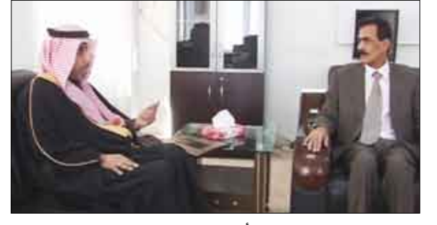
المصري خلال استقبال أمين عام مجلس وزراء الداخلية العرب

عن / ساء: التقى وزير الداخلية اللواء الركن مطهر رشاد المصري أمس الأمين العام لمجلس وزراء الداخلية العرب الدكتور محمد بن علي كومان الذي يزور اليمن حاليا. جري خلال اللقاء بحث عدد من القضايا الأمنية وجملة والتدابير والمعالجات التي اتخذها مجلس وزراء الداخلية العرب في اجتماعه السابق حوال عدد من القضايا الأمنية المتمثلة بقضايا المخدرات والجريمة المنظمة وكذا الشوط الذي قطع في هذا المجال، بالإضافة إلى مناقشة عدد من المقترحات والأعمال الإدارية والتنفيذية المتعلقة بعمل المجلس وهيئاته المختلفة. وأوضح وزير الداخلية جهود