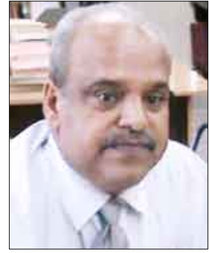
عـن/ نوال مكيش:

تعقد اليوم برئاسة جامعة عدن ندوة علمية عن "البرنامج الانتخابي لفخامة الرئيس/ علي عبدالله صالح رئيس الجمهورية (2006 - 2010م". وأشار الدكتور/ صالح مبارك عميد كلية الهندسة رئيس اللجنة المنظمة للندوة إلى أن الهدف من الندوة هو بحث ما تم إنجازه من البرامج الانتخابية لفخامة الرئيس خلال السنوات الأربع الماضية في المجالات الاقتصادية والاجتماعية والإعلامية والثقافية ومنظمات المجتمع المدني وبناء الدولة وتطوير ألياتها.. فضلا عن أن الندوة ستقف أمام أربعة محاور علمية وبحثية عن الجانب الاقتصادي والاجتماعي مقدمة من الدكتور/ خليل إبراهيم والدكتور/ ابتهاج الخيبة والدكتور/ أحمد فضيل والدكتور/ مبارك الحمصي والدكتور/ ناصر علي ناصر والدكتور/ هدى علوي والدكتور/ عبدالوهاب شمسان.