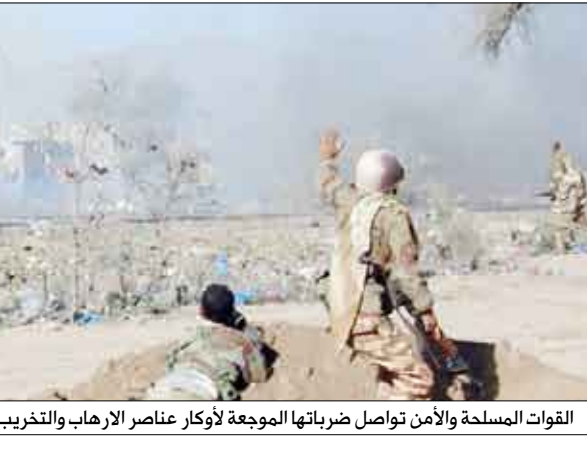
القوات المسلحة والأمن تواصل ضرباتها الموجعة لأوكران عناصر الإرهاب والتخريب