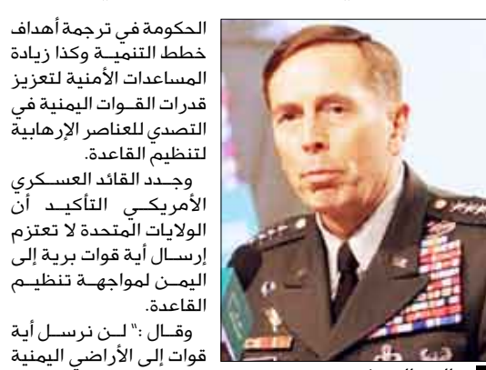
الجنرال ديفيد بترينوس دوماً على دعم جهود الدولة وتعزيز قدراتها الأمنية في مواجهة خطر القاعدة.

فلوريدا / سيا : أعلنت الولايات المتحدة الأمريكية أمس عزيمتها مضاعفة حجم المساعدات التنموية والأمنية المقدمة لليمن. ونقلت قناة (سي إن إن) الإخبارية عن قائد القيادة المركزية الأمريكية الجنرال ديفيد بترينوس قوله: " إن الولايات المتحدة تنوي مضاعفة حجم مساعداتها لليمن، من 70 مليون دولار إلى أكثر من 150 مليون دولار". ولفت بترينوس إلى أن أمريكا ستوفر المزيد من المساعدات الاقتصادية لليمن، لمساعدة