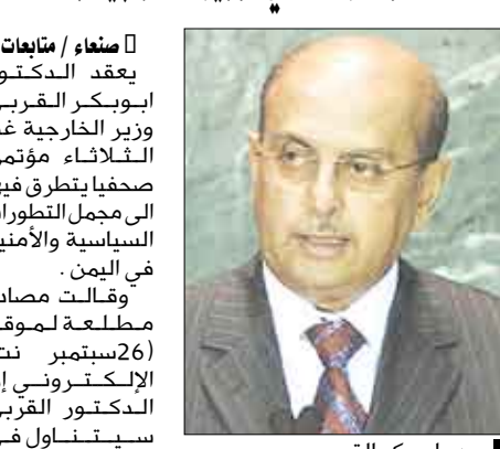
د. ابوبكر القرني مؤتمر لندن والمواضيع التي سيجبها المؤتمر المقرر انعقاده في 28 يناير الجاري.

منعاً / متابعة : يعقد الدكتور ابوبكر القرني وزير الخارجية عدداً الثلاثاء مؤتمراً صحفياً يتطرق فيها إلى مجمل التطورات السياسية والأمنية في اليمن. وقالت مصادر مطلعة لموقع (26سبتمبر نت) الإلكتروني إن الدكتور القرني سيتناول في المؤتمر الصحفي التحضيرات لعقد مؤتمر لندن والمواضيع التي سيجبها المؤتمر المقرر انعقاده في 28 يناير الجاري.