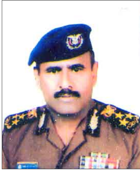
العميد أحمد علي مسعود

والنساء والعجزة والمسنين من مواطني محافظة حجة إلى محافظة حجة. ورغم ذلك فإن رجال الأمن في محافظة حجة من ضباط وصف ضباط وجنود يبذلون جهوداً مخلصاً ومشكورة في استقبال وحماية الإخوة النازحين وتوفير الأمن والاستقرار لهم في المخيمات.