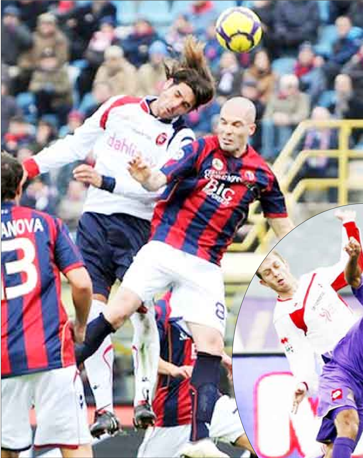
صراع في الهواء بين لاعبي بولونيا وكالباري

لوكاريلي في الدقيقة 22 و62 على التوالي، قبل أن يحرز لاعب الوسط السويسري بليريم جيايلى هدف بارما الوحيد في الدقيقة 68، فارتفع رصيد ليفورنو إلى 21 نقطة وتقدم إلى المركز الرابع عشر. وقفز جنوى إلى المركز الحادي عشر بعد أن رفع رصيده إلى 27 نقطة، إثر فوزه على ضيفه كاتانيا بهدفين نظيفين إثر فوزه على ضيفه كاتانيا بهدفين نظيفين. أحرزهما المهاجم الهولندي راسي المعار من إنتر دافيد سوازو في الدقيقة 36، والمهاجم جوزيبي شولبي في الدقيقة 71. وأكمل كاتانيا المباراة بعشرة لاعبين منذ الدقيقة 28 بعد طرد مدافعه جوزيبي بيوشي لحصوله على الإنذار الثاني، وازدادت متاعب الفريق الذي توقف رصيده عند 15 نقطة في المركز الثامن عشر. وفي مباراة متكافئة تعادل أودينيزي مع ضيفه لانسو بهدف ليس فقط قاريا ولكن عالميا» في إشارة إلى نهائيات كأس العالم في جنوب إفريقيا الصيف المقبل حيث تلعب ساحل العاج في المجموعة السابعة إلى جانب البرازيل وكوريا الشمالية والبرتغال. في المقابل، تعول بوركين فاسو على أهداف التصفيات موموني داغانو صاحب 12 هدفا. وستكون المرة الأولى التي تلتقي فيها ساحل العاج وبوركينا فاسو في النهائيات القارية.