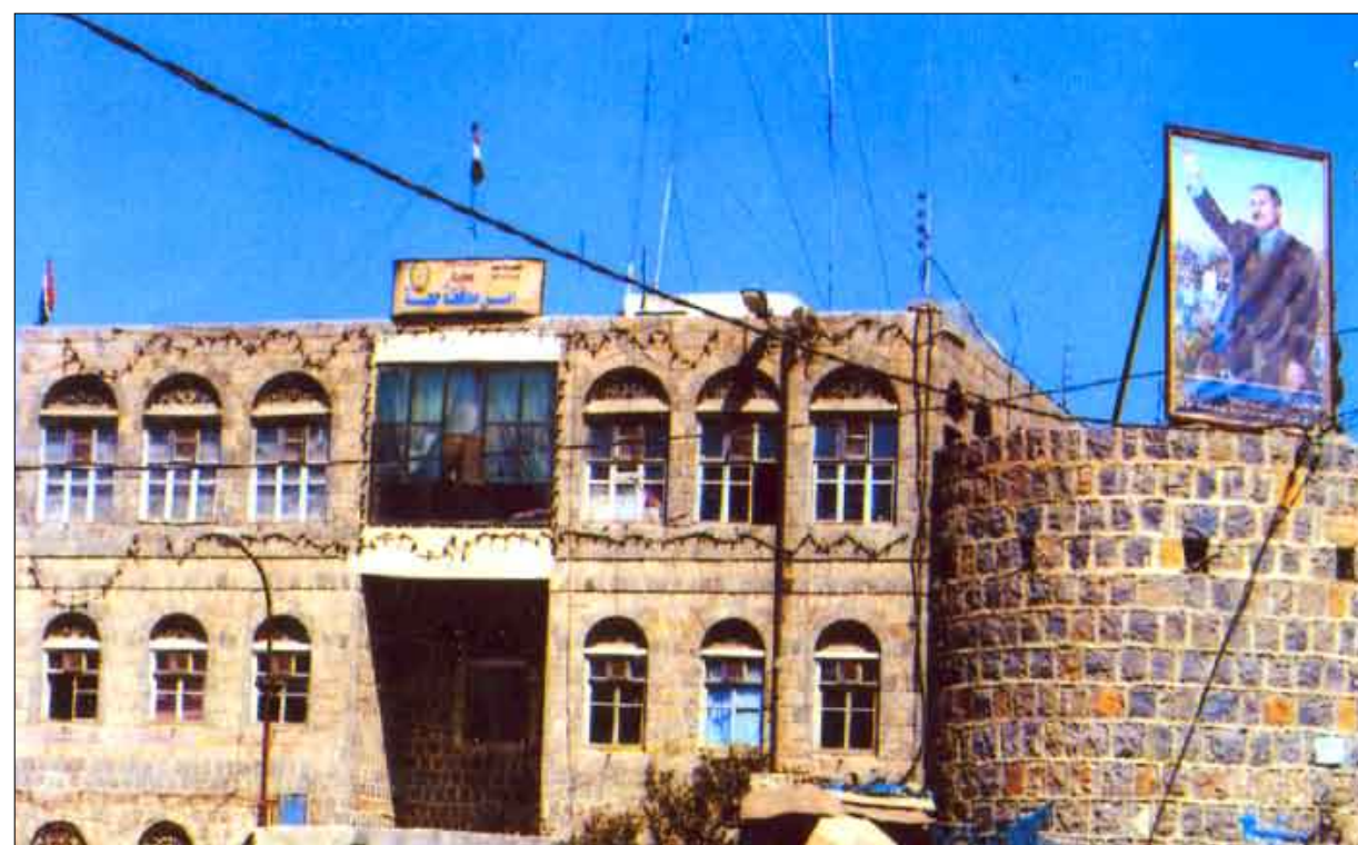
مبنى إدارة أمن محافظة حجة

دعوة فخامة الرئيس إلى الحوار تصب في إطار حل الأزمات بالحكمة