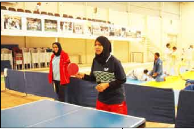
من نشاطات رياضة المرأة

الرياضة لكسب لياقة بدنية تؤهل الفتيات للتغلب على نمط الحياة المعاصرة ، بالإضافة إلى إكسابهن الثقة بالنفس وتحقيق مبدأ التأخي بين جميع فتيات الجمهورية . وفي ما يتعلق بالتدريب والتأهيل عقدت الإدارة العامة للمرأة بوزارة الشباب والرياضة خلال الموسم الماضي دورتين تدريبيتين في كرتي السلة الطائرة بمشاركة منسوبات من مختلف محافظات الجمهورية بهدف توسيع قاعدة اللاعبتين وإيجاد كوادر مؤهلة للتدريب والتأهيل .