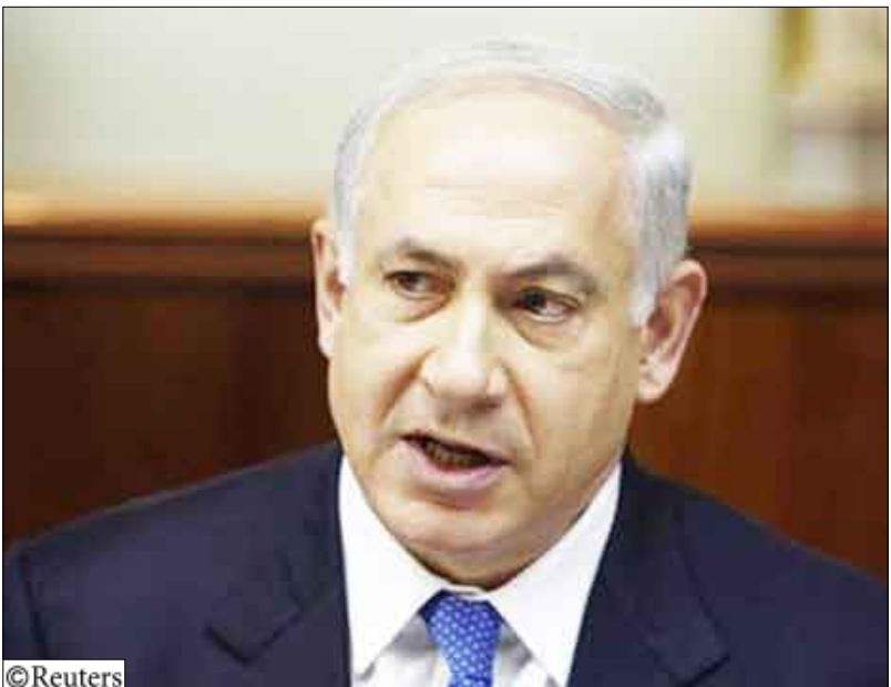
بنيامين نتنياهو رئيس الوزراء الإسرائيلي خلال اجتماع لحكومته في القدس يوم أمس.

وقتل ثلاثة فلسطينيين في سلسلة من الغارات الجوية الإسرائيلية في قطاع غزة يوم الخميس ومن بينها أول غارة جوية منذ فترة طويلة