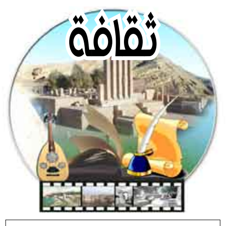
إشراف /فاطمة رشاد

ولقبت الوزارة في بيان النعي لتلت وكالة الأنباء اليمنية (سبأ) - نسخة منه ، إلى مدى الخسارة التي خلفها رحيل الفنان الكاف منوهة بمناقب تجربته وتميز عطائه في خدمة الفن من خلال عدد كبير من الأعمال التي أثرت المكتبة الفنية وسقطت شاهداً على خصوصية تجربته الفنية وتذكر الأجيال القادمة بعطاءاته ونتائج المتميز. كما نوه بيان الوزارة بمشوار حياة الفنان الراحل بدءاً من التحاقه للدراسة في مدرستي «الإخوة» و «ال كاف» بمدينة