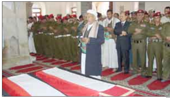
أثناء تشييع شهداء الواجب

وأشار اللواء القرشي إلى أن اللجنة اليمنية الإماراتية المشتركة