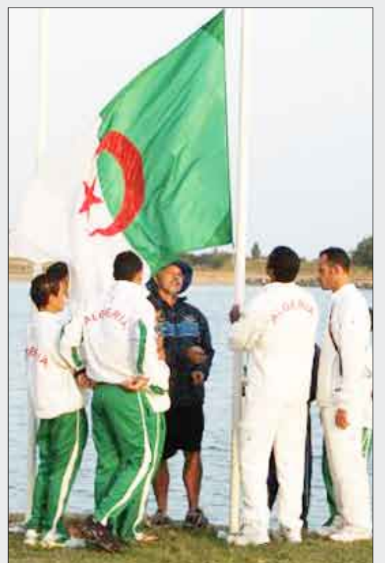
لاعبو الجزائر مع علم بلادهم

وحذر مدرب الجزائر رابح سعدان لاعبيه من الاستخفاف بمالوي التي «لم تات إلى انغولا من أجل المشاركة فقط بل المنافسة على حظوظها في بلوغ الدور الثاني على