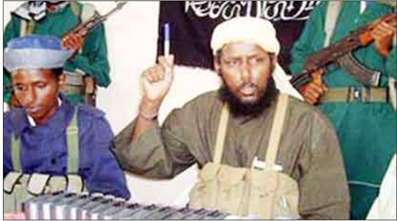
عناصر في حركة الشباب الإسلامية الصومالية

اعتقلت الشرطة الدينية التابعة لحركة الشباب الإسلامية عشرات الرجال في مدينة كيسمايو الصومالية الجنوبية لأنهم حلقوا لحاهم، حسب ما أفاد مسؤولون أول أمس الجمعة.