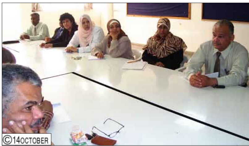
جانب من حضور الاجتماع

المشاركون يشددون على ضرورة توحيد كافة الجهود للحد من أمراض الدم والأورام السرطانية والبحث عن مسبباتها