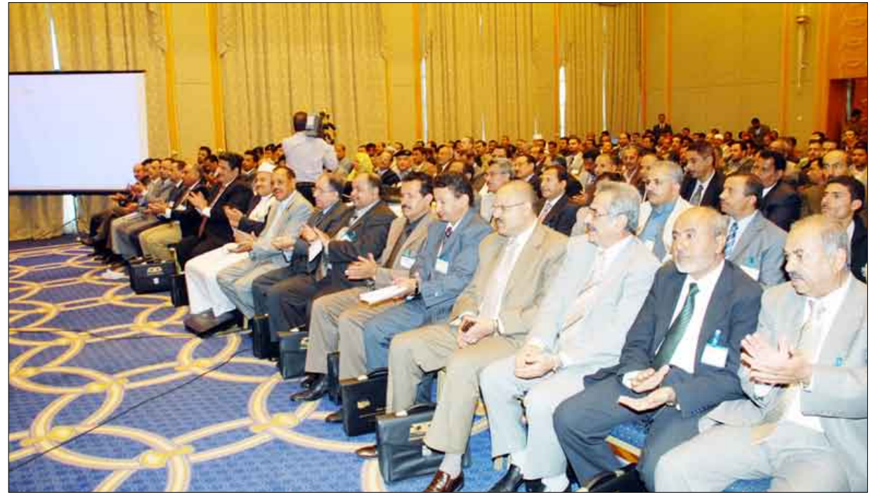
جانب من الحضور في الورشة

غادروا عبر المنافذ البرية وهو ما يعكس ضرورة الاهتمام بالمنافذ البرية وتطويرها وتقديم خدمات مميزة للمسافرين والتجارة. وأشار إلى أنه يجري حالياً الانتهاء من تنفيذ ميناء الوديع البري الذي يعتبر أحد أكبر الموانئ البرية في المنطقة بمكوناته الإنشائية وموقعه المتميز وهو ما يؤهله ليكون ميناءاً رئيسياً ومحوراً لاهتمام الجميع بتطويره ليكون نموذجاً لبقية الموانئ البرية في الجمهورية والمنطقة عموماً.