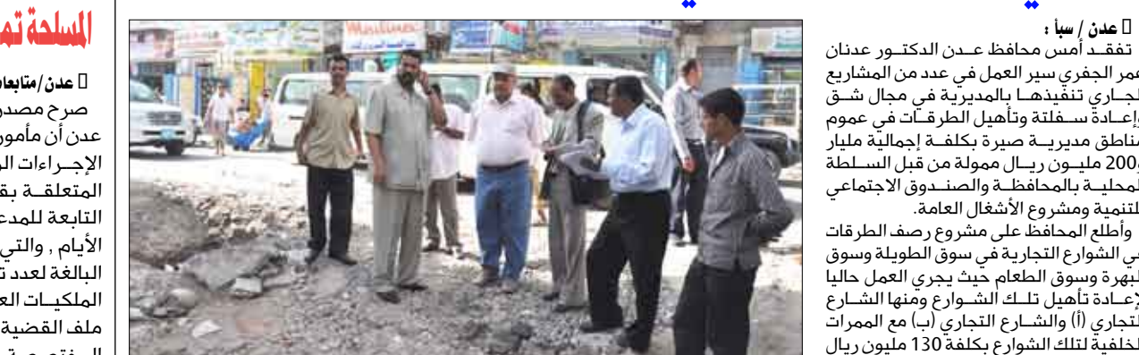
عدنان الجفري يتفقد سير العمل في شق وإعادة سفلنة وتأهيل الطرقات لثانوية بأكثر للبنات وثانوية البيحاني النموذجية بمديرية صيرة وأطلع خلالها على سير العملية الدراسية فيها. وأشاد المحافظ بالمستوى العالي الذي وصل إليه طلاب الثانوية .. معبراً عن تقديره للقيادات التربوية فيها. رافقه في جولته مدير عام مديرية صيرة خالد وهبي عقبة.