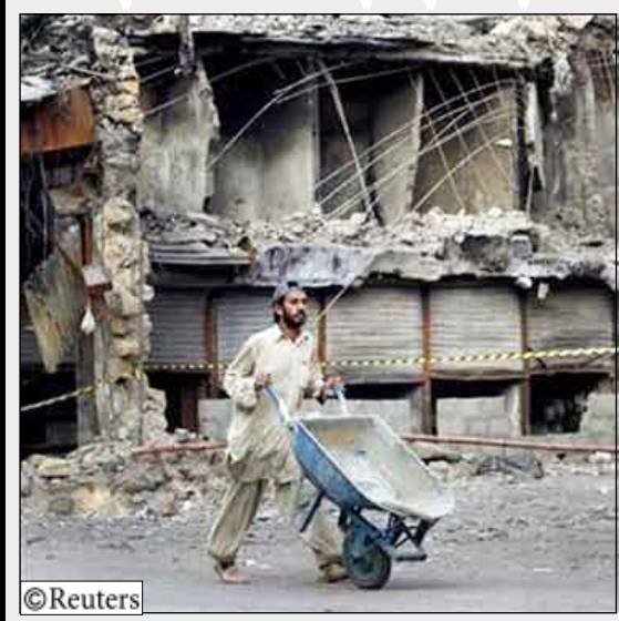
عامل يمر أمام محلات مدمرة في كراتشي يوم أمس.