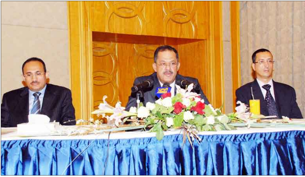
رئيس الوزراء لدى افتتاحه ورشة العمل الخاصة بتطوير الموانئ البرية