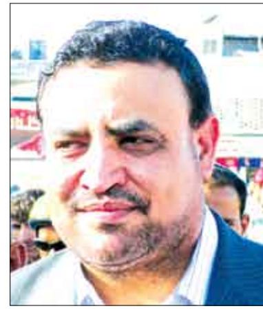
وزير الشباب والرياضة

ومن جانبه، عبر الرئيس الفخري لنادي شمسان الرياضي رئيس مجلس التنسيق لأندية عدن عن بالغ شكره وتقديره لمعالي الوزير / حمود محمد عباد ونائبه الشيخ / حاشد الأحمر على ما يبديانه من اهتمام ودعم لا محدود لهذه الأندية وحرصهما الدائم على تدليل أية صعوبات تعترض مسار التطور الرياضي وتلبية احتياجاتها التي تسهم في الارتقاء بعملها الرياضي والشبابي وتحقيق