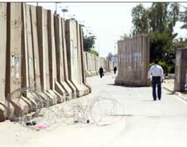
الحواجز الإسمنتية عادت إلى بغداد بعد التفجيرات الدامية

وختم عاشور بأن مظهر هذه الحواجز يبعث في نفوس العراقيين المزيد من المخاوف ويؤكد عدم قدرة السلطات على توفير الأمن بمعاييرها الصحية وليس بمزيد من القوة والتشدد.