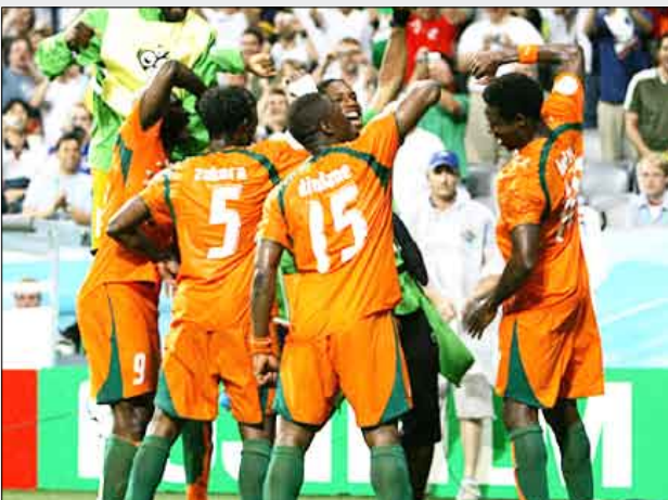
منتخب ساحل العاج

حسن ظنها، مضيفا: «لا أعتقد انه يفتقد شي للتتويج، منتخبنا الأفضل في القارة السمراء، نملك أفضل اللاعبين سواء محليا أو في القارة العجوز، يجب أن نستثمر كل هذه المعطيات لنخرج منتصرين». وختم قائلا «يجب أن نثبت للعالم أننا قادرون بقوة كاس العالم في جنوب إفريقيا الصيف المقبل حيث تلعب ساحل العاج في المجموعة السابعة إلى جانب البرازيل وكوريا الشمالية والبرتغال. في المقابل، تعول بوركين فاسو على أهداف التصفيات موموني داغانو صاحب 12 هدفا. وستكون المرة الأولى التي تلتقي فيها ساحل العاج وبوركينا فاسو في النهائيات القارية.