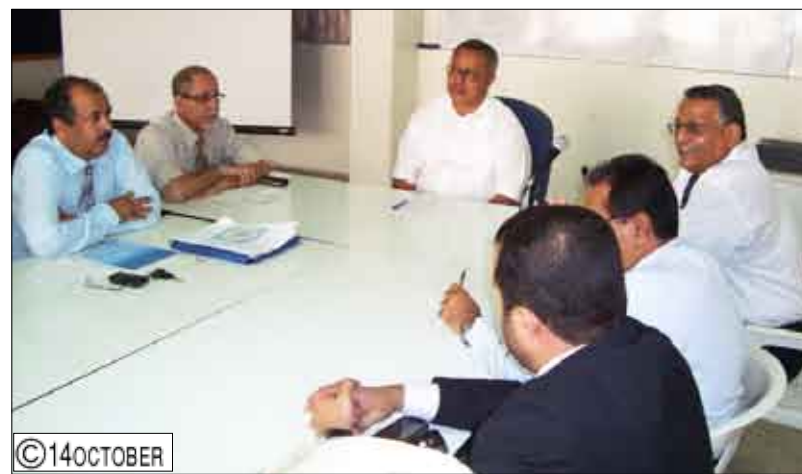
بن حبتور لدى ترؤسه اجتماع اللجنة التحضيرية للمؤتمر العلمي لأمراض الدم والأورام

عبدن/نصر باغريه، أشاد الدكتور عبدالعزيز صالح بن حبتور رئيس جامعة عدن بالجهود التي تبذلها اللجنة التحضيرية العليا للمؤتمر الثالث لأمراض الدم والأورام السرطانية الذي تنظمه جامعة عدن خلال الفترة من (16 - 18 فبراير 2010م).