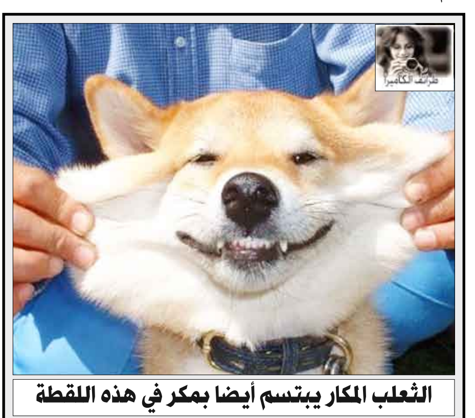
الثعلب المكار يتسم أيضا بمكر في هذه اللقطة

اليوغا رياضة جميلة تحتاج الى تركيز ولكنها تساعد على الاسترخاء ، المصور المحترف-دان بوريس- قرر ان يصور اليوغا ولكن هذه المرة بالاستعانة بالقطط وليس ببني البشر، وهذه الصور التي فيها بعض التلاعب عن طريق الفوتوشوب ستكون بمثابة تقويم جديد للعام 2010 يتوقع أن يحوز إعجاب عشاق القطط والحيوانات بشكل عام.