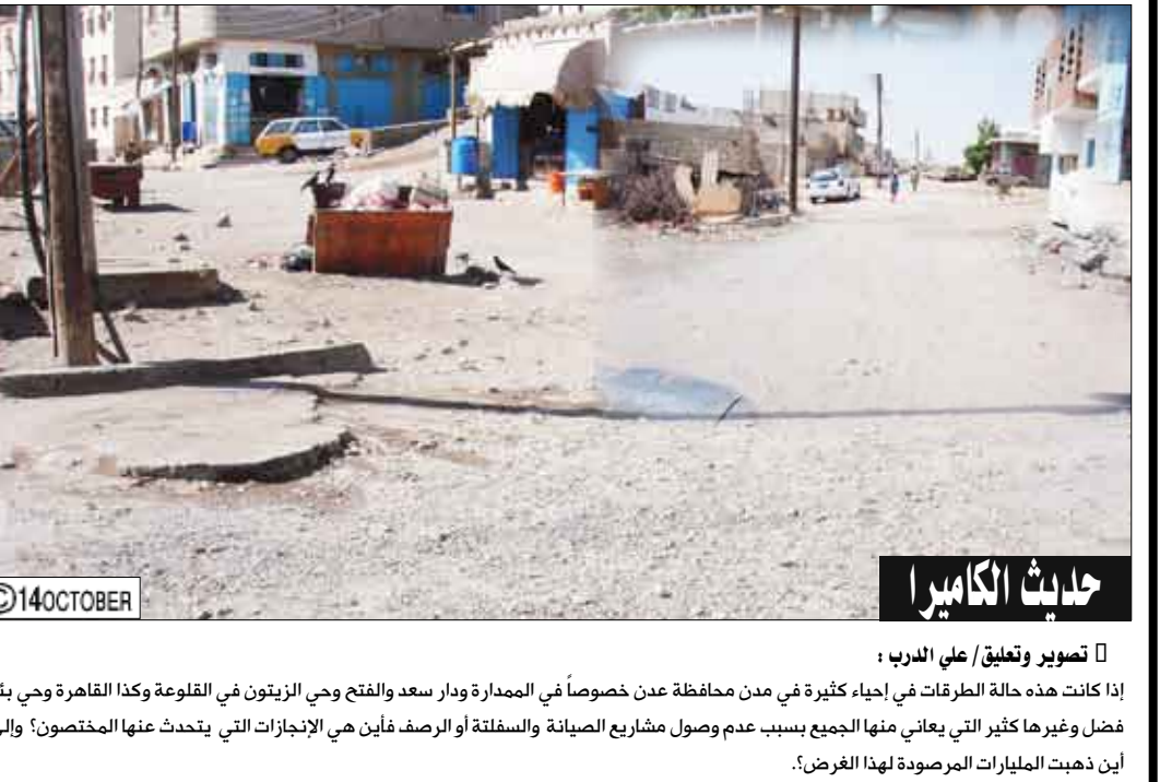
حدث الكاميرا تصوير وتعليق/ علي الحرب : إذا كانت هذه حالة الطرقات في أحياء كثيرة في مدن محافظة عدن خصوصاً في المدارة ودار سعد والفتح وحى الزيتون في القلعة وكذا القاهرة وحى بنر فضل وغيرها كثير التي يعاني منها الجميع بسبب عدم وصول مشاريع الصيانة والسفلتة أو الرصف فإين الإنجازات التي يتحدث عنها المختصون؛ وإلى أين ذهبت الميانات المرصودة لهذا الغرض؟