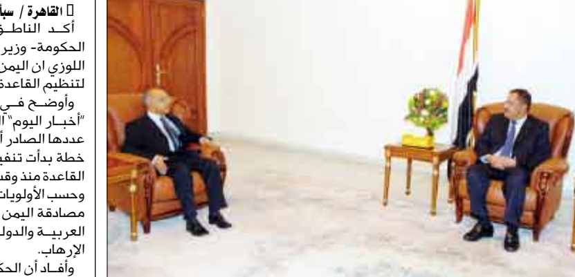
د. مجور أثناء استقباله السفير الباكستاني أمس

استقبل رئيس مجلس الوزراء الدكتور علي محمد مجور أمس بصنعاء السفير الباكستاني الدكتور خوجا القامو بمناسبة تعيينه مؤخراً سفيراً لدى بلادنا. وجرى خلال اللقاء تناول علاقات التعاون الثنائي بين البلدين الشقيقين وسبل تعزيزها في مختلف المجالات الاقتصادية والاستثمارية والتجارية. ونوه رئيس الوزراء بالتطور المستمر الذي تشهده العلاقات الإخوية بين الشعبين الشقيقين.. مشيراً إلى الحرص المشترك الذي توليه القيادة السياسية في البلدين للرفع المستمر بالعمل الثنائي وتأكيد الشراكة الاستثمارية والتجارية بين البلدين. ورحب الدكتور مجور بالسفير القامو وأعرب عن تهنياته له بالتفويض والنجاح في مهامه الدبلوماسية وخدمة العلاقات القائمة وتنمية المصالح المشتركة للشعبين اليمني والباكستاني. 3 <<