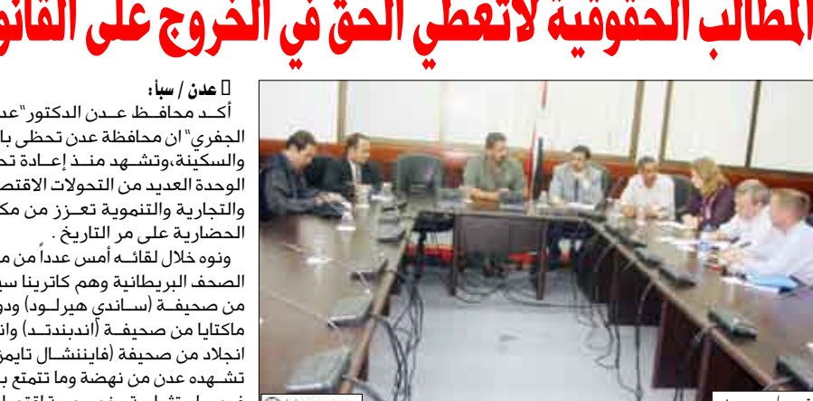
د. الجفري لدى لقائه عدداً من ممثلي الصحف البريطانية أمس

أكد محافظ عدن الدكتور "عبدان الجفري" أن محافظة عدن تحظى بالأمن والسكينة، وتشهد منذ إعادة تحقيق الوحدة العديد من التحولات الاقتصادية والتجارية والتنمية تعزز من مكانتها الحضارية على مر التاريخ . ونوه خلال لقائه أمس عدداً من ممثلي الصحف البريطانية وهم كاترينا سينورد من صحيفة (ساندي هيرولد) ودونولد ماكنايا من صحيفة (أندبنتد) واندريو انجاد من صحيفة (فايننشال تايمز) بما تشهده عدن من نهضة وما تتمتع به من فرص استثمارية وخصوصية اقتصادية. 3 <<