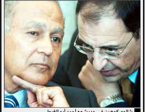
شالوم كوهين في حديث مع أحمد أبو الغيط

القاهرة/ مناجبات: شن السفير الإسرائيلي في القاهرة شالوم كوهين هجوما شديدا على مصر والصحافة المصرية واعتبر أن مصر تتصرف "مثل أعداء إسرائيل تماما". مستغبرا السياسة المتصالفة التي تعتمدها بلاده مع مصر. ونقلت صحيفة معاريف، يوم أمس الجمعة عن كوهين قوله هذا خلال اجتماع سفراء إسرائيل في القدس مطلع الأسبوع الحالي. واتج كوهين أمام رئيس الوزراء بنيامين نتانياهو على "التساهل الإسرائيلي تجاه مصر" وعدم الرد على التحريض ضد إسرائيل في الإعلام المصري. وتساءل كوهين "لماذا، رغم اتفاق السلام بين الدولتين، تتخم المقالات في وسائل الإعلام (المصرية) باسم العداء للسامية ونحن لا نرد عليها، ولماذا تستخدم إسرائيل لغة متسامحة والمتصالحة مع القيادة المصرية؟". وقالت الصحيفة إن نتانياهو رد على كوهين بإجابة عامة فقط، معتبراً أن الحديث يدور عن ترسبات عمرها عشرات السنين ويصعب تغيير الإعلام المصري. ونقلت عن مصادر سياسية إسرائيلية قولها إنه على الرغم من السلوك المصري تجاه إسرائيل فإن مصر تلعب دورا مهما جدا في محور استئناف المفاوضات مع الرئيس الفلسطيني محمود عباس وفي الصراع ضد البرنامج النووي الإيراني. وكان نتانياهو قد زار مصر يوم الثلاثاء الماضي والتقى الرئيس المصري حسني مبارك وطلب منه الضغط على عباس لاستئناف المفاوضات بين إسرائيل والفلسطينيين. ويشغل شالوم كوهين منصب السفير في القاهرة لمدة أربع سنوات ونصف. ومن المنتظر أن ينهي مهامه الشهر المقبل ليحل مكانه السفير الجديد يتسحاق ليفانوف. وكان ليفانوف قد شغل في الماضي عدة مناصب دبلوماسية رفيعة بما في ذلك سفير إسرائيل لدى مؤسسات الأمم المتحدة في جنيف وحدثاً باسم الخارجية الإسرائيلية.