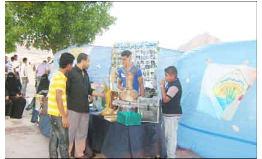
معرض المنتوجات الفنية