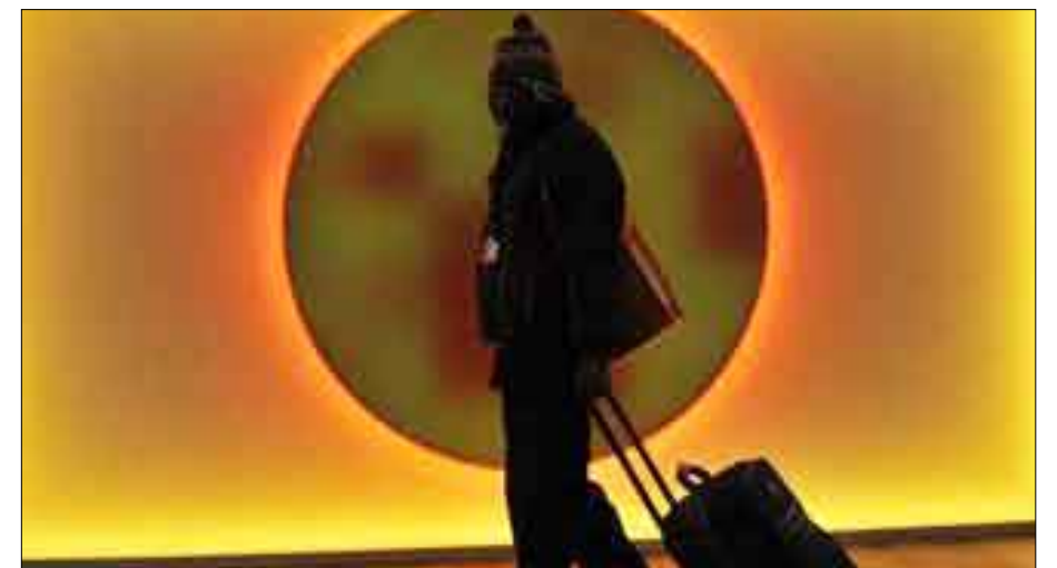
صور عن تغير المناخ