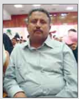
قائد راشد انعم