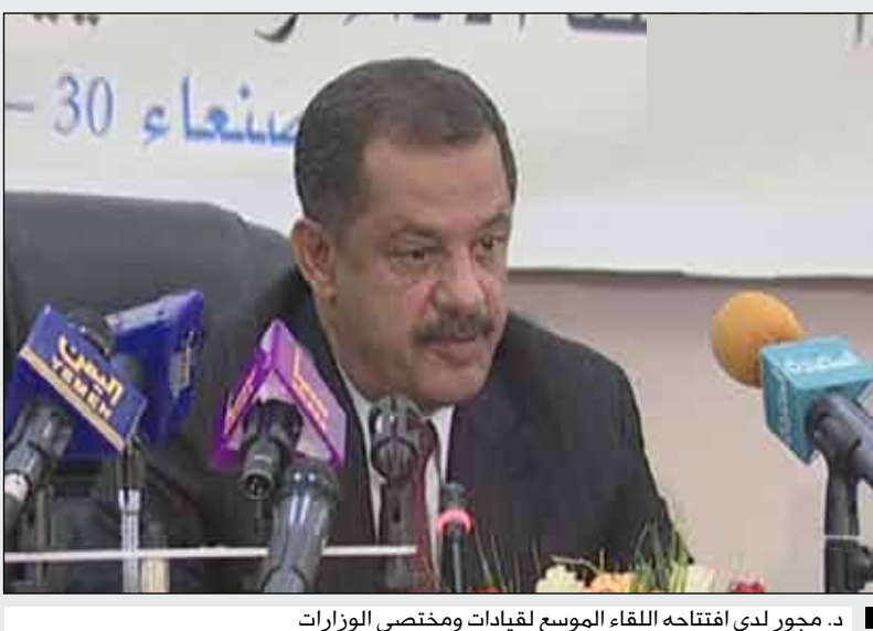
د. مجور لدى افتتاحه اللقاء الموسع لقيادات ومختصي الوزارات