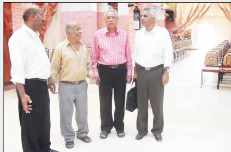
قاعة الاحتفالات في نادي الميناء