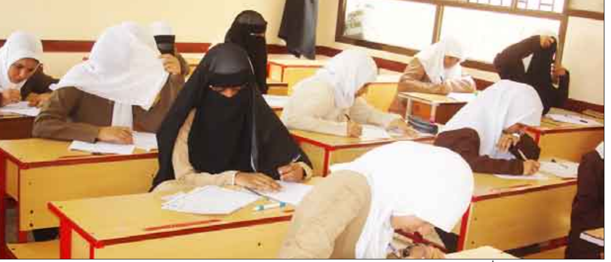
تعليم اللغة الانجليزية إلى أين؟

المدي لضمان ربحية المركز والمعهد على حساب التعليم. وأشار التقرير إلى أنه من خلال النزول الميداني للجامعات والمعاهد والمراكز الحكومية والخاصة كشفت المؤشرات ضعف دور الهيئات التعليمية، الإدارات الأكاديمية على التدريس والإشراف على نوعية التعليم، وعدم وجود معلمين ذوي التأهيل المناسب والخبرة الكافية لتدريس برامج ومستويات عالية ومتقدمة مثل ( التوفل، الإيلتس) إلا في بعض المعاهد والجامعات وعدم وجود آلية حديثة لتطوير وتصميم المناهج.