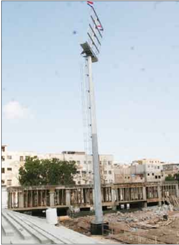
الإنارة في ملعب المعلا