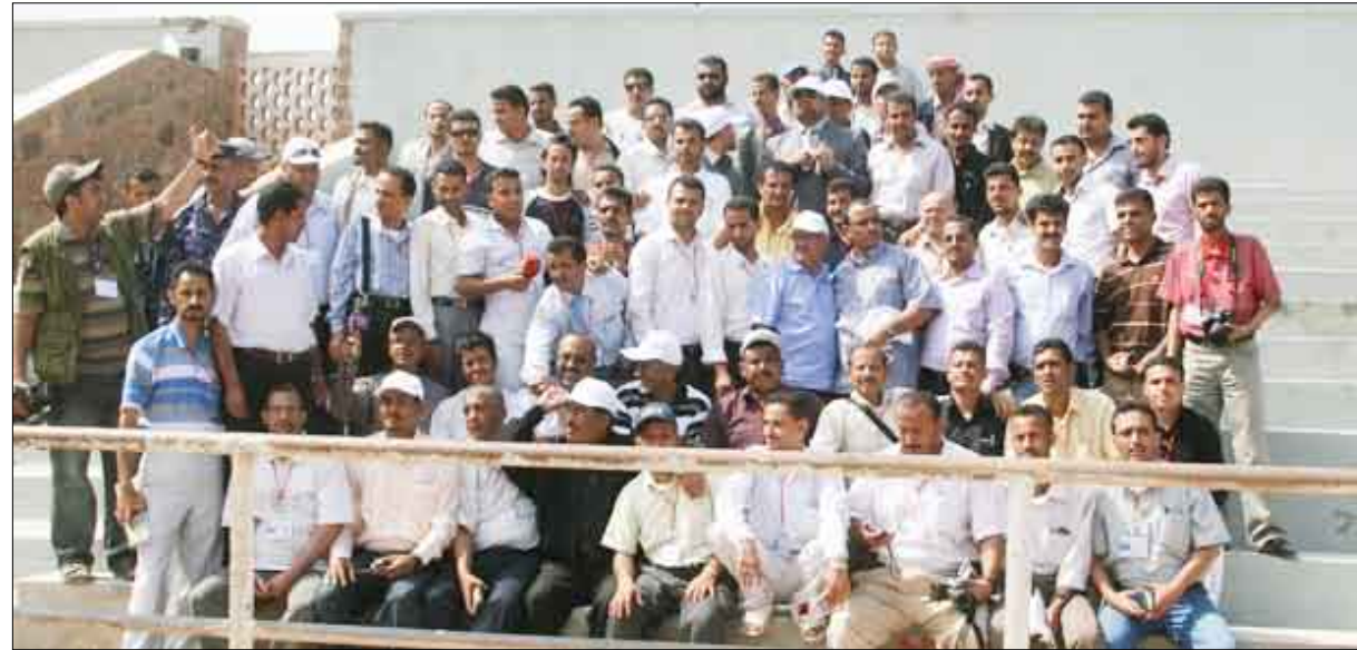
القافلة الإعلامية في ملعب المعلا

الأداء والإنجاز. وقد أكد الأخ / وزير الشباب والرياضة أهمية مضاعفة العمل ونوعية الإنجاز خلال الفترة القادمة والعمل بوتيرة عالية على إنجاز هذه المشاريع قبل موعدها المحدد وبأفضل مستويات الجودة والتصاميم . الجدير بالذكر أن الأخ / حمود محمد عباد وزير الشباب والرياضة خلال هذه الزيارة التفقدية قد ترك سيارته جانباً وشارك القافلة الإعلامية وسيلة نقلها ( باص كوستر ) حتى اختتام الزيارة.