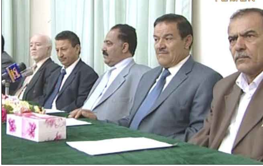
رئيس مجلس النواب يبدن الدورة الثانية للهيئة العامة للاتحاد التعاوني الزراعي .