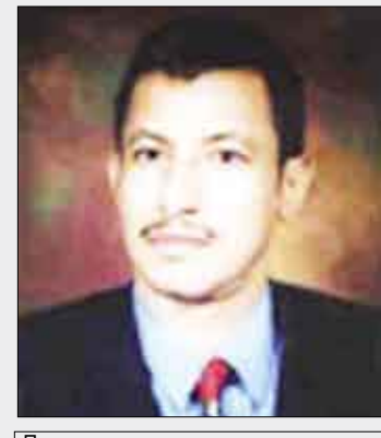
إعداد: دكتور معين عبد الباري