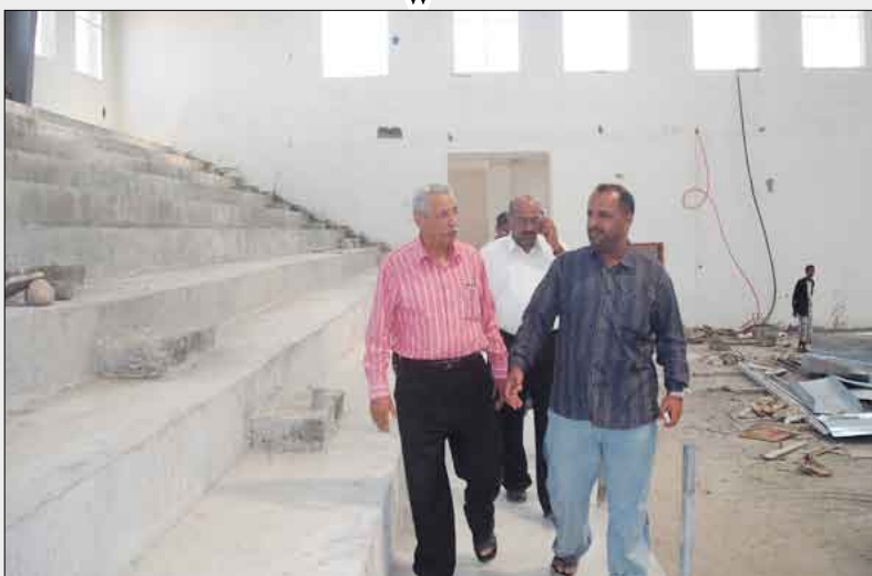
الصالة المغلقة الجديدة في خور مكسر