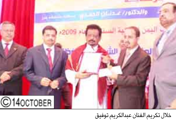
خلال تكريم الفنان عبدالكريم توفيق