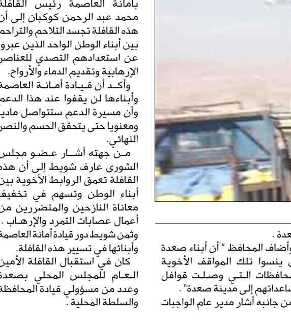
قافلة النصر الثانية تصل مدينة صعدة

صعدة / سبأ، وصلت إلى مدينة صعدة أمس القافلة الثانية المقدمة من أبناء أمانة العاصمة لإخوانهم النازحين بمحافظة صعدة جراء الأعمال الإرهابية والتخريبية التي تقوم بها العصابة الإجرامية الحوثية. تحتوي القافلة الثانية والمسماة / قافلة النصر والبطولة / أكثر من 1200 طن من المواد الغذائية والإيوائية والأدوات المنزلية والمعلبات محمولة على متن 250 ناقلة كبيرة . وخلال استقبال القافلة أكد محافظ صعدة حسن محمد مناع أهمية هذه القوافل في التخفيف من معاناة النازحين الذين شرؤوا من منازلهم ومناطقهم ونهيت ممتلكاتهم من قبل عصابات الإرهاب والتخريب ..ونوه بأن هذه القافلة هي عنوان الترابط بين أبناء الشعب الواحد الواقف صفاً واحد في مواجهة هذه الشرزمة الخبيثة التي يجب اجتثاثها. وتمن المحافظ المواقف الأخوية صعدة . وأضاف المحافظ " أن أبناء صعدة لن ينسوا تلك المواقف الأخوية للمحافظات التي وصلت قوافل مساعداتهم إلى مدينة صعدة" . وعد من مسؤولي قيادة المحافظة والسلطة المحلية .