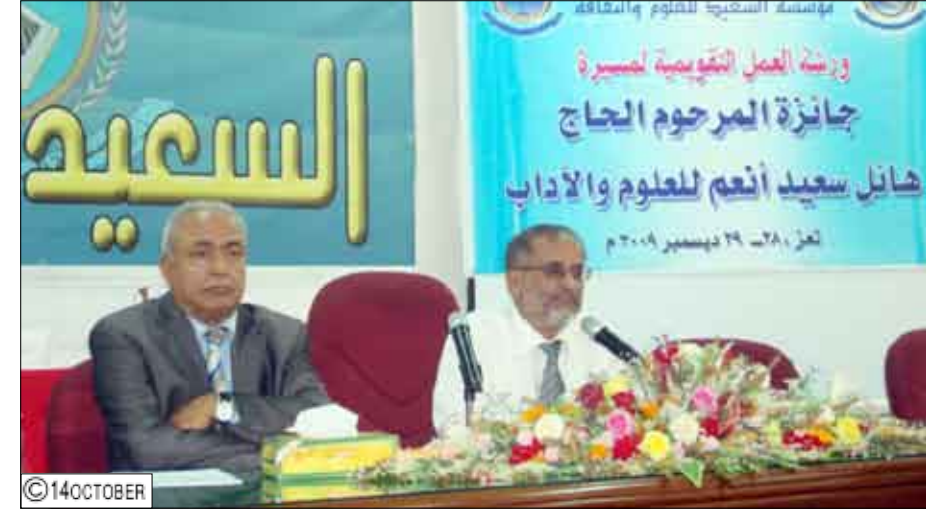
من رئاسة الجلسة