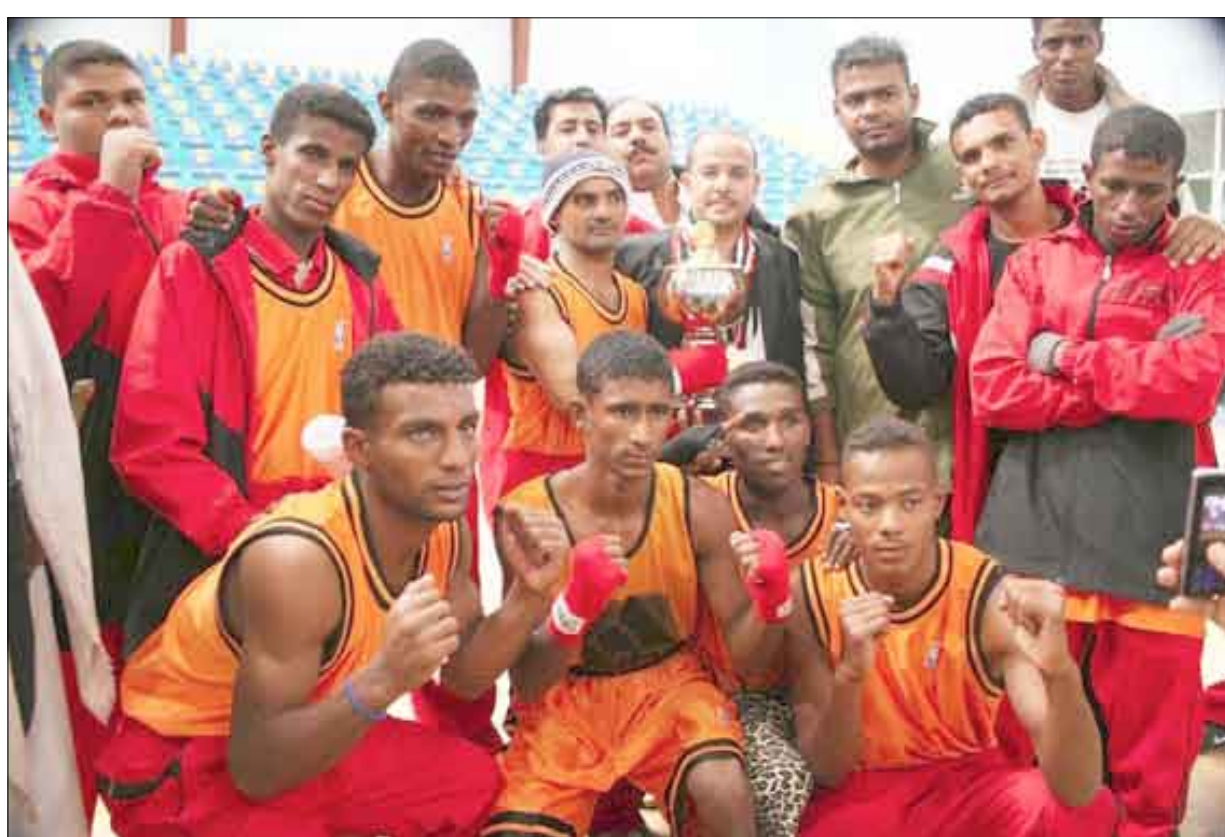
فريق شمسان للملاكمة