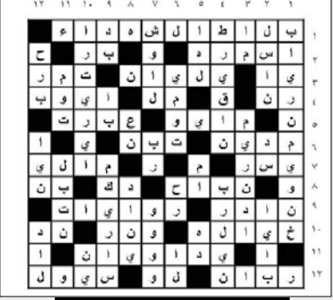
حل العدد الماضي

إعداد/ جمال ناصر شراء أفقياً : 1- كاتب من البلغاء الفصحاء من أهل بغداد برع في علم المنطق من كتبه (الخراج) (و نقد الشعر) و (نقد النثر) و (جواهر الأنفاظ). 2- منظمة الأمم المتحدة للتربية والعلم والثقافة - الطبي الأبيض. 3- قروي - برع - متشابهان. 4- من الأسماء الخمسة (معكوسة) - رب - فرصة. 5- وكالة الأنباء السورية - جمعية يمنية زراعية. 6- من الحبوب - عقل - ليث. 7- من أشهر المدن الأمريكية - نبذر. 8- متشابهان - من الألوان - اله. 9- من مخلوقات الله - من الطيور. 10- ساند - مؤمنون. 11- حيوان قطبي - بلد أفريقي. 12- شلف - أرشد - صوت السلاح. عمودياً : 1- سلطان عمان بعد تنازل أبيه سعيد بن تيمور سنة 1970م. 2- أرشد - عاصمة أوروبية - يابسة.