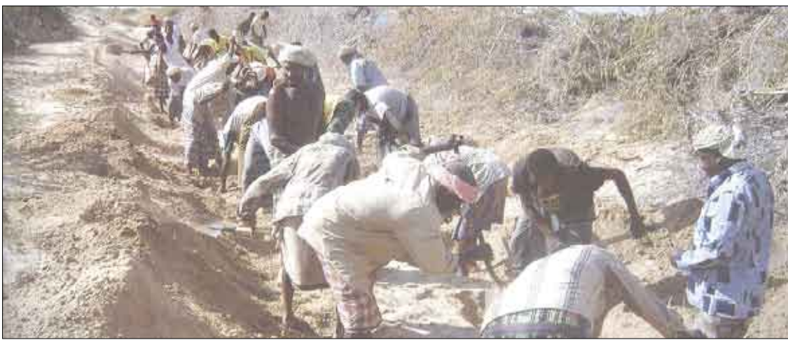
العمال أثناء تاديتهم لعملهم

وقال أن هذا البرنامج في البداية قام بعمل دورات تدريبية للطواقم الإداري الذي تولي مهام الإشراف والإدارة لهذه المشاريع وتم توظيف الفروع ضباط للبرنامج يتحملوا مسئولية الإشراف والمتابعة الميدانية بعد ذلك تم تدريب الاستشاريين الذين هم مسئولين مسؤولية مباشرة عن الإشراف في المشروع نفسه في الموقع حيث تم تدريب مجموعة من الاستشاريين في كل فرع يتراوح عددهم كمتوسط من (30-40) استشاري من مهندس ومحاسب واستشاري مجتمعي وهؤلاء هم يتولون المهام الإشرافية اليومية أو الأسبوعية في الموقع وقد أعدنا لهم دليل عمل و آلية تنفيذية محددة كيف يبدأ تنفيذ عمله من البداية إلى أن يتم استلام المشروع وما يهنا هنا هو كيف يتم التنفيذ حيث يتم حصر الأسر المستهدفة في كل منطقة وتسجل أسماء القادرين على العمل في هذه الأسر في كشوفات ويكون لدينا رقم أولي بأن هذه الأسرة ستكون مستحقها مبلغ معين بحسب مؤشر الفقر وبحسب الدراسة التي أجريتها حددنا قوائم كل أسرة أمامها رقم معين بحسب ما وصلت إليه المسوحات الميدانية أو الدراسة الميدانية ، بعد ذلك حددنا أسماء العاملين في كل أسرة وسجلنا أسماء العمالة وعملنا لهم جدولهم وبرامج زمنية ، بحيث تشغيل المجموعة الأولى معنا في بند الحفر مثلا والمجموعة الثانية في بند التسوية والمجموعة الثالثة في بند المباني وهكذا حتى يتم الانتهاء من المشروع وقد وصلنا الآن إلى حوالي (94%) من إنجاز المشاريع .