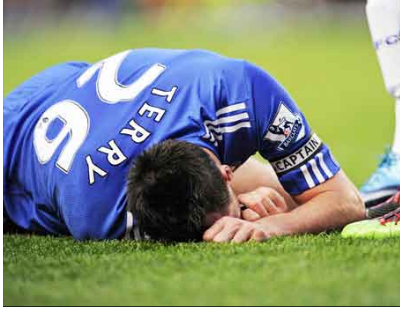
جون تيري على الارض بعد اصابته في راسه