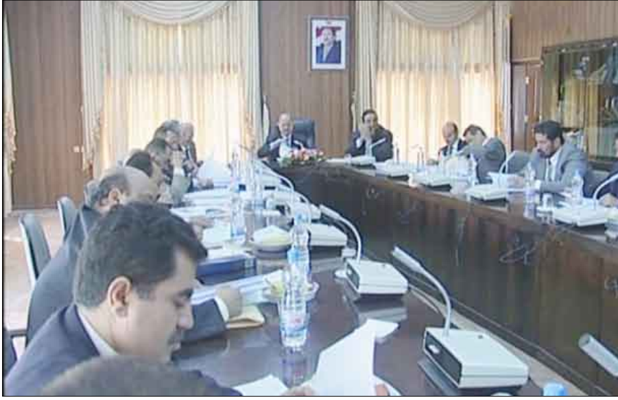
اجتماع لجنة خليجي 20

5 نجوم بالإضافة إلى أكثر من 50000 ريالاً فنانية الألف غرفة فندقية بمدينة عدن. كما كلفت اللجنة وزارة الأشغال العامة محافظ أبين بسرعة تقديم دراسات علمية دقيقة لمعالجة وحماية ملعب الوحدة بأبين من خلال تشجير المساحات المجاورة له بالإضافة إلى مشاريع الأثرية والخدمات الأساسية المطلوبة لذلك.