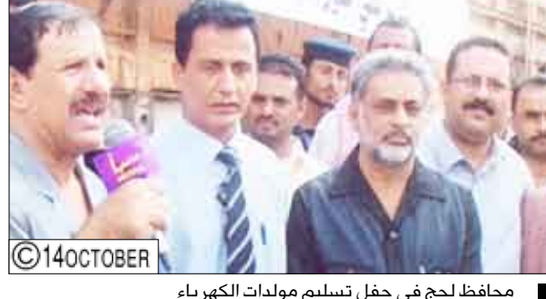
محافظ لحج في حفل تسليم مولدات الكهرباء