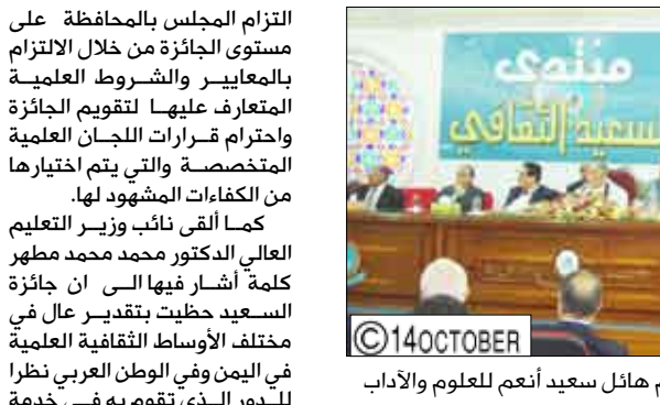
ورشة عمل لتقييم جائزة المرحوم هائل سعيد أنعم للعلوم والآداب

تضمنت مديريتنا طور الباحة والمضاربة ورأس العارة أمس خمسة مولدات كهربائية من مؤسسة الصالح الاجتماعية للتنمية، تتراوح طاقتها التوليدية بين خمسمائة إلى مائتي كيلووات.