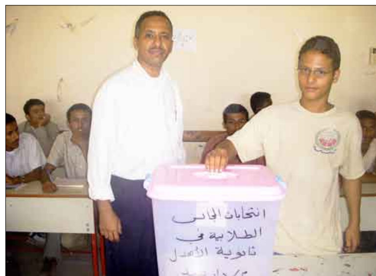
■ الرقببي يحث الطلاب على الانتخاب بنزاهة تامة