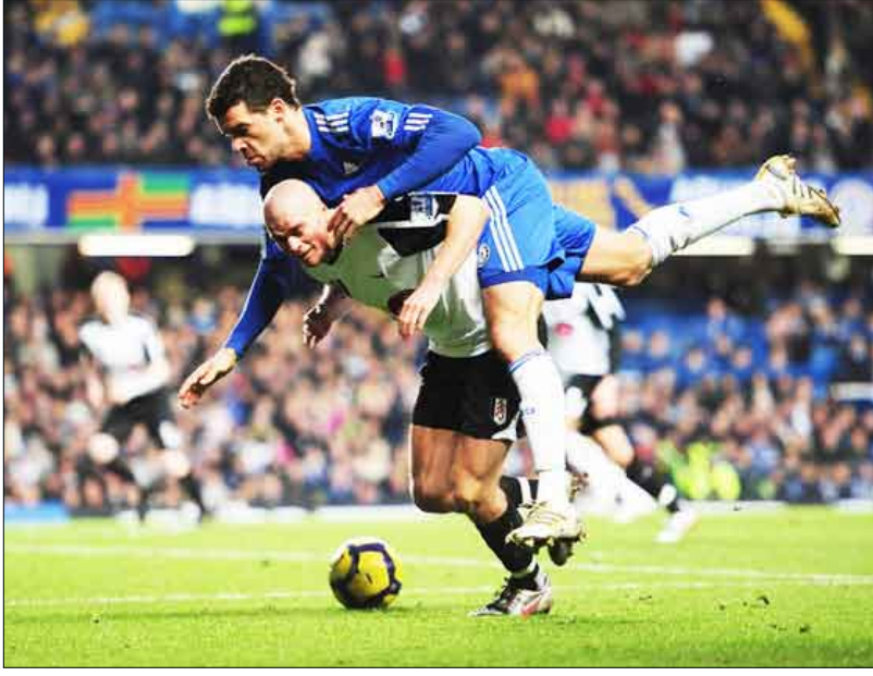
لقطة طريفة للالماني بالاك من تشلسي على ظهر أحد لاعبي فولهام