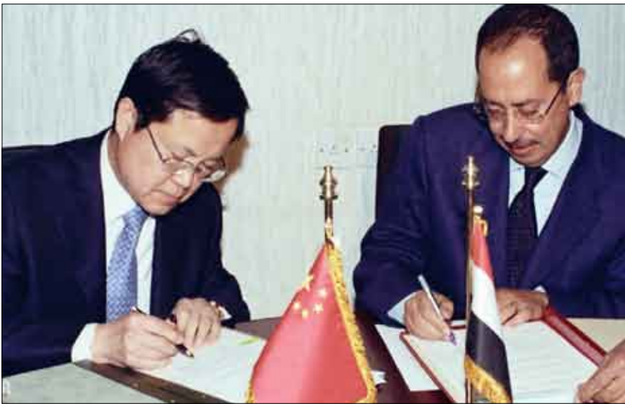
الارحبي خلال التوقيع على اتفاقيات تعاون بين بلادنا والصين

إطار الجهود المشتركة اليمنية - بصنعاء حرص القيادة والحكومة الصينية لترجمة مقررات ونتائج زيارة فخامة رئيس الجمهورية إلى الصين وكذا زيارة نائب الرئيس الصيني إلى اليمن. ولفت إلى أنه سيتم خلال العام القادم البدء بتنفيذ عدد من المشاريع التي تم التوقيع على اتفاقياتها خلال زيارة نائب الرئيس الصيني إلى اليمن حيث سيتم تنفيذ مشروع مستشفى 48 بصنعاء الذي يمثل رمز التنمية اليمنية - الصينية بداية 2010م والذي ستتكفل الحكومة الصينية بتمويل تنفيذه وتجهيزه.