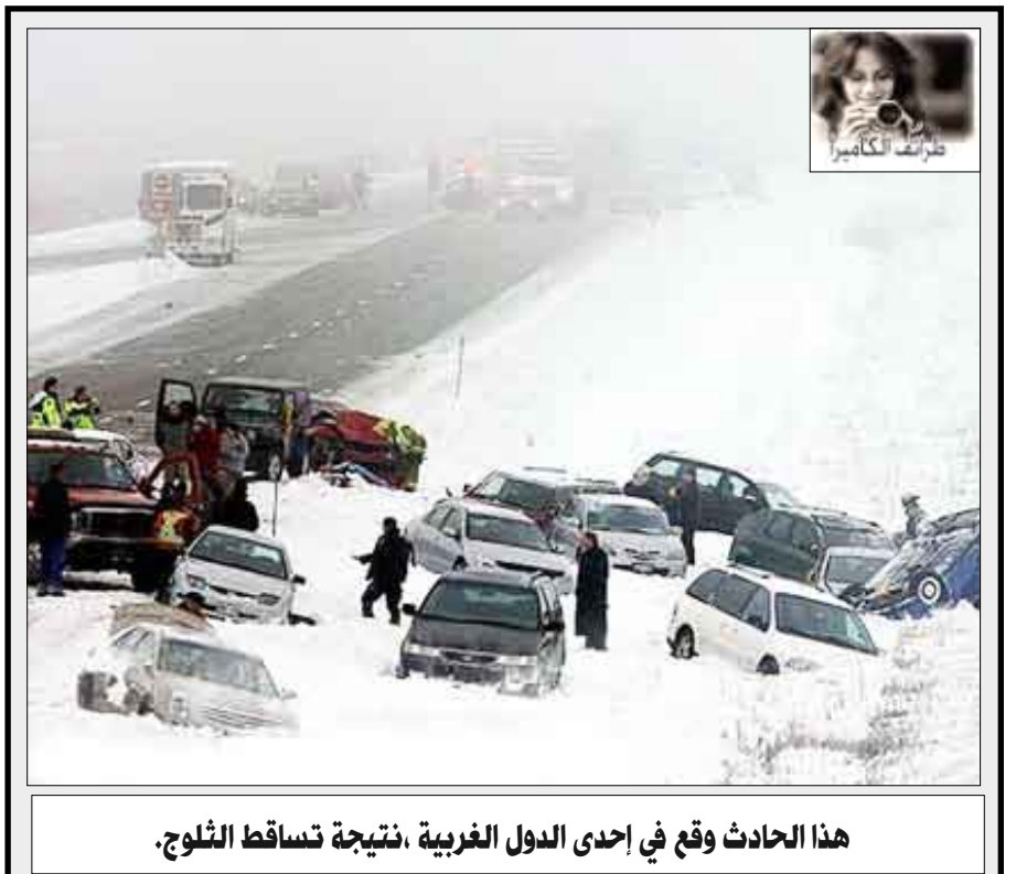
هذا الحادث وقع في إحدى الدول الغربية، نتيجة تساقط الثلوج.