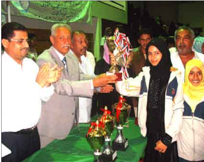
تكريم احدى اللاعبات الفائزات في كرة الطاولة