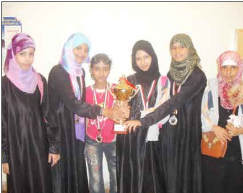
عن المركز الثاني في كرة الطاولة