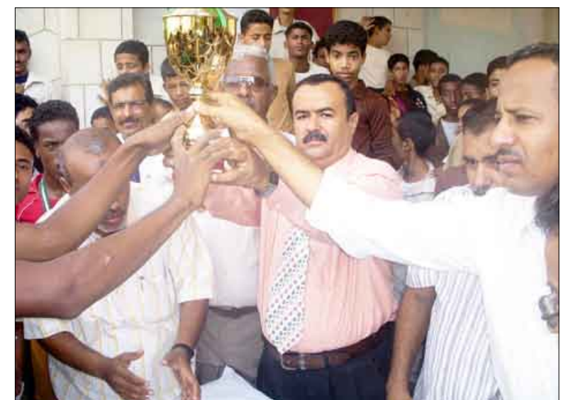
■ قيادتا السلطة المحلية والتربية تكرمان الفريق الفائز ببطولة يوم العمل الإبداعي