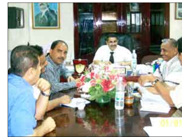
اجتماع قيادتي مديرية التواهي ومكتب الصناعة بالمديرية

لضبط المخالفين والمتلاعبين بالأسعار، والتواصل مع الجهات ذات العلاقة بالمديرية لتسهيل مهام عمل المكتب.