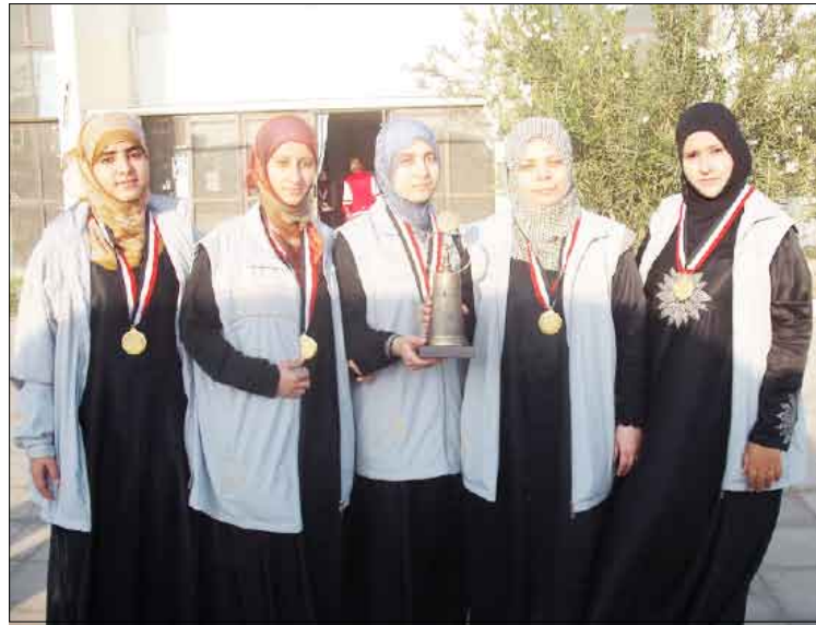
فتيات كمران البطال