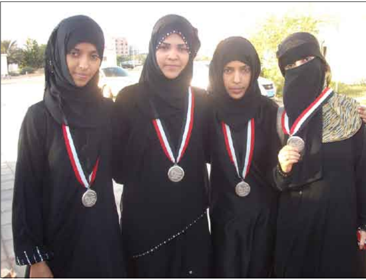
فتيات الشعلة صاحب المركز الثاني