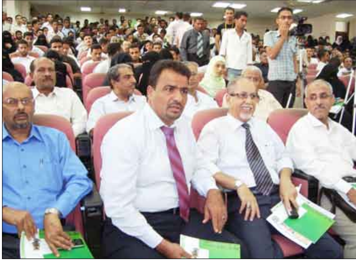
■ جانب من الحضور