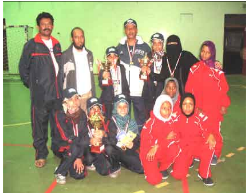
مركز تعز بطل كرة الطاولة