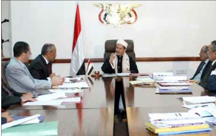
اجتماع مجلس القضاء الأعلى أمس

القضائي التي تنظم سلوك أعضاء السلطة القضائية بما يليق بشرف مهنة القضاء وقديستها وثقة المجتمع فيها.