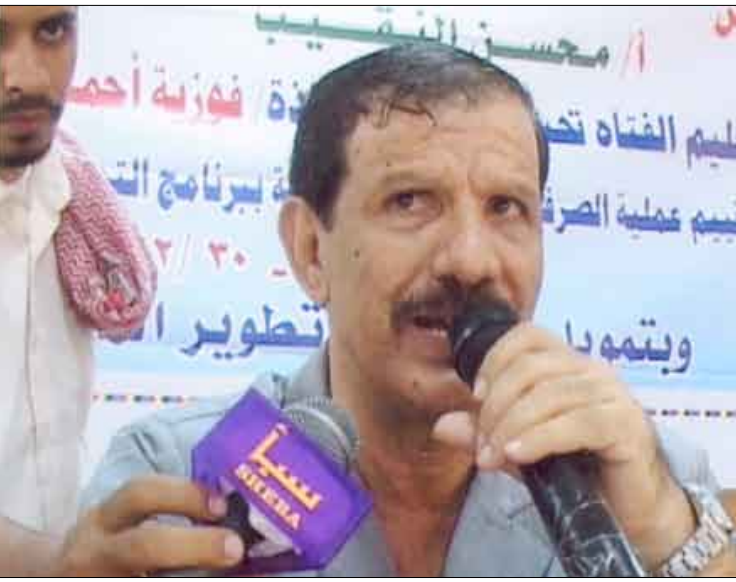
محافظ لحج في الورشة التقييمية لتحسين مشروع تطوير التعليم الاساسي