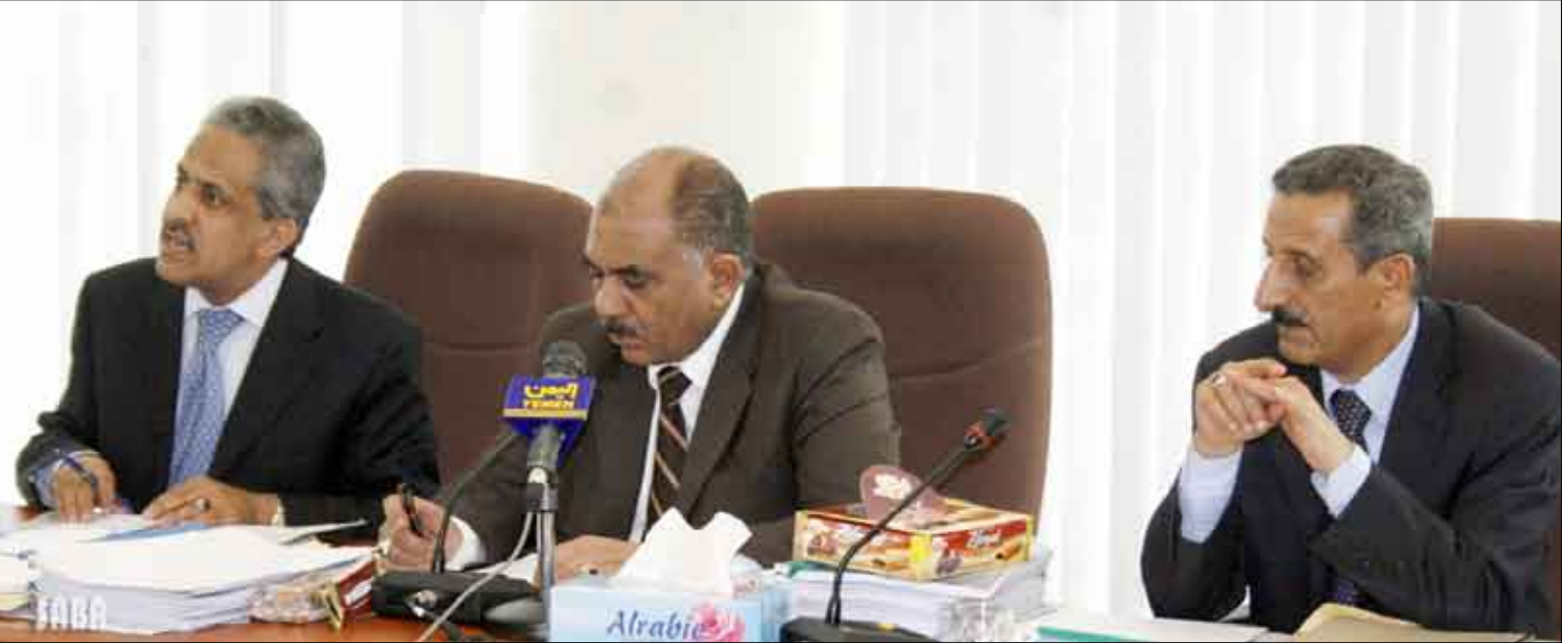
وزير الإعلام يترأس اختتام أعمال الدورة الاعتيادية للجنة التخطيط البرامجي

وكانت اللجنة وقفت في أعمال الدورة على مدى ثلاثة أيام أمام تقييم الأداء البرامجي للقنوات الفضائية والإذاعات الوطنية والمحلية للعام 2009م بما فيها الدورة البرمجية الأخيرة (سبتمبر - ديسمبر 2009م) والدورة الرضائية والخطة البرمجية للعام الجديد 2010م انطلاقاً من الوثائق الأساسية وفي مقدمتها السياسة الإعلامية والبرنامج الانتخابي لرئيس الجمهورية وبرنامج الحكومة والأولويات العشر التي وجه بها رئيس الجمهورية والخطة الإنمائية الخمسية الثالثة والقرارات المتصلة بها والخطة الفكرية والسياسية لمواجهة فتنة التمرد والإرهاب والغلو والتطرف والنعرات العنصرية والطائفية وهي الوثائق التي تعتبر المنطلق الأساسي لكافة أعمال وبرامج القنوات الفضائية والإذاعات الوطنية والمحلية.