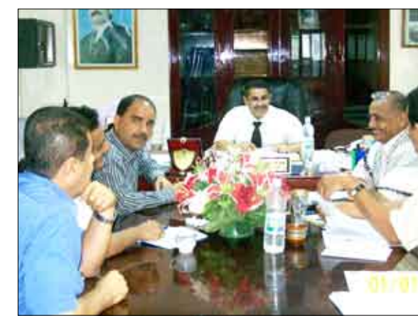
اجتماع قيادتي مديرية التواهي ومكتب الصناعة بالمديرية