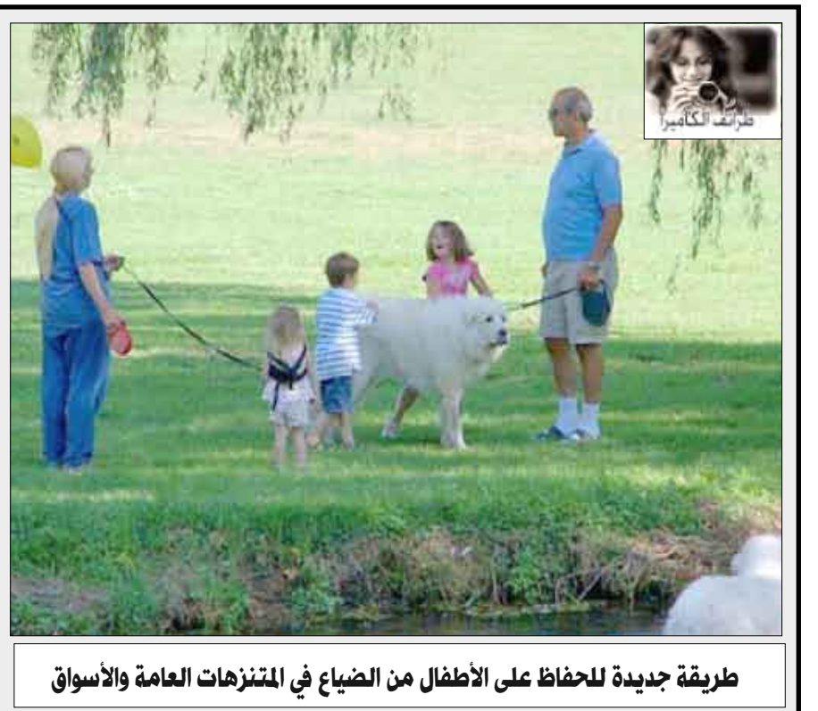
طريقة جديدة للحفاظ على الأطفال من الضياع في المتنزهات العامة والأسواق