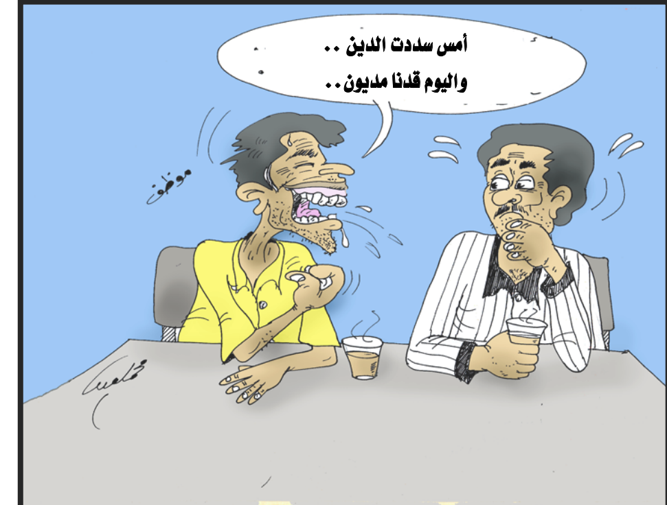
أمس سددت الدين .. واليوم قدنا مديون ..