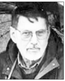
الأمريكي / روبرت كريلي

الحياة نعيشها ولم يكن يوما من حياة غيرها. الباب أمامه شارع تماما كما في الأمس سنوات وأموات، سيأتي غيري ربما ليفتحه، ويلقي نظرة على الرابض هناك حتى وإن لم يكن هناك شيء أو لم يكن يوما، أو ضاع بطريقة أو أخرى لا نيامس، أبق على إصرارك، كن واقفا. الحلم كل ما نمك مهما بدا لك العالم