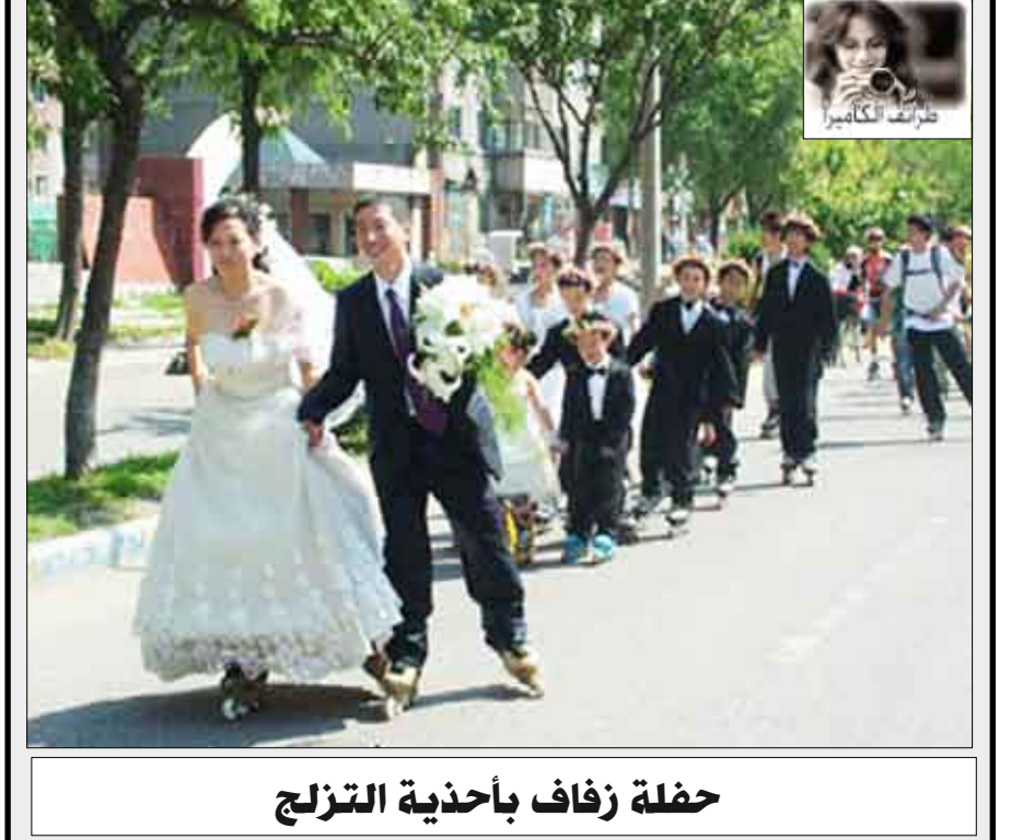
حفلة زفاف بأحذية التزلج