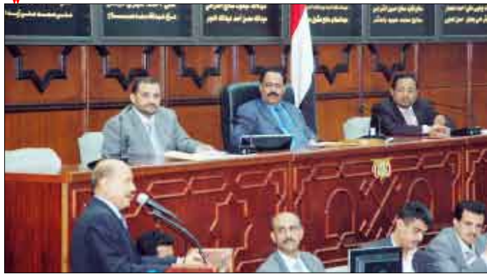
جلسة مجلس النواب أمس

استكمل مجلس النواب في جلسته المنعقدة أمس برئاسة رئيس المجلس يحيى علي الراعي مناقشته لمشروع قانون بتعديل بعض مواد القانون رقم (40) لسنة 2002م بشأن المرافعات والتنفيذ المدني وذلك في ضوء تقرير لجنة العدل والأوقاف. وقد بينت تعديلات المجلس على مشروع القانون أنه لا يجوز للقاضي أن يحكم بعد انتهاء ولايته