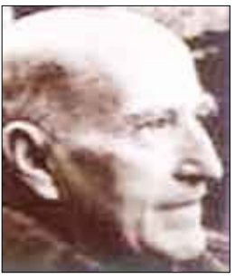
الشاعر الإسباني / بيثنت ألكاسندر

ماذا تنتظر بعد الكلمات الميتة، الكلمات التي مازالت تُلْفِظ من الأوراق المبعثرة. من يدري؟ كلمات خربة، مثل صدى أو ضوء يموت هناك في ليل عظيم. كنت أكثر تماسكا، ديمومة، ليس لأني قبلتك أو لأني أمسكت بالوجود راسخاً فيك. بل لأني كالباحر يغوص خائفاً بعد أن يغزو الرمل.