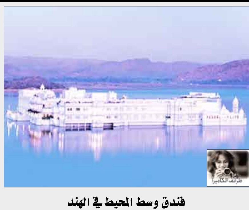
فندق وسط المحيط في الهند