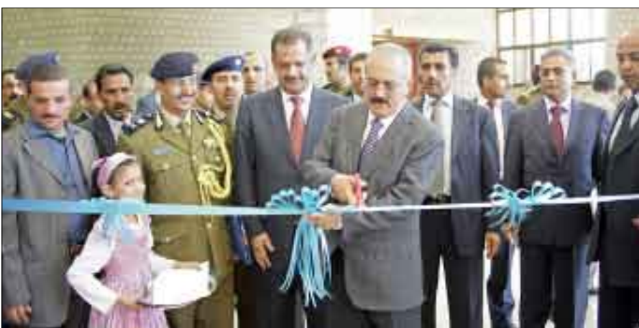
.. ويفتح احد اقسام الكلية