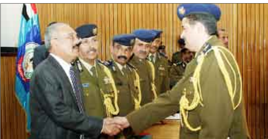
رئيس الجمهورية يكرم أحد الخريجين

صنعاء / سيا: حضر فخامة الأخ الرئيس علي عبدالله صالح رئيس الجمهورية أمس بكلية الشرطة حفل تخرج الدفعة الـ 21 من حملة الماجستير في علوم الشرطة وعدد من الدورات التدريبية في أكاديمية الشرطة . وفي الحفل القى رئيس مجلس الوزراء الدكتور علي محمد مجور كلمة وصف فيها دعوة فخامة رئيس الجمهورية إلى الحوار بأنها تعبر عن إيمان عميق بنهج الحوار .. معرباً عن أمه في أن تؤسس لمرحلة جديدة من التعامل مع قضايا الوطن . وأوضح رئيس الوزراء أن المعطيات الميدانية لسير المعارك في صعدة تشير إلى تطورات نوعية في مستوى التعامل مع تلك العناصر الإجرامية .. وفي تصديق الخناق عليها .. ودفعها إلى الاستسلام.. لافتاً إلى أن ذلك مؤشر على كفاءة القوات المسلحة والأمن .. مضيفاً « إن أبناء القوات المسلحة- لا شك- أكثر وعياً بمستوى التعامل مع مختلف التحديات التي تفرضها التعقيدات الآتية من تطور الجريمة .. والذين يقفون وراءها ، من حيث أن الجريمة لم تعد ترتبط بدوافع ذاتية.. بل أصبح لها امتدادات خطيرة تتجاوز حدود استهداف الأفراد إلى استهداف المجتمع والوطن بكامله ، وهذا بالتحديد ما تعكسه أعمال عنصرية الإحرام والتهمرد والتخريب الإرهابية في صعدة .. والعناصر التخريبية المنضوية تحت ما يسمى بالحرak الجنوبي» .. مؤكداً أن هؤلاء يقومون بمغامرة غير محسوبة .. مغامرة يائسة .. تنتهي عند أقدام هذا الشعب المؤمن بوحدته .. وبنظامه الجمهوري الديمقراطي التعددي.