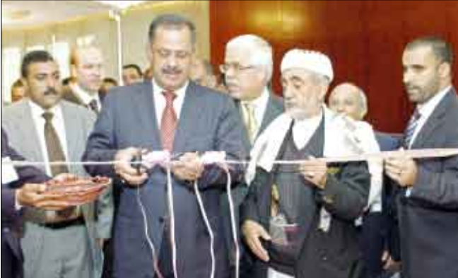
د. مجور أثناء افتتاحه الندوة أمس

صنعاء / سيا: أشاد رئيس مجلس الوزراء الدكتور علي محمد مجور بالشراكة المثمرة بين المركز الوطني للوثائق الإسلامية ومركز الأبحاث للتاريخ والفنون والثقافة الإسلامية (أرييسكا) في استنبول مشيداً بالجهود التي بذل في إطار هذه الشراكة من أجل إقامة ندوة «اليمن في العهد العثماني» التي انطلقت أعمالها أمس بمشاركة أكثر من عشرين باحثاً يمينياً وتركياً . وأكد في افتتاح الندوة التي تستمر يومين أن الإنشاد إلى التاريخ باعتباره ماضياً لا يكون إيجابياً إلا حينما نعمل منه مصدر إلهام لإرادتنا الحاضرة في بناء جسور الأخوة والتعاون والمصالحة المشتركة مع الشعوب الشقيقة والصديقة . وعبر عن تقدير اليمن البالغ لتركيا وسياساتها ومواقفها المبدئية المشرفة تجاه قضايا أمنا. << 4