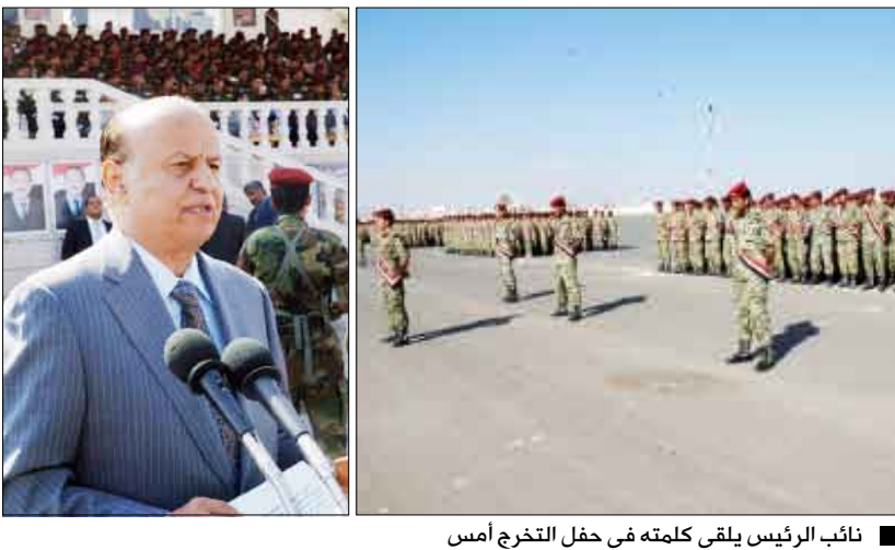
نائب الرئيس يلقي كلمته في حفل التخرج أمس

صنعاء / سيا: أقيم أمس بمدرسة الحرس الجمهوري احتفال بمناسبة تخرج عدد من الدورات والدفع التخصصية بحضور الأخ عبدربه منصور هادي نائب رئيس الجمهورية ووزير الدفاع اللواء الركن محمد ناصر أحمد وقائد الحرس الجمهوري قائد القوات الخاصة العميد الركن أحمد علي عبدالله صالح ونائب رئيس هيئة الأركان العامة لشؤون التدريب والمنشآت التعليمية اللواء الركن علي سعيد عبيد . وفي الحفل الذي بدأ باي من الذكر الحكيم القى الأخ نائب رئيس الجمهورية كلمة أكد فيها أن شعبنا اليمني اليوم وقواته المسلحة والأمن أكثر استعداداً للتضحية من أجل الحفاظ على هذه الثوابت الوطنية وتقديم الغالي والنفيس مهما كان الثمن . وقال: « إن على من تضررت مصالحهم الأناثية سواءً بقيام الثورة، أو بتحقيق الوحدة وبدؤوا بفرز زون سمومهم ويعبرون عن حقدهم المفين على الوطن والوطن والجمهورية والوحدة أن يدركوا أنهم يسبحون عكس التيار وأنهم سيندمون في وقت لا ينفع فيه الندم، لأن المسيرة تستتاجهم».