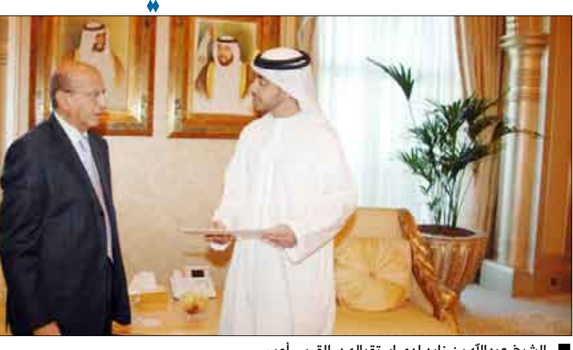
الشيخ عبدالله بن زايد لدى استقباله د. القري أمس

أبوظبي / سيا: سلم وزير الخارجية الدكتور أبو بكر عبد الله القري أمس وزير خارجية دولة الإمارات العربية المتحدة سمو الشيخ عبد الله بن زايد آل نهيان رسالة من فخامة الأخ الرئيس علي عبدالله صالح رئيس الجمهورية إلى سمو الشيخ خليفة بن زايد آل نهيان رئيس دولة الإمارات العربية المتحدة . وعلمت وكالة الأنباء اليمنية سبأ أن الرسالة تتضمن الشكر والتقدير لدولة الإمارات ورئيس الدولة على دعمهما لليمن في كافة المجالات وخاصة المنحة التي قدمتها الإمارات في مؤتمر المانحين وكذا منحة بناء المساكن للمتضررين من كارثة السيول بمحافظة حضرموت والمهرة.