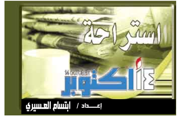
إعداد / إنشام العسيري

واشنطن / متابعات : أعلنت وكالة الفضاء الأميركية «ناسا» عن إطلاق موقع الكتروني مخصص للمراهقين يمكنهم من الولوج إلى بيانات المركبات الفضائية التابعة لها لمساعدتهم في المشاريع المدرسية. وقال المسؤولون في الوكالة إن الموقع الإلكتروني يمكن التلاميذ من إجراء تجارب حقيقية مع علماء من الناسا ويساعدتهم في الحصول على تدريب في الوكالة خلال الصيف. وقالت روث نيتينج، مديرة التعليم والنشاطات الخارجية «سيمكّن هذا الموقع المراهقين الذين يتمتعون بلغة وأسلوب فريدين من الحصول على المعلومات بشكل أسرع والاستمتاع بالوقت عينه»، وأضافت «تقدم