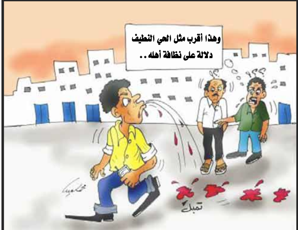
وهذا أقرب مثل الهي التنظيف دلالة على نظافة أهله ..

باختصار صنعاء المسعودي انتقدنا الجهات المسؤولة عن النظافة، ومازلنا بين الحين والآخر نوجه إليها إضاءات نقدية بقصد مشاركتهم في تجاوز القصور من وجهة نظر عامة المواطنين لا بقصد التهام أو إلغاء الجهود الواضحة للبيان في أكثر من مكان ومناسبة. لكننا اليوم نود أن نوجه إشارات نقدية لأولئك الذين يسئون بجهود النظافة وتحسين صورة عدن عروس المداين اليمنية ونخص بالذكر من يتعاطون التمثيل، الشمة، القات وغيرها من الأوقات المضرة بصحة الفرد والمجتمع. ويأتي ضررهم مع سبق الإصرار من خلال سحق مخلفات (لقوهم) على قارة الطريق من دون أدنى خجل فما هو الحل إذًا!! في رأي الشخصي يكمن الحل في تفعيل جهود أفراد شرطة البيئة، وجمع تشكيلات الشرطة بتخصصاتها المختلفة بضبط أولئك النفر، ويكون واقع الأمر يفرض غرامة فورية قدرها على سبيل المثال مبلغ (500) ريال تدفع بسند قبض صادر من صندوق النظافة وإمساك الحضر المخالف إلى قسم الشرطة، على أن تتضاعف قيمة الغرامة ولا مانع من أن يحصل من قام بضبط المخالف على نسبة حتى لو كانت 50% من قيمة المخالفة كحافز له وللآخرين (وشوفوا عند كيف بانرجع)