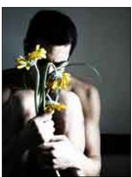
الشاعر الهندي / كومار سين

وطني ليست الأرض وطني ولا السماء ولا البحار ولا الكواكب ولا الشموس ولا المجرات الظاهرة والمستترة وطني جسدي الذي يضم هذه المظاهر كلها المظاهر التي بعين واحدة مني تكون موجودة .. أو لا تكون !