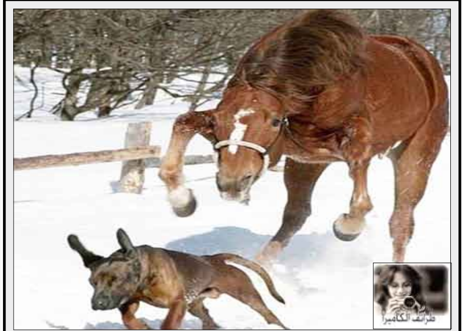
حصان يحاول تلقين الذئب درساً