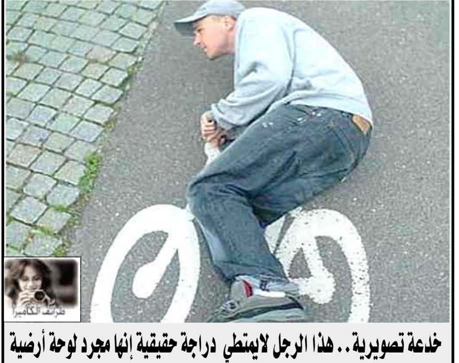
خداعة تصويرية.. هذا الرجل لا يمتطي دراجة حقيقية إنما مجرد لوحة أرضية

إعداد / اشواق صالح ناجي أفقياً 1. الاتفاقية العامة للتعريفات الجمركية والتجارية تأسست فعليا عام 1948م من أجل وضع قواعد عامة وثابتة للتجارة الدولية والعمل على تخفيض التعريفات الجمركية وتبسيطها ومنع رفعها مرة أخرى وفي 1 يناير 1995م أصبحت منظمة WTO منظمة رسمية باسم منظمة التجارة العالمية. 2. صوت الجرس - حرف أبجدي. 3. بلد عربي - متحسر. 4. اله الشمس عند المصيرين القدماء - اله موسيقية - وكالة أنباء عربية. 5. حين - أحرف مكررة - اسم إشارة. 6. من سور القران الكريم - بحر. 7. يقترب - أداة حصر. 8. ضمير - مطلب ومقصد - عقل. 9. حرف موسيقي - صوت الضفدع. 10. تحالف ألماني إيطالي 1936م انظم اليه حلفاء الدولتين في الحرب العالمية الثانية - عاصمة عربية. 11. أهم أنهر أفريقيا الغربية - إشارة أوام. 12. جمال - أخو الأم - فاصل. عمودياً : 1. مخترع الكلمات المتقاطعة عام 1913م - ضمير.