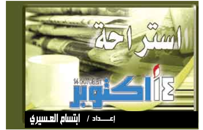
إعداد / إنشام العسيري

تندن / مناجيات : أكدت دراسة أجراها علماء بقسم علم النفس في جامعة سينسيناتي أن عصير العنب الأحمر لديه القدرة على تقوية الذاكرة إذ أظهر فعالية في تقليص فقدانها. وذكرت صحيفة "دايلي ميل" البريطانية أن الدراسة شملت 12 شخصاً بين الـ75 و80 من العمر يعانون من بداية فقدان الذاكرة واثبتت أن أداء من شربوا نوعية جيدة من عصير العنب الأحمر طوال 12 أسبوعاً تحسن عند القيام بسلسلة من الاختبارات العقلية. ورجح العلماء أن المواد المضادة للتأكسد الموجودة في قشرة وعصير العنب هي التي تفيد الذاكرة، وعمد العلماء إلى تقسيم الأشخاص الـ12 إلى مجموعتين: الأولى