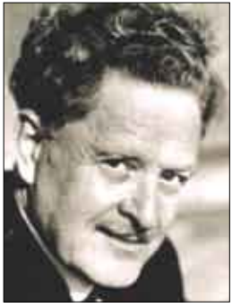
الشاعر / ناظم حكمت