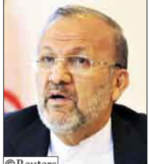
منوشهر منكي وزير خارجية إيران

قال منوشهر منكي وزير خارجية إيران يوم أمس إن بلاده تحتاج لما يصل إلى 15 محطة نووية لتوليد الكهرباء مما يبرز تصميم طهران على المضي قدماً في برنامج يشبهه الغرب أنه يهدف إلى تصنيع قنابل. وأمام مؤتمر أممي في البحرين أثار منكي مزيداً من الشكوك حول اتفاق لوقود النووي وضعت الأمم المتحدة مسودته ويهدف إلى تهدئة المخاوف الدولية بشأن الطموحات النووية للجمهورية الإسلامية. وأضاف أولاً اعتقد أننا كان يمكن أن نخشى عن المسألة برمتها أو نقترح شيئاً أكثر اعتدالاً. حل وسط نوعاً ما... إيران فعلت هذا. وكانت إيران سعت إلى إدخال تعديلات أساسية على الاتفاق المقترح الذي ترسل بموجبيه جزءاً كبيراً من مخزونها من اليورانيوم منخفض التخصيب وتتسلم في المقابل وقوداً لمفاعل الأبحاث الطبية. وتقول طهران أنها تستطيع إنتاج الوقود بنفسها إذا لم تستطع الحصول عليه من الخارج. ويهدف اقتراح إيران معطم احتياطيها من الوقود منخفض التخصيب للخارج إلى تقليل خطر تقيقة البلاد المادة إلى درجة ما بين 90 و80 بالمائة اللازمة لإنتاج أسلحة. وتقول إيران إن برنامجها النووي يهدف إلى توليد الكهرباء حتى تستطيع تصدير مزيد من الغاز والنفط.