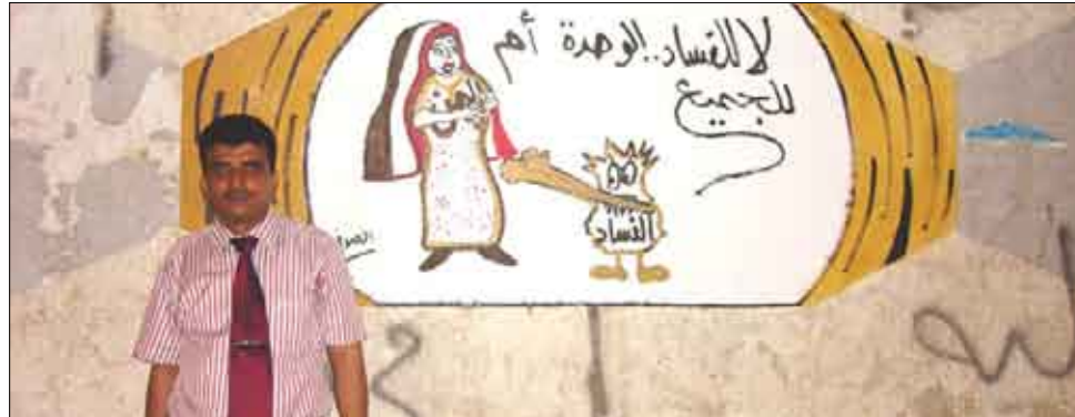
شباب عدن يعبرون عن حبهم للوحدة اليمنية في فعالية الأيام التعبيرية للشباب في عدن ، الرسمه للازميل الصحفي محمد الصوفي على حائط مدرسة حاتم بعدن يوم أمس

□ عدن / عبدالرحمن أنيس : نظمت الوحدة الشبابية في جمعيتي أجيال الغد والامل التنموية يوم أمس فعاليات برنامج الأيام التعبيرية والرسم الحر للشباب بعدن . وشارك حوالي عشرين شاباً وشابية في التعبير عن أنفسهم عن طريق الرسم الحر على حائطي مدرستي حاتم والثلاثين من نوفمبر بمديرية الشيخ عثمان ، في طريقة مبتكرة لإعطاء الشباب الفرصة في التعبير عن آرائهم تجاه مختلف القضايا بمشاركة عدد من الهواة والمحترفين والمبتدئين . برنامج الأيام التعبيرية للشباب والذي يأتي بدعم وتمويل من المنظمة السودبية لرعاية الأطفال - برنامج