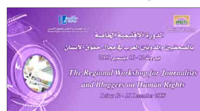
شعار الدورة الإقليمية الخاصة بالصحفيين والمدونين العرب

بهم ، وستشكل لجنة لمرجعة وتقييم المشاريع واختيار أفضل عشرة مشاريع تم تقديمها من أجل تكريمها .