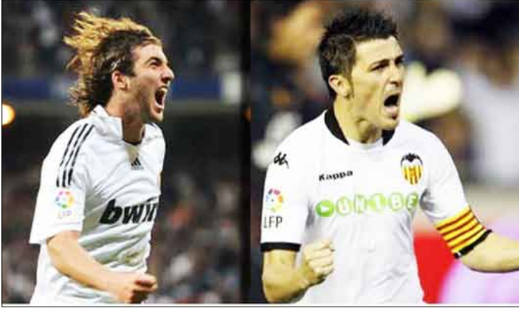
بيا و هيچوين