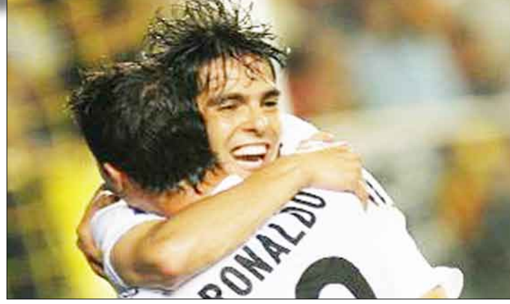
ريال مدريد يفتقد جهود كاكا للإصابة ورونالدو للإيقاف

أقل تقدير، ما سيفتح الباب أمام ريال مدريد لتقليص الفارق الذي يفصله عن برشلونة في حال خرج بدوره فائزاً من ملعب «ميسيتايا».