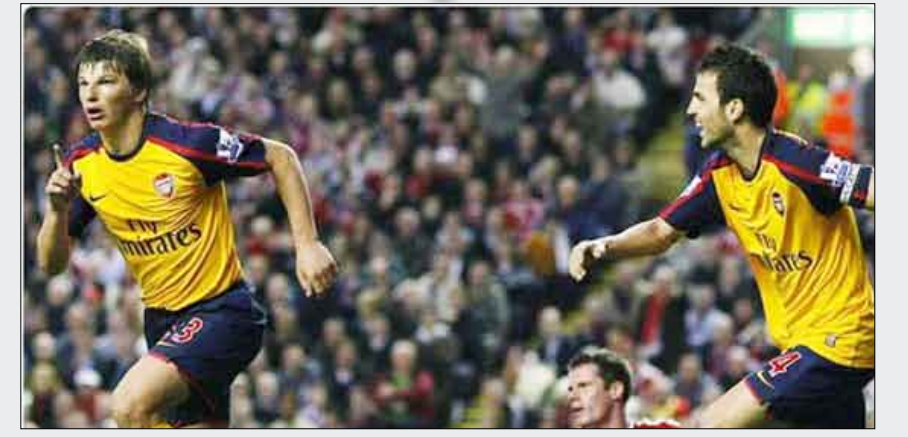
فرحة لاعبي الأرسنال من الأرشيف