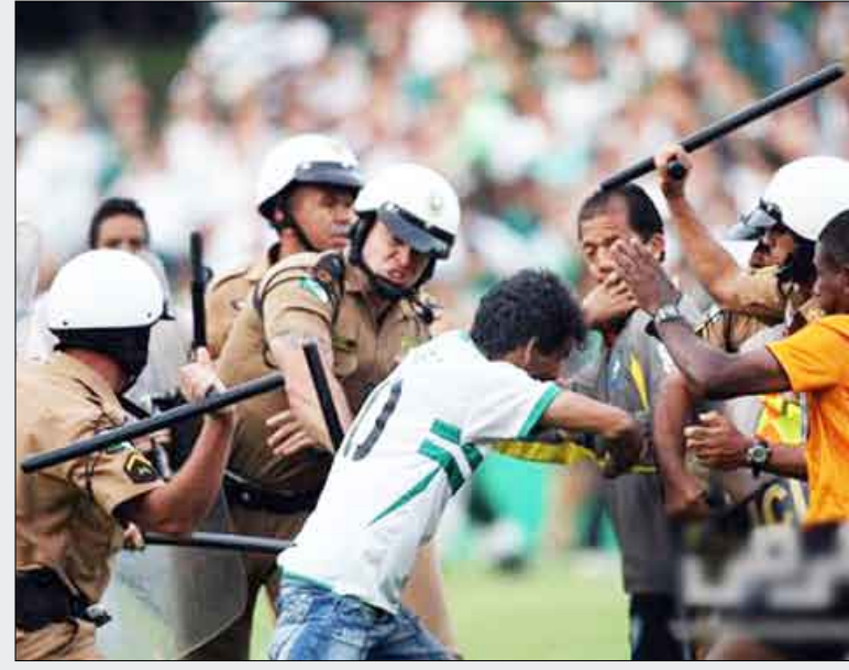
من أعمال الشغب في استاد كوتو بيريرا