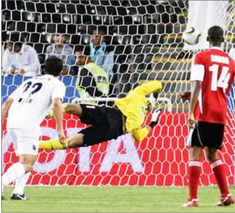
الهدف النيوزيلندي الثاني في مرمر أهلي دبي