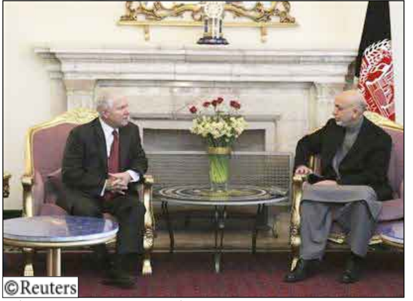
روبرت جيتس إلى اليسار أثناء محادثته مع الرئيس الأفغاني حامد كرزاي في قصر الرئاسة بكاكول أمس

القابول 14 أكتوبر/ رويترز: وبيتس هو أبرز مسؤول أمريكي يزور أفغانستان منذ أن أوامها الأسبوع الماضي أنه سيرسل 30 ألف جندي إضافي للعلم العام قبل بدء الانسحاب في منتصف 2011. وتنقد جيتس يوم أمس مقراً جديداً لقيادة قوات حلف شمال الأطلسي العقائدية في أفغانستان. وأقيم المؤتمر الذي تقوده الولايات المتحدة في مجمع متراهي الأطراف بكاكول. وأنشئ المقر في إطار إعادة هيكلة أجهزها الجنرال ستانلي مكرسيستال قائد القوات الأمريكية وقوات حلف شمال الأطلسي في أفغانستان في مسعى لأن تكون القيادة مركزية بعد أن كانت مقسمة بين الحلفاء في حلف الأطلسي.