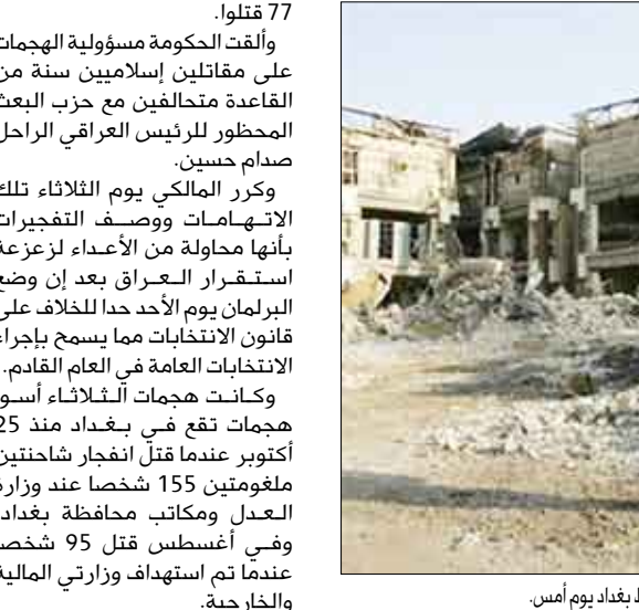
شرطي عراقي يمشط موقع هجوم بقنبلة وسط بغداد يوم أمس.

قال مسؤولون عراقيون إن عدد القتلى في التفجيرات التي وقعت يوم الثلاثاء أقل مما أعلن عنه من قبل ونكروا إن 77 قتلوا في الهجمات التي استهدفت فيما يبدو إضعاف موقف رئيس الوزراء نوري المالكي قبل الانتخابات القادمة التي تجري في مارس. وأضافت مصادر عدة للشرطة إن 112 شخصاً قتلوا وأصيب 425 في انفجار ما لا يقل عن أربع سيارات ملغومة في العاصمة العراقية بغداد. واستهدفت الهجمات محكمة ومركزاً للتدريب للقضاء ومبنى مؤقتاً تستخدمه وزارة المالية بعد أن تضرر مبناها أصلاً في هجوم سابق ونقطة تفتيش تابعة للشرطة. وتحدثت وسائل إعلام دولية ومحلية نقلت أيضاً عن مصادر شرطة مماثلة عن مقتل 127 شخصاً. واستهدفت هذه التفجيرات فيما يبدو تقويض ما تقوله حكومة المالكي من أنها أشادت الأمن في البلاد قبل انتخابات عامة أعلن يوم الثلاثاء أنها ستجري في السابع من