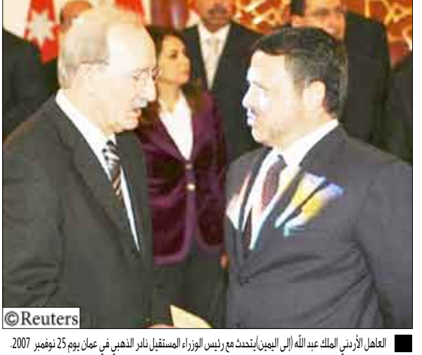
العاهل الأردني الملك عبد الله (إلى اليمين) يتحدث مع رئيس الوزراء المستقيل نادر الذهبي في عمان يوم 25 نوفمبر 2007.

مفاجئة اتخذها الملك عبد الله الشهر الماضي بحل البرلمان في منتصف منته بعد فشل الحكومة في تنفيذ قوانين من شأنها جذب المستثمرين وكبح الاتفاق لتحقيق النمو. ويضع الدستور معظم السلطات في يد الملك الذي يعين حكومات ويوافق على التشريعات ويوسعه حل البرلمان. وكان الملك قد عين الذهبي رئيساً للوزراء في نوفمبر تشرين الثاني 2007. والذهبي قائد سابق للقوات الجوية وقد تحولت في عهده المنطقة الاقتصادية الخاصة في ميناء العقبة المطلة على البحر الأحمر إلى جنة استقطبت استثمارات بمليارات الدولارات. ويواجه الأردن إكهاماتاً اقتصادية بعد سنوات من النمو القوي. ومما أسهم في الازدهار تدفق الاستثمارات الأجنبية المباشرة بما فيها تحويلات شريحة كبيرة من العاملين في منطقة الخليج. ورجح المسؤولون أن يواصل التشكيل الحكومي الجديد إصلاحات السوق الحرة التي يقول منتقدوها أنها تعيق الفقراء والأغنياء وأن يستمر في الدعم التقليدي لسياسات الولايات المتحدة في المنطقة. وأضافوا أن الملك سيحاول على اللوزي في كسب التأييد لإصلاحاته الاقتصادية والاجتماعية داخل المؤسسة المحافظة التي تمثل عصب قاعدة سلطته والتي تخشى أن يقوض الإسراع بالإصلاحات قبضتها على السلطة. وتقول المعارضة الإسلامية بالأردن وساسة مستقلون ولبيراليون إن الحكومات المتعاقبة فشلت في توفير مناخ سياسي أكثر تحملاً.