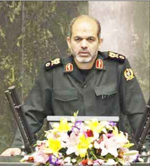
احمد وحيدى وزير الدفاع الإيراني يتحدث في البرلمان الإيراني بطهران في 14 سبتمبر 2009.

نقل عن احمد وحيدى وزير الدفاع الإيراني قوله يوم أمس إن طهران سترد بضرب مواقع تصنيع الأسلحة والمنشآت النووية الإسرائيلية إذا هاجمت الدولة اليهودية المنشآت النووية للجمهورية الإسلامية. ولم تستبعد إسرائيل العمل العسكري إذا فشلت الدبلوماسية في حل نزاع دولي بشأن برنامج إيران النووي الذي يشتهه الغرب أنه يهدف لتصنيع قنابل. وتنفي إيران الاتهام وحذرت دوماً أنها سترد إذا هوجمت. وذكرت وكالة مهر شبه الرسمية للإنباء أن وحيدى قال للصحفيين خلال زيارة لسوريا حين سئل عن أي ضربة إسرائيلية محتملة للمواقع الإيرانية المسلحة مستعدة تماماً. وأضاف أنه إذا هاجمت إسرائيل فسيكون أول رد لإيران هو استهداف عدة مواقع لتصنيع الأسلحة بما في ذلك الأسلحة الغدزة ومراكز نووية غير تقليدية. ويعتقد إن إسرائيل هي الدولة النووية