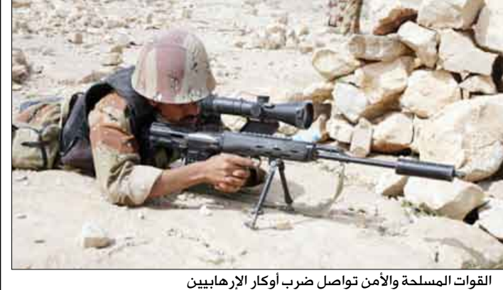
القوات المسلحة والأمن تواصل ضرب أوكار الإرهابيين

صنعاء / سبأ: نفذ تسور الجو ضربات دقيقة وموجعة لأوكار عصابات فتنة التخريب والتمرد التي يتزعمها الإرهابى عبده ناجي أبو رأس فى مديرية برط العنان بمحافظة الجوف. وقالت إدارة أمن المحافظة لمركز الإعلام الأمنى: إن قصف الأوكار الإرهابية كان دقيقاً وفعالاً، مؤكدة إن العشرات من العناصر الإرهابية قد قتل وأصيب من جراء القصف الذى أنصب بصورة دقيقة ومباشرة على الأوكار الإرهابية بمديرية برط العنان، موضحة إن الأجهزة الأمنية ألقت القبض على 5 من عناصر التخريب والإرهاب حاولت الفرار إلى مديرية الزاهر وهم: (1) ، غ ، المؤيد (2) ط ، غ ، المؤيد (3) ع ، ق ، الكيسى (4) م ، ع ، الشريف (5) ص ، م ، النجار. وأشارت إلى أن عملية القضاء على الأوكار الإرهابية بمحافظة الجوف مستمرة، وستواصل إلى أن يتم تطهير المحافظة من شرورهم وأفعالهم الإجرامية.