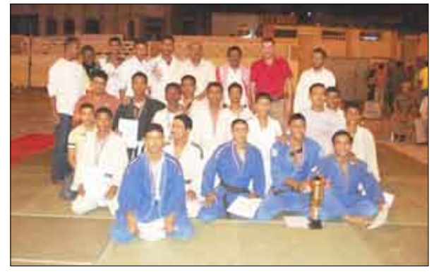
لقطة جماعية للفائزين في بطولة الجودو مع الوكيل المساعد لوزارة الشباب والرياضة