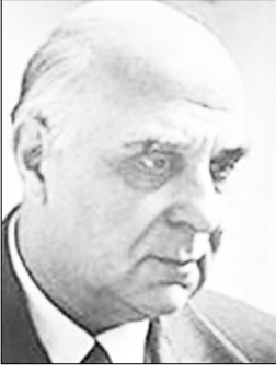
الشاعر اليوناني / سيفيريس

على ضفاف شاطئ خفي ، أبيض كحمامة ، عطشنا عند منتصف النهار ، ولكن الماء أجاج . فوق الرمال الشقراء .. كتبنا اسمها ، ما أروع الريح إذ هبت ، وانمحت الكتابة . بأي قلب ، بأية أنفاس ، بأي ألم ، بأي رغبة ، سلكنا درب حياتنا خطأً ، وغيرنا الحياة زهرة حمراء للريح والقدر ، تبقيين فقط .. إيقاعاً منقوشاً في الذاكرة .