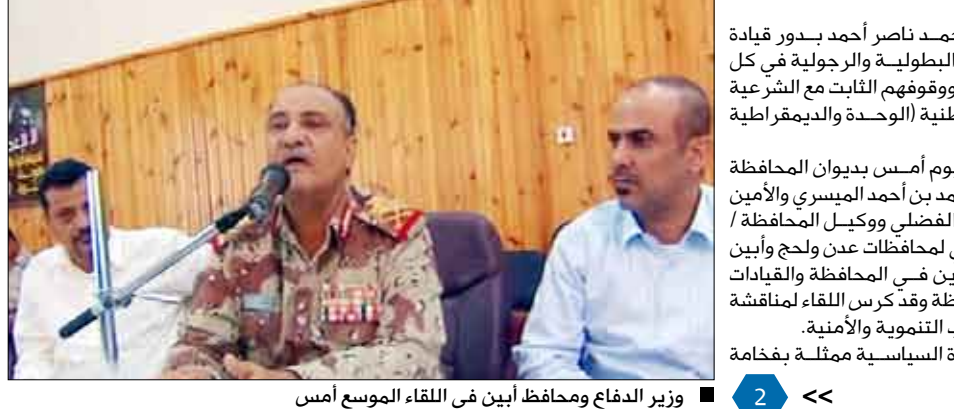
وزير الدفاع ومحافظ أبين فى اللقاء الموسع أمس

صنعاء / سبأ: حضر اللقاء الموسع الذى عقد يوم أمس بدوان المحافظة بحضور الإخوة محافظ أبين المهندس / أحمد بن أحمد الميسرى والأمين العام للمجلس المحلى / ناصر عبدالله الفضلى ووكيل المحافظة / محمد صالح هدران ووكيل الأمن السياسى لمحافظة عدن ولحج وأبين / ناصر منصور هادي والكلاء المساعدين فى المحافظة والقيادات التنفيذية والعسكرية والأمنية فى المحافظة وقد كرس اللقاء لمناقشة الأوضاع العامة فى المحافظة فى الجوانب التنموية والأمنية. وفى حديثه نقل الوزير تحيات القيادة السياسية مقبلة بفخامة الرئيس / علي عبدالله صالح والحكومة