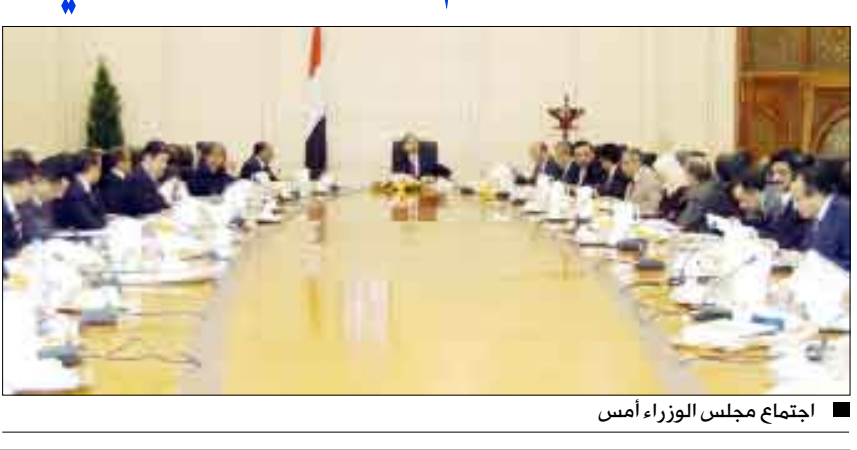
اجتماع مجلس الوزراء أمس

صنعاء / سبأ: أقر مجلس الوزراء فى اجتماعه الأسبوعي يوم أمس الثلاثاء برئاسة نائب رئيس الوزراء للشئون الاقتصادية وزير التخطيط والتعاون الدولى عبد الكريم الربحى تقرير المؤشرات الرئيسية لخطة التنمية الاقتصادية والاجتماعية الثالثة للتخفيف من الفقر والمقدمة من وزارة التخطيط والتعاون الدولى. وأدان المجلس بشدة حادثتي قطع الطريق العام وقتل المواطنين الأبرياء اللتين حدثتا الأسبوع الماضى فى محافظتي لحج وأبين.. وشدد بهذا الخصوص على وزارة الداخلية والسلطة المحلية فى المحافظات سرعة إلقاء القبض على مرتكبي الحادثتين