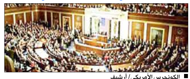
الكونجرس الأمريكى

صنعاء / سبأ: طالب الكونجرس الأمريكى الإدارة الأمريكية والمجتمع الدولى بتقديم الدعم والمساعدة لليمن بما يمكنه من مواجهة التحديات القائمة وتعزيز مسيرته التنموية. ودعا مجلس الشيوخ الأمريكى فى قرار أصدره مؤخراً وصوت عليه أغلبية أعضائه،