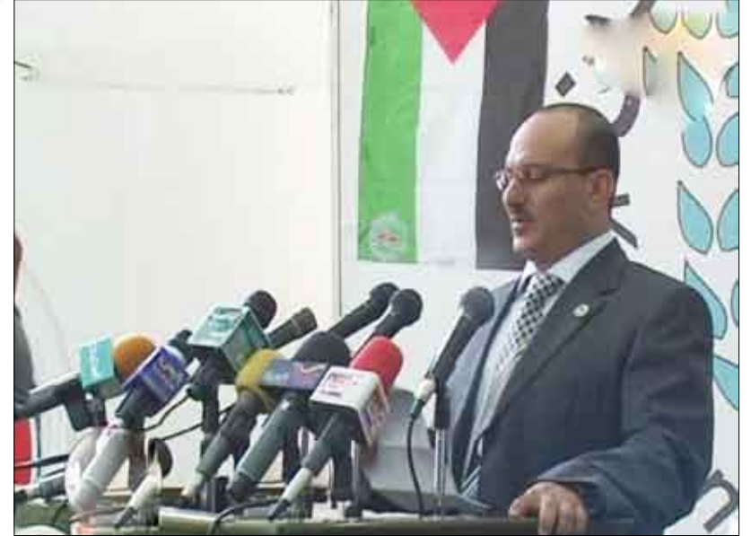
إحتفال في إب بمناسبة اليوم العالمي للتضامن مع الشعب الفلسطيني