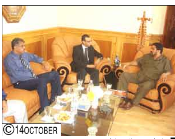
محافظ عدن مع القنصل المصري.