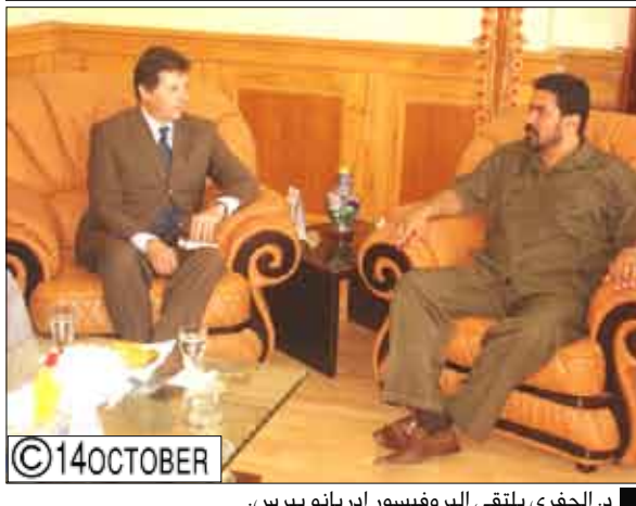
الجفري يلتقي البروفيسور ادريانو بيرس.

بالجالية المصرية المقيمة في عدن وتذليل كافة الصعوبات التي تواجهها. من جانبه أكد القنصل المصري أهمية توسيع آفاق التعاون المشترك في كافة المجالات والاستفادة من فرص الاستثمار المتوفرة في محافظة عدن في كافة الجوانب السياحية بالإضافة إلى تطوير التعاون بين جامعة عدن والجامعات المصرية.