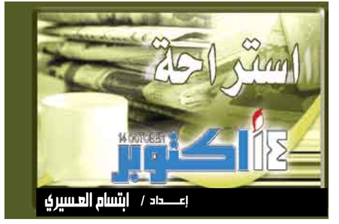
إعداد / إنشام العسيري

نوس الجيس / 14 أكتوبر / رويترز: فاجأ المخاض امرأة على متن طائرة تابعة لشركة «ساوث ويست إيرلاينز» ووضعت طفلاً على ارتفاع نحو 9100 متر فوق كولورادو بالولايات المتحدة يوم الجمعة في ولادة نادرة في الجو أثارت ابتهاج الركاب الآخرين. وقال المتحدث باسم الشركة كريس مينز لرويترز أن هذه الولادة والتي تمت بمساعدة طبيين تصادف وجودهما على متن الطائرة جرت بدون أي حركة جنب أو شد وان الطائرة وهي من طراز «بوينغ 737» هبطت بعد ذلك بوقت قصير في دنفر حيث كان في استقبال الأم والطفل طاقم طبي ونقلا إلى مستشفى. وقال مينز «اعتقد أن كل شيء جرى بشكل سلس للغاية وانهما يمضيان بشكل طبي». ولم يكشف عن اسم الأم. وقال مينز أنه لا يعرف عمر الأم أو ما إذا كان هذا الطفل هو الأول لها أو ما إذا كانت مسافرة بمفردها أم برفقة آخرين.