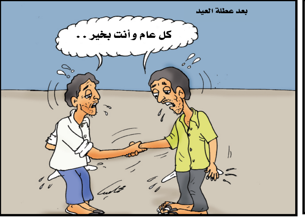
بعد عطلة العيد

تصوير وتعليق/ علي الدرب: الاعمال والمراجيح الموجودة في دار رعاية المعاقين في المنصورة م/ عدن في حالة يرثى لها حيث إن جميعها غير صالحة للاستخدام بعد أن تحطم أغلبها وما تبقى منها ليس سوى مخلفات نتمنى أن تقوم جهات الاختصاص بإزالة هذه الاعمال المكسرة واستبدالها بألعاب جديدة.