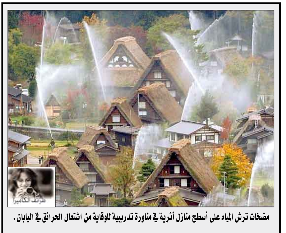
مضخات ترش المياه على أسطح منازل أثرية في مناورة تدريبية للوقاية من اشتعال الحرائق في اليابان.