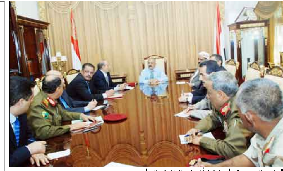
رئيس الجمهورية يرأس اجتماعاً لمجلس الدفاع الوطني أمس

■ صنعاء / سيا : تلقي فخامة الأخ الرئيس علي عبدالله صالح رئيس الجمهورية يوم أمس السبت رسالة من الممثل الأعلى للسياسة الخارجية والأمنية بمجلس الاتحاد الأوروبي خافيير سولانا. جاء فيها: فخامة الرئيس علي عبدالله صالح رئيس الجمهورية اليمنية يسرني أن اكتب إلى فخامتكم هذه الرسالة لأودعكم وأقدم لكم خالص شكري وتقديري لدعمكم وتعاونكم. لقد كان من دواعي سروري وشرفا لي أن عملت مع فخامتكم من أجل تطوير العلاقات الثنائية، حيث يعتبر الاتحاد الأوروبي شريكا رئيسيا لبلادكم. ومع دخول معاهدة لشبونة حيز التنفيذ فإننا في أوروبا قد أنشأنا قاعدة قوية التي على أساسها أصبح الاتحاد الأوروبي مؤهلا أكثر للعمل من أجل السلام والازدهار في العالم. جنباً إلى جنب فإني ساستمر في العمل لتحقيق ذلك الهدف.