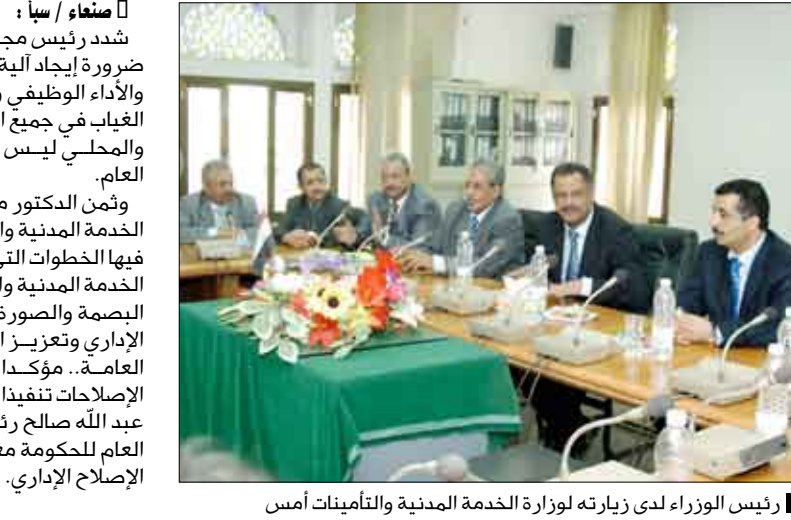
رئيس الوزراء لدى زيارته لوزارة الخدمة المدنية والتأمينات أمس