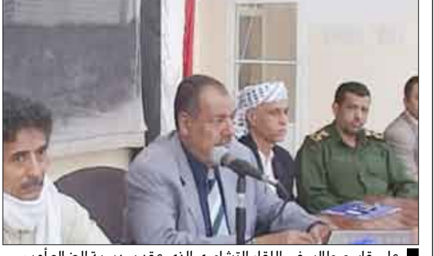
علي قاسم طالب في اللقاء التشاوري الذي عقد بمديرية الضالع أمس

■ الضالع / سيا : كرس اللقاء التشاوري الذي عقد بمديرية الضالع يوم أمس السبت، للوقوف أمام الاعتداءات والأعمال الإجرامية التي قامت بها عناصر خارجة على النظام والقانون مؤخراً بهدف إقلاق السكينة العامة وقطع الطرقات وترويع المواطنين الأمنيين. وناقش المشاركون في اللقاء الذي نظمته قيادة السلطة المحلية بمديرية الضالع تحت شعار "الأمن والاستقرار مسؤوليتنا جميعاً" بمشاركة قيادة وأعضاء السلطة المحلية بالمحافظة والمديرية والقيادات العسكرية والأمنية وممثلي منظمات المجتمع المدني والمشايخ والأعيان والعلماء وخطباء الجوامع والمثقفين والصحفيين عدداً من القضايا التي تهم أبناء المديرية وما تتطلبه عملية التنمية من تضافر جهود الجميع. وفي اللقاء أشار المحافظ علي قاسم طالب إلى ما تلحقه الأعمال الإجرامية التي تقوم بها عناصر خارجة على النظام والقانون من تعطيل وتعثر للعديد من المشاريع التنموية، وهو