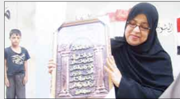
المديرة لحظة تكريمها من قبل التلاميذ