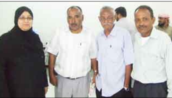
مديرة المدرسة مع كبار ضيوف يوم العمل الإبداعي

بهم. بعد ذلك سارت فعاليات يوم العمل الإبداعي من خلال الجمعيات العلمية والرياضية والثقافية والإبداعية التي أشرف عليها المعلمون والمعلمات وقد تضمنت مسابقات في تنس الطاولة والشطرنج والكيرم ومباريات رياضية وندرس قوية. كما قامت جمعية البيئة والحفاظ على الشجرة بتشجير ساحات المدرسة ، بالإضافة إلى قيام مبرة في الكرة الطائرة بين أصدقاء الحاسوب من سنوات أولى وثالثة القسم العلمي وتلتها مبرة في كرة القدم.