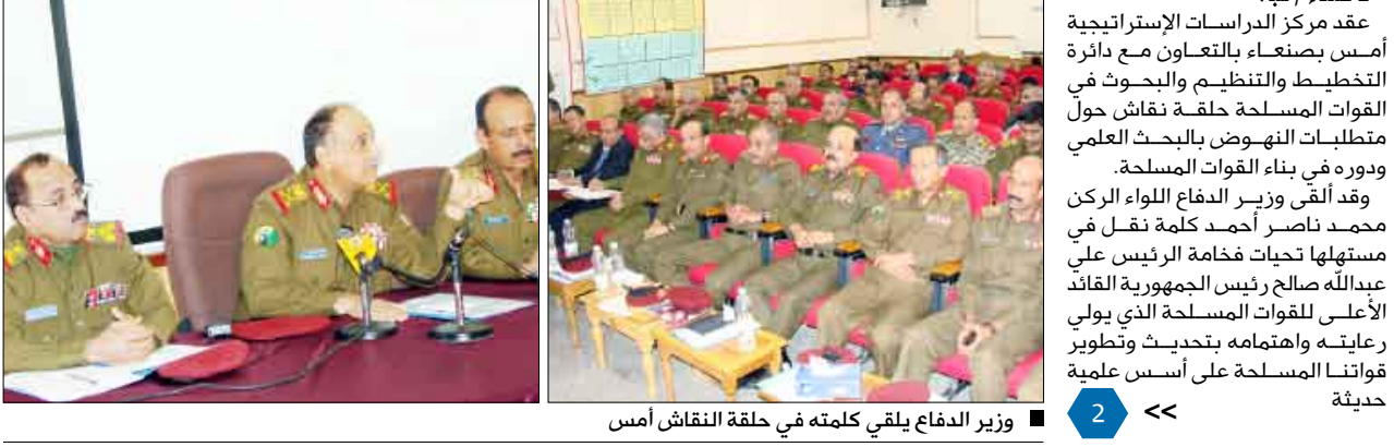
وزير الدفاع يلقي كلمته في حلقة النقاش أمس