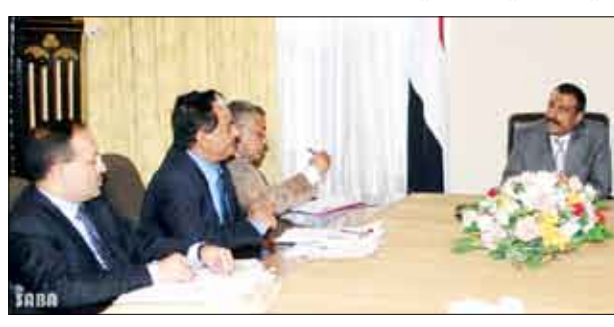
اجتماع اللجنة العليا للانتخابات أمس