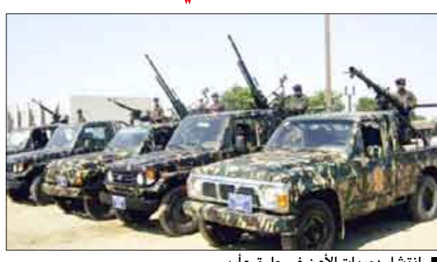
انتشار دوريات الأمن في طرق مأرب