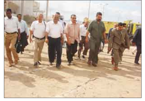
المحافظ يتفقد ملعب 20 مايو