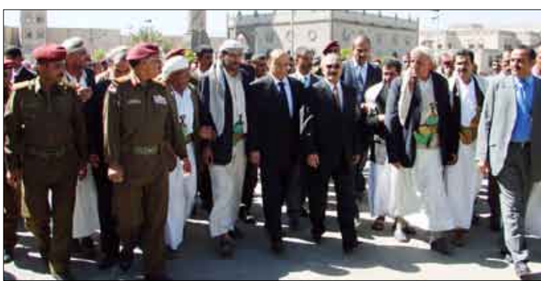
.. ويتقدم مشيعي شهداء الوطن