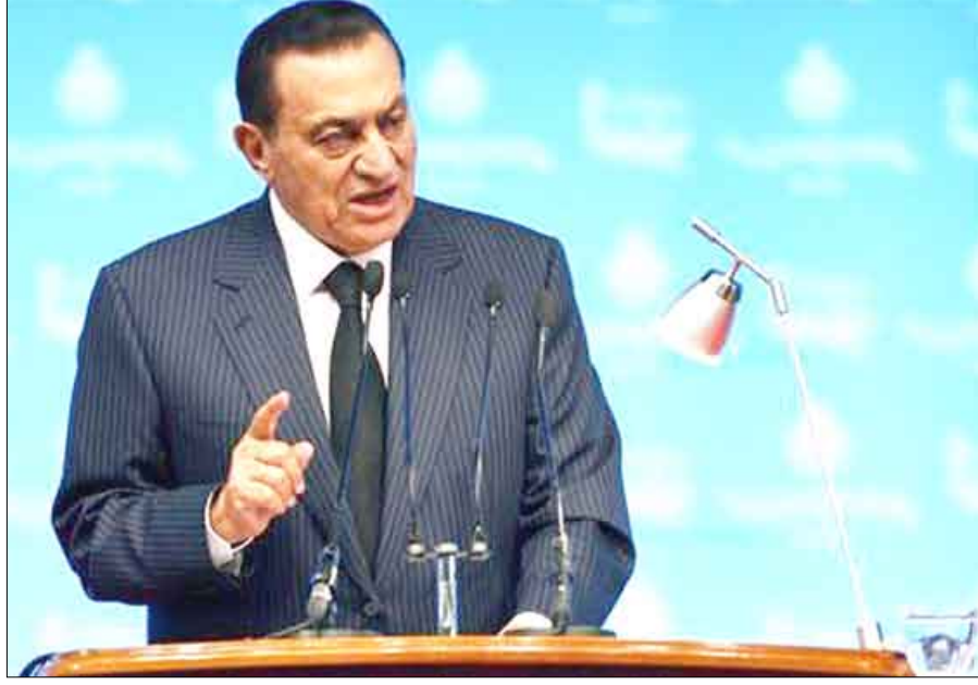
الرئيس المصري حسني مبارك خلال اجتماع مجلسي النواب والشورى المصريين

أعرب الرئيس المصري حسني مبارك عن أسفه لتدهور الوضع العربي الراهن، وحذر من تدخل إيران في الشأن العربي.