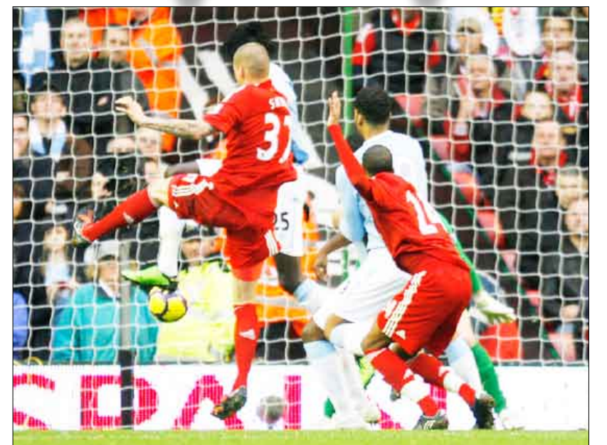
لقطات من مباريات الدوري الإنجليزي

وتقدم وست هام بهدفين نظيفين سجلهما المكسيكي غيبرمو فرانكو بضربة رأسية إثر ركلة ركنية (5)، وباك كوليسون بضربة رأسية إثر تمريرة عرضية (11). وانقضت اصحاب الأرض وسجلوا ثلاثة أهداف عبر كارلتون كول (27 خطأ في مرمى فريقه) والغيني كامل الزيات من متابعته من مسافة قريبة لكرة من ركلة حرة جانبية (44) وجيمي بولارد (45 من ركلة جزاء)، بيد أن البرتغالي مانويل دا كوستا أدرك التعادل للضيوف في الدقيقة 69. وفاز برمنغهام على فولهام بهدف وحيد سجله لي بوير في الدقيقة 16 بكرة ساقطة إثر انفراد بالحارس داخل المنطقة. وتختتمت المرحلة اليوم الأحد فيلعب بولتون مع بلاكين، وتوتنهام مع ويغان، وستوك سيتي مع بورتسموث.