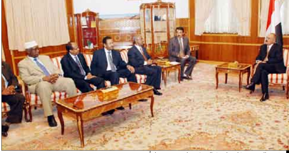
رئيس الجمهورية لدى استقباله وفد دول تجمع صنعاء أمس

صنعاء / متابعات : نفذ أبطال القوات المسلحة والأمن البواسل في محور سفيان قبل ظهر يوم الجمعة هجوماً كاسحاً على مواقع وأوكار كانت تتركز فيها عناصر الإرهاب والتخريب الحوثية في ما تبقى من تبة البركة وسلسلة التباب المجاورة لها من الجهة الجنوبية الشرقية المطلة على وادي عبلية ووجهوا لتلك العناصر ضربات قوية وموجعة أفقدتها القدرة على الرد ،