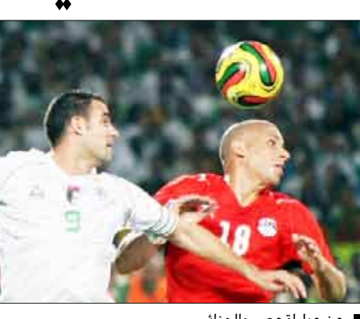
من مباراة مصر والجزائر

اجتمع المهندس حسن صقر رئيس المجلس مع مجلس إدارة الاتحاد المصري لكرة القدم في مقدمتهم سمير زاهر أن الرئيس مبارك قرر صرف تلك المكافآت عقب الاجتماع باللاعبين غدا الاثنين. وذكر البيان أن الدولة لن تنازل عن حقها فيما حدث من اعتداءات من الجزائريين تجاه المصريين في الأراضي السودانية وتم الاتفاق مع رجال الاتحاد المصري لكرة القدم على إعداد ملف قوي لإرساله للاتحاد الدولي لكرة القدم "فيفا" بحيث يتولى اتحاد الكرة تلقي كافة الوثائق من الصور والفيديو التي تظهر التجاوزات والاعتداءات من الجمهور الجزائري. ويبدأ مسئولو الاتحاد تلقي هذه المستندات من العاشرة صباح الأحد وحتى الساعة الثالثة عصرا وتحدد يوم الأربعاء موعداً نهائياً لإرسال الملف ليفيفا.