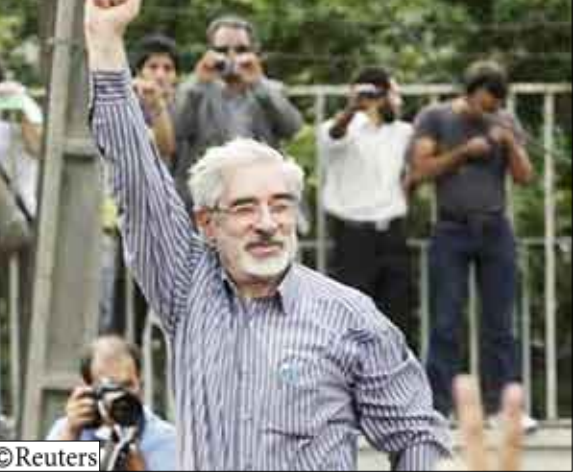
مير حسين موسوي

وأعلن موقع إلكتروني على شبكة الإنترنت أن ابنة الزوجين القتيلتين اللذين طعنتهما عملاء أمن إيرانيون حتى الموت عام 1998 دعت الناس لحضور تجمع يوم الأحد لحياء ذكرهما.