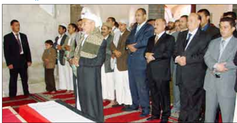
رئيس الجمهورية يؤدي الصلاة على أرواح الشهداء في جامع مجمع الدفاع العرضي