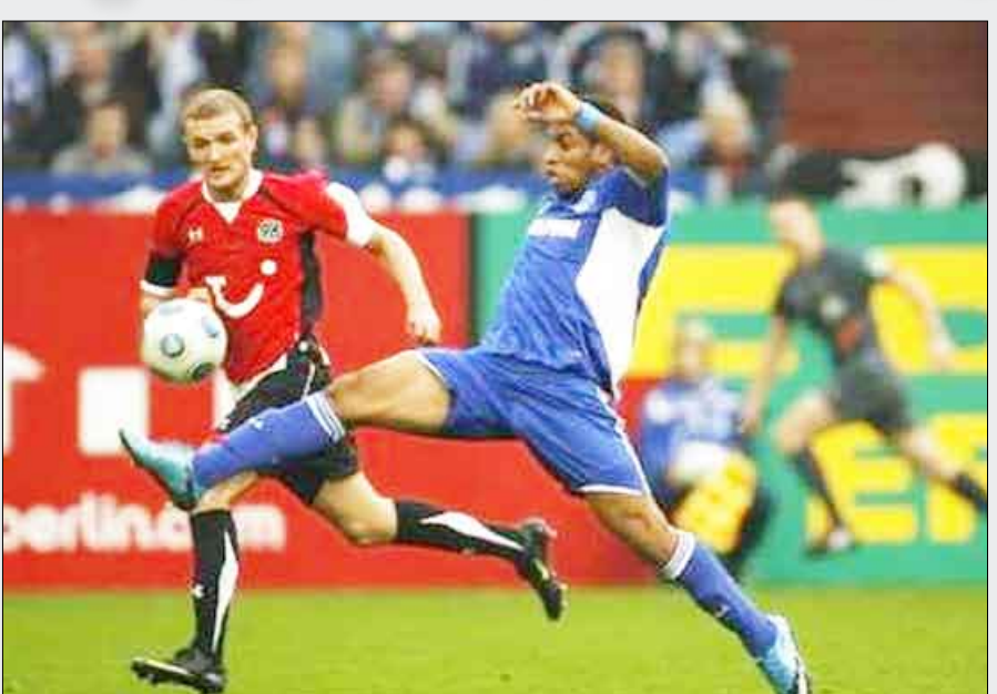
من مباراة هانوفر وشالكة

تتابعت على تسجيلها البرازيلي كارلوس إدواردو (5) والنيجيري تشيندو أوباسي أوجوكوي إيدو (11) والفرنسي ديمبا با (46) والبوسني واد إيبيسفيتش (90 من ركلة جزاء). ورفع هوفنهايم رصيده إلى 23 نقطة بفارق الأهداف أمام هامبورغ وبفارق نقطتين أمام فولفسبورغ الذي خسر أمام ضيفه نورمبرغ بهدفين لأشكان ديفاغاه (59) والبرازيلي غرافيتي (77) مقابل ثلاثة أهداف للسويسري ألبير بونياكو (56) وبيير كلوغه في الدقيقة الثالثة من الوقت المحتسب بدلا عن الضائع. وانتزع بوروسيا مونشنغلادباخ فوزاً ثميناً من مضيفه أينتراخت فرانكفورت بهدفين للمقدوني أوكا نيكولوف (55) خطأ في مرمى فريقه والهولندي روبيل بروفيرز (66)، مقابل هدف للسويسري بيرمين شفيغور (86 من ركلة جزاء).