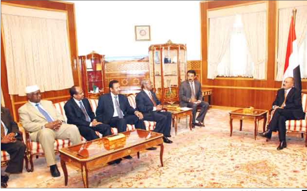
رئيس الجمهورية خلال لقائه وفود تجمع صنعاء