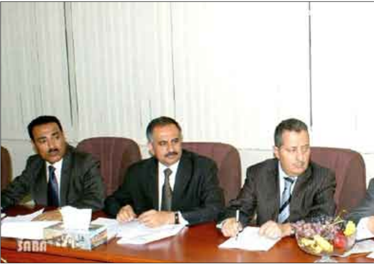
الهيئة العليا للرقابة على المناقصات والمزايدات في اجتماعها أمس