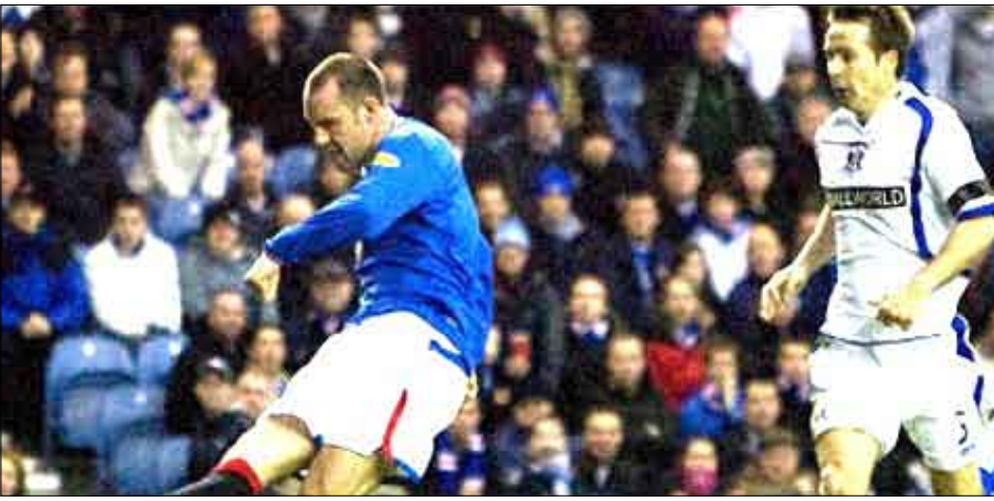
من مباراة رينجرز وكيلمارنوك