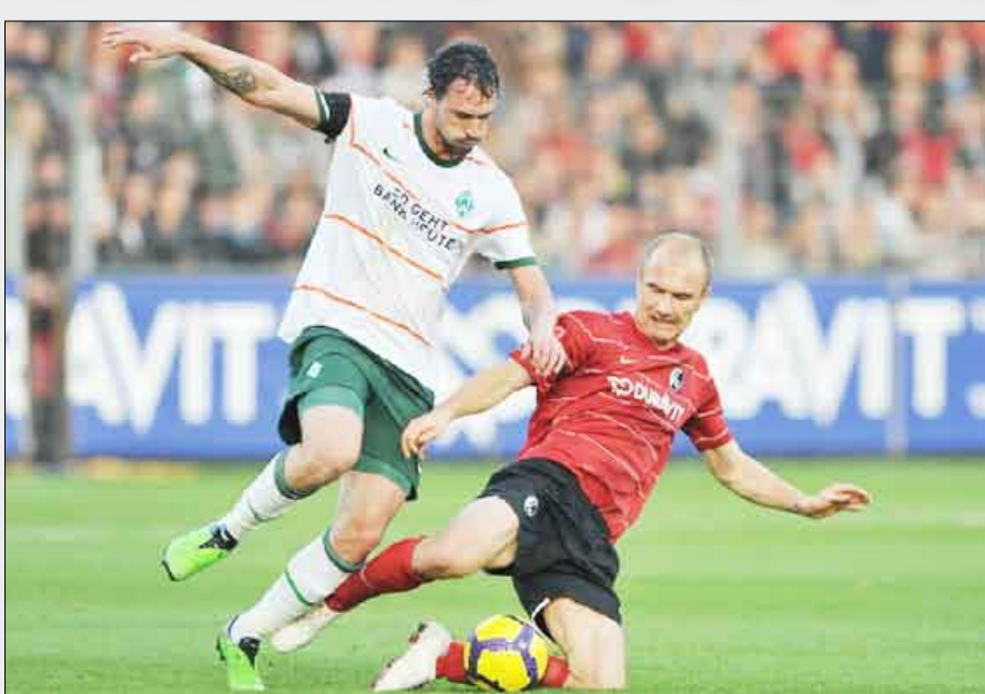
من الدوري الألماني

شالكة ٣-٠. وارتقى شالكة إلى المركز الثالث مؤقتاً بفوزه الصعب على ضيفه هانوفر بهدفين