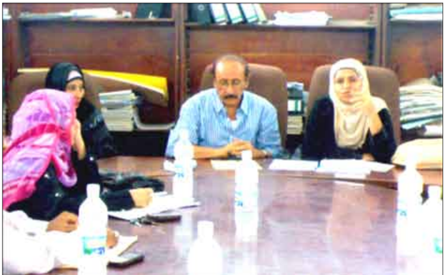
جانب من الحلقة النقاشية

بدأت صباح أمس بقاعة المجلس المحلي لمديرية الشيخ عثمان فعاليات حلقة النقاش الخاصة بآلية تعزيز الشراكة بين السلطة المحلية والمدارس ومنظمات المجتمع المدني التي نظمتها مؤسسة دعم التوجه المدني الديمقراطي "مدى" بالتنسيق مع المجلس المحلي بالمديرية واستمرت يوماً واحداً. وناقشت الحلقة ثلاثة محاور أساسية هي آلية تعزيز الشراكة في المواطنة بين السلطة المحلية والمدارس، ومشاركة المكاتب التنفيذية مع المدارس وإدماج دورها في خططهم السنوية بالإضافة إلى دور المجلس المحلي في التنسيق والتعاون مع المدارس.