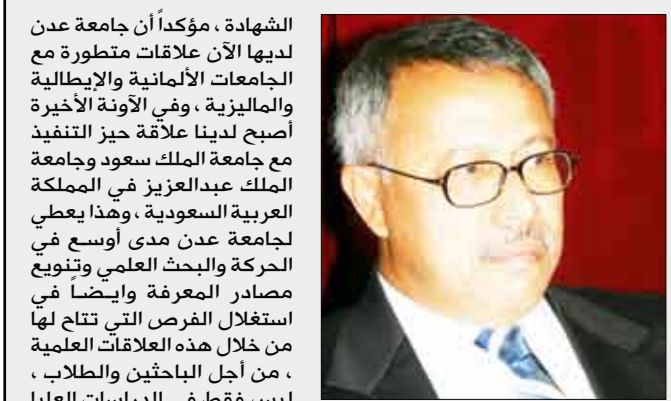
د. بن حبتور