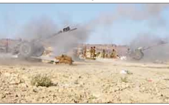
القوات المسلحة تواصل تعقبها للعناصر الإرهابية الحوثية