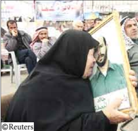
عجوز فلسطينية تبكي وهي تحتضن صورة ابنتها الأسيرة لدى إسرائيل وذلك أثناء احتجاج في مدينة غزة للمطالبة بالأجر عن الأسرى

قال عيسى قراقع وزير الأسرى في الحكومة الفلسطينية أمس السبت إن العمل قد بدأ من أجل الذهاب إلى الأمم المتحدة لانتزاع اعتراف دولي بأن المعتقلين الفلسطينيين في السجون الإسرائيلية هم أسرى حرب.