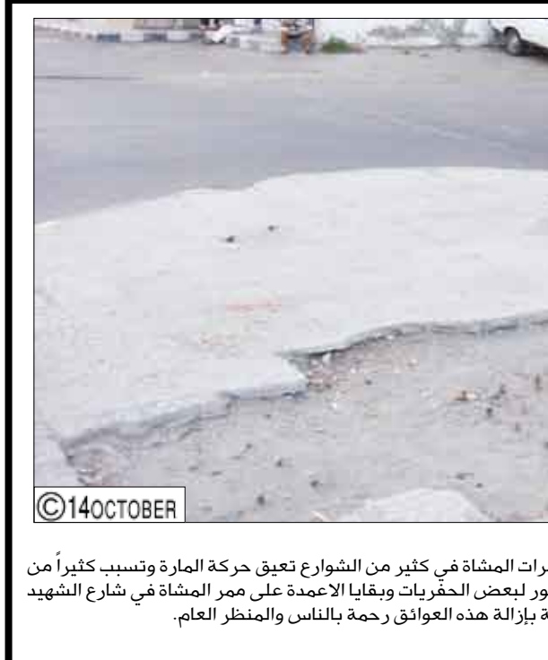
حليث الكاميرا تصوير وتعليق/ علي الدرب: ترك الحفرات وبقياء أعمدة الاعلانات والارارات على مرمرات المشاة في كثير من الشوارع تعيق حركة المارة وتسبب كثيراً من المشاكل والأضرار باستخدام هذه المرمرات. هذه الصور لبعض الحفرات وبقياء الأعمدة على ممر المشاة في شارع الشهيد مدرم أمام البنك العربي نتمنى أن تقوم الجهات المختصة بإزالة هذه العوائق رحمة بالناس والمنظر العام.