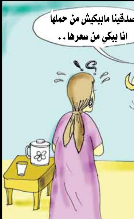
صديقنا مايكيش من حملها انا بيكي من سرها..

باختصار صنعاء السعودية [ ] من يصدر أن سعر اضحية العيد يتجاوز راتب موظف من ذوي الدخل المحدود، وربما موظف متوسط الدخل، فما هو الحل إذن؟! بعض المرافق جزاهم الله على عملهم سهلوا ربما للعيد، لكن للشهور التي تلي العيد لا اعتقد إلا أنهم صعبوها، فمسألة تقسيط قيمة كبش العيد تدل على التكافل الاجتماعي، لكن أن يتم تقسيط قيمة الكبش بعد رفعها إلى أكثر من خمسين في المائة فهذه مسألة احتكار واستغلال حاجة الموظف الغليلان الذي يريد أن يفرح أولاده ويعيد معهم مثل بقية خلق الله وقد نهى عنها الإسلام، وبمجرد أن ينتهي العيد يبدأ يكع الأقساط من لقمته عيشه وعيش أولاده.. فهل هذا هو التزام؟! مجرد سؤال ليس غير! وإسلاماً