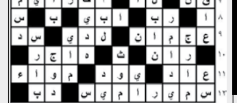
حل الصلح اللامضي

إعداد/ اشواق صالح ناجي أفقياً: 1- قيصر روسيا 1682م وحد السلطنة ونظم الإدارة والجيش وسع حدود بلاده وفرض سيادة الدولة زار بلاد أوروبا أسس بطرسبرج عام 1703م وجعلها عاصمة شجع العلوم فرض نظام السينودس خلفته زوجته كاترين. 2- مطربة اماراتية - عكس ذم - سئم. 3- خاصتي - عملة - جواب. 4- حيوان اليف - من الثمار. 5- أحرف مكررة - من الحبوب. 6- من أكبر الصحف العربية - عمار. 7- صوت المريض - صوت اليوم. 8- أداة جزم - نجل - حرف نصب. 9- في العروق - نقويض أفك - مدينة سورية. 10- عدم نجاح - فرس عنتره بن شداد. 11- بلد أوروبي - حرف موسيقي. 12- من الزهور العطرية - صوت النمل - ماضي يخلق. عمودياً: 1- عملة بنما - عملة بلغاريا. 2- درب - عاتب - رف. 3- سقي النبات - رئيس الملاحين - برهان. 4- امرأة ابراهيم عليه السلام - وجد شديد. 5- والدتي - حيوان - شجرة صغيرة طيبة الرائحة. 6- أحرف مكررة - ربعين - أحد الأبوين. 7- رجاء - سلام واستقرار - قريب. 8- أشدت في العمل - للنفي - نقويض جاهل. 9- يم - محافظة يمنية - في البيضة. 10- حيوان - شهر سرياني - ود. 11- حليب - سفينة الصحراء. 12- بلد عربي - لمعان.